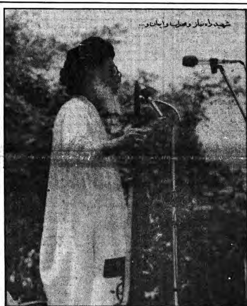
ای با خدا به همدلی خلق آمده، هر پاره تنت، تصویر یک امام به محراب می برد.

تاسیسات مذکور همچنان در آتش می سوزد ۴ نفر و ۸۴ کاتیوشا و مزدور صدام در جبهه های غرب نابود شدند ۸ خودرو در پارکینگ موتوری دشمن در منطقه ذهاب منهدم شد فدائیان امام یکان نفوذی دشمن به گاو میشان را مجبور به عقب نشینی کردند در صفحه ۲