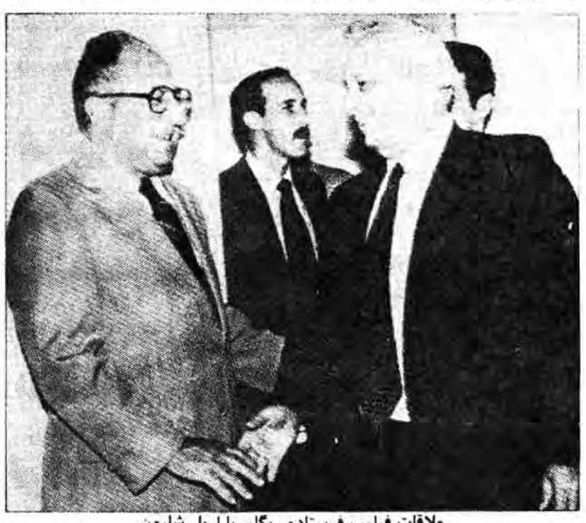
ملاقات فیلیپ فرستاده ریگان با اریل شارون

قصد دارد عقبه خود را در سازمان ارتش تحکیم بخشد. لذا دستور صادر نمود که بموجب آن تعیین رئیس ستاد ارتش از طرف نخست وزیر باید انجام گیرد. مگر به این قول داد مادامیکه او در راس حکومت قرار دارد به شارون اجازه صادر کردن دستورات را ندهد.