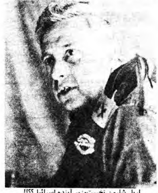
اریل شارون نخست‌وزیر آینده اسرائیل!!!

* وزیر دفاع اسرائیل کنترل موسسات صنایع جنگی و بررسی‌های نظامی اسرائیل را در دست گرفته است. * شارون، حاضر نشد کابینه اسرائیل را از متن سری قرار داد استراتژی میان اسرائیل و آمریکا مطلع سازد.