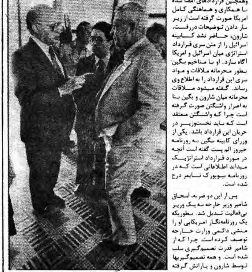
نگاهی پرمعنی شارون به بگین

دست‌گیری و مستولین نظامی این دستگاه‌ها را به کارمندان معمولی تبدیل کند تا هیچگونه قدرت و نفوذی در ارتش نداشته باشد. پس از آن، شارون هر چه در توان دارد در جهت ارتقای مقام خود اقدام خواهد کرد. او در این زمینه اقدامات گسترده‌ای در دست دارد.