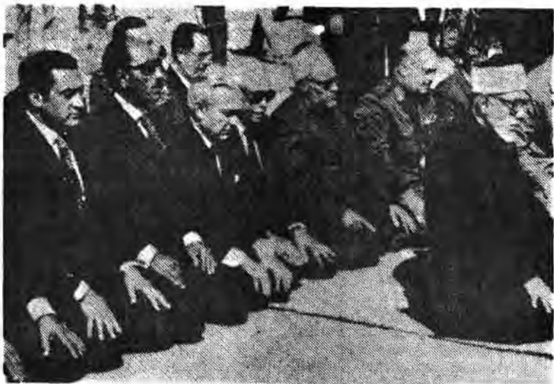
سادات خاتن معدوم و همپالکی هایش برای ملت مسلمان مصر، گهگاه نماز هم میخوانند

پرسشها، به مسأله‌ای از شیخ‌الاهر استاد میکند که قلاً مشرف شده بوده و طی آن علت اینکه ویلیدیها و ویدئوهای اینهمه در جامعه مسلمانان را حکم نکردن بجا انزال الله دانسته است و نیز نظر وی را می‌سیر بر وجوب اقامه حدود الهی از آن نوشته نقل میکند.