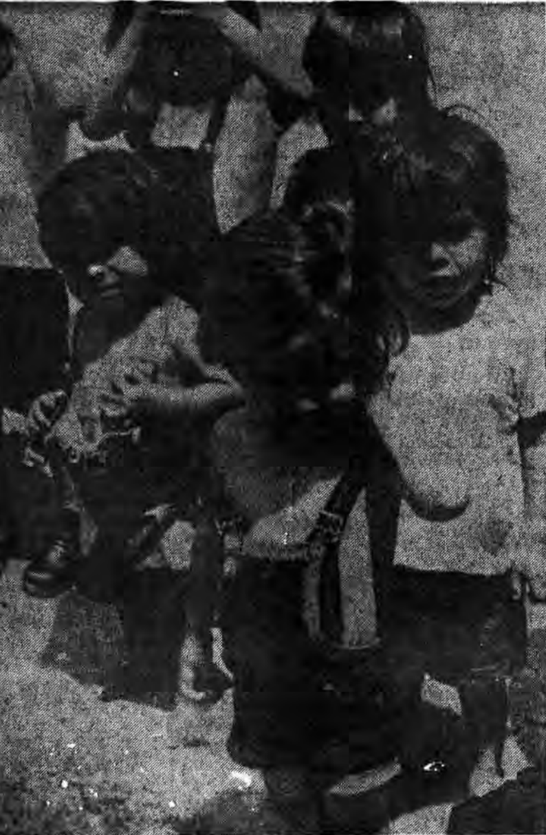
فقر، پریشانی و درماندگی در آمریکای مرکزی یکی از آثار شوم مداخله اقتصادی ایالات متحده در این منطقه است.

هدف از پس صف سران نظامی ال سالوادور، به دامنه‌های (چین چون تک) حمله کردند، اما همه این حملات بی‌فایده بود و نیروهای سورا تلفات سنگین را تحمل می‌کردند. پس از دو هفته حملات پیوسته، نیروهای سورا مجبور شدند عملیات را منقطع سازند، مدتی طول کشید تا