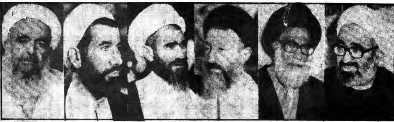
آیت‌الله منتظری، آیت‌الله دستغیب، آیت‌الله بهشتی، آیت‌الله مشکینی، آیت‌الله محمدتقی جنتی، آیت‌الله صمدی

سومین دبیرکل حزب جمهوری اسلامی برای نخستین بار بازگو کرد: