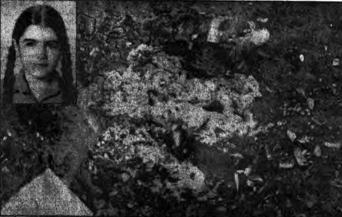
سنگرش خیران باارهای خون آلود بدن تکه تکه این نواز ۸ ساله پیوسته شده است. یکی از فرزندان خدیجه اثر انگیز دیروز بود. مسزهران آمریکا کتبی و دفترش را به خودش زدند. نمیتوان گفت در قلب کوچک او در آن هنگام چه میگذشت، اما امروز قلب کوچک همکلاسی از نفرت و کینه نسبت به آمریکا و مسز دوراننش نباشد است.

بیکر مطهر شهدای میدان سپاه، امروز از مقابل مسجد ارک تشییع می شود