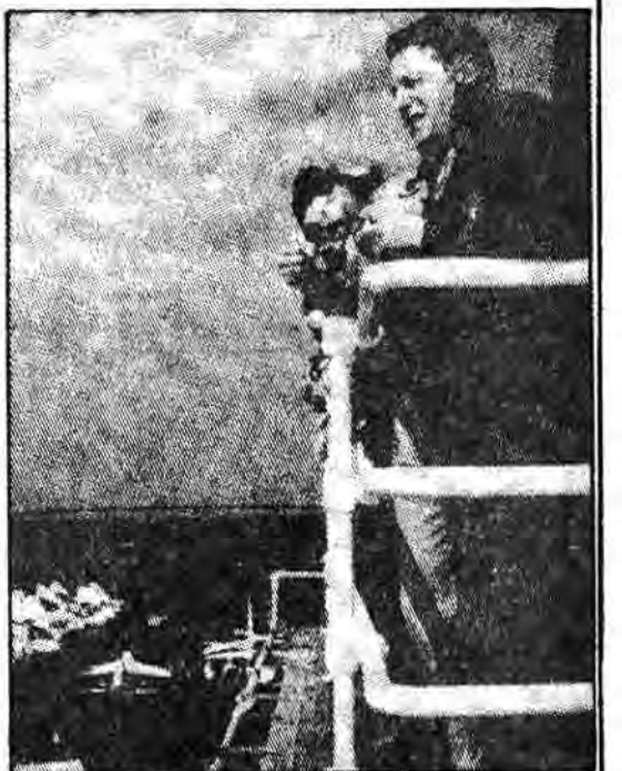
واین برگر وزیر دفاع بر عرشه ناو هواپیمابر کانی

سنانو هوار دیکر، رهبر اکثریت سنی آمریکا و «ویت دومینک» رئیس کمیته بودجه سنی آمریکا و حتی دموکراتهای سنی تندرو و ماند سنانو هری (اسکوپ) و سناتور فرتیورا لیسچر و سناتور آرمسترانگ در کلورادو در صف آنها قرار دارند. بعضی از آنها منتقدان رای دهنده‌ها به آنها بیش از این قطع بودجه‌های رفاهی و اجتماعی را بدون تلاش برای کنترل بودجه نظامی می‌خواهند که متعین بودجه دفاعی سیزده میلیارد دلار است. سنانو هری سیزده میلیارد دلار بودجه دفاعی سیزده میلیارد دلار است. سنانو هری سیزده میلیارد دلار بودجه دفاعی سیزده میلیارد دلار است.