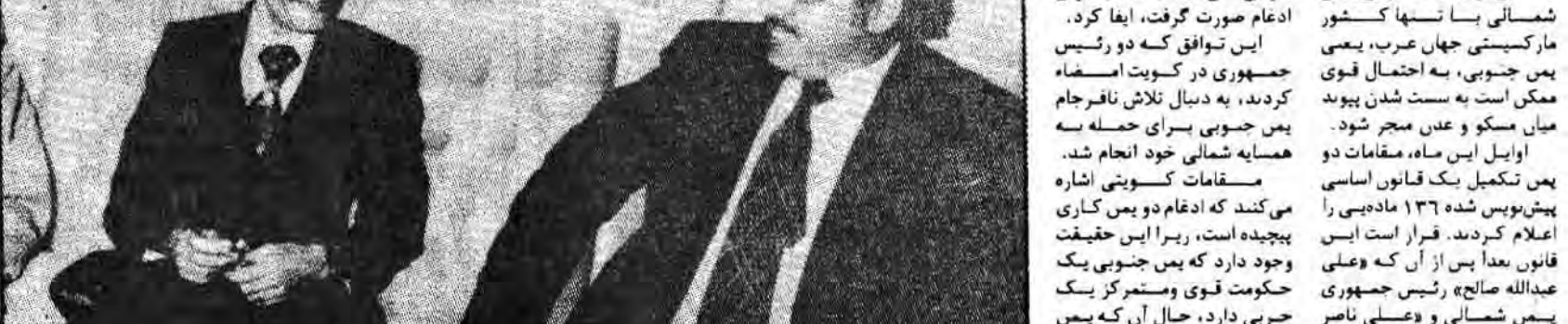
دو رئیس جمهور یمن شمالی و جنوبی

نظامی به ایالات متحده اعطا کرده‌اند از سوی دیگر یمن شمالی دارد. علاقه رایج خود جلب می‌کند و این به سبب وضع اساسی آن در ساحل دریای سرخ واقع در سر جنوب غربی عربستان سعودی است. عیان ادعای کند که یمن جنوبی و کم کم یمن جنوبی به یمن شمالی در عمان است. این اتحادیه تهدید می‌کند در یمن جنوبی به یمن شمالی در عمان است. این اتحادیه تهدید می‌کند در یمن جنوبی به یمن شمالی در عمان است. این اتحادیه تهدید می‌کند در یمن جنوبی به یمن شمالی در عمان است.