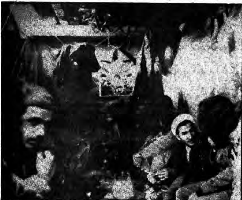
همدوش با برادران رزمنده در سنگر نشسته تا همانگونه که در محراب و منبر با آمریکا و دیگر ابرقدرتها می جنگد در سنگر نیز با عمال آمریکا بجنگد.

اسقف کاپوچی پس از بازدید از اردوگاه حشمتیه: از اسرای عراقی در ایران به نحو احسن نگهداری می شود