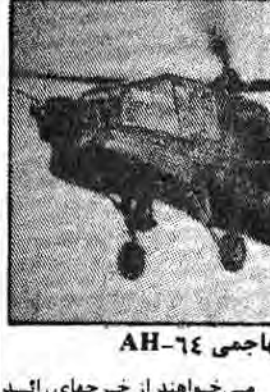
هلیکوپتر تهاجمی AH-64

همچنین در لیست سیاه متعین، تاک M-1 قرار دارد که بهای فعلی آن ۳۴ میلیون دلار است و حدود ۳۰۰ میلیون دلار برای خرید یک فروند دیگر در نظر گرفته شده است. این جنگنده‌ها در حال حاضر در اختیار نیروی هوایی آمریکا هستند و برای عملیات در مناطق مختلف جهان استفاده می‌شوند.