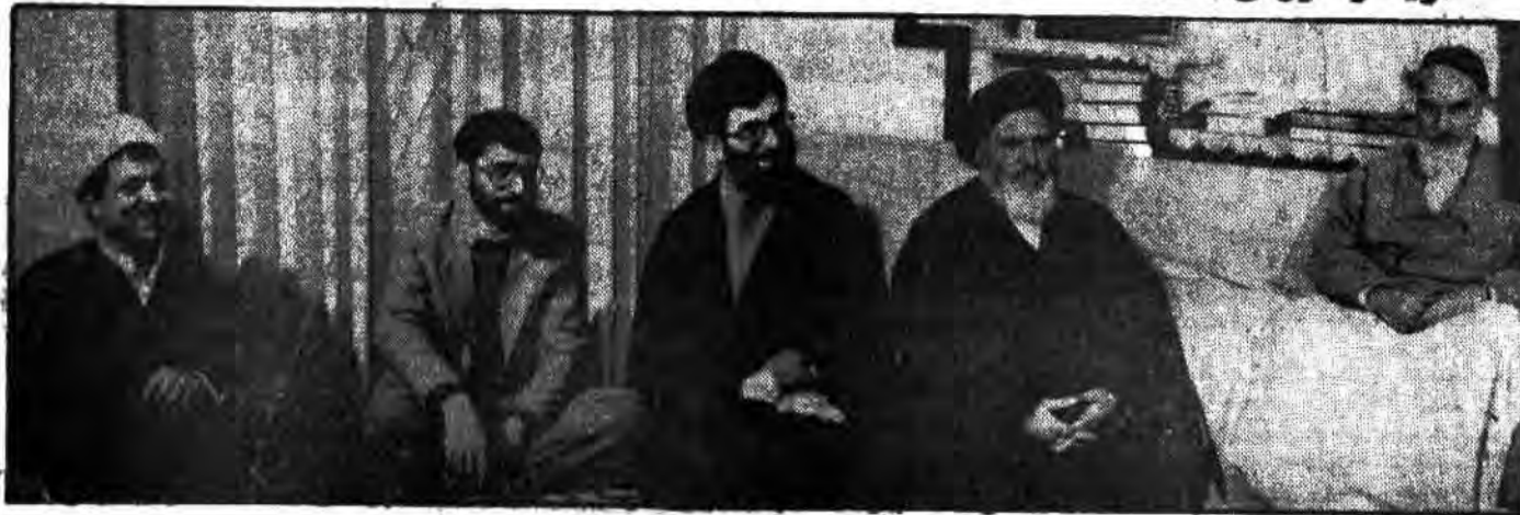
رؤسای قوای سه گانه در حضور امام

امام امت در دیدار با رئیس جمهور، رئیس مجلس، رئیس دیوانعالی کشور و نخست وزیر: