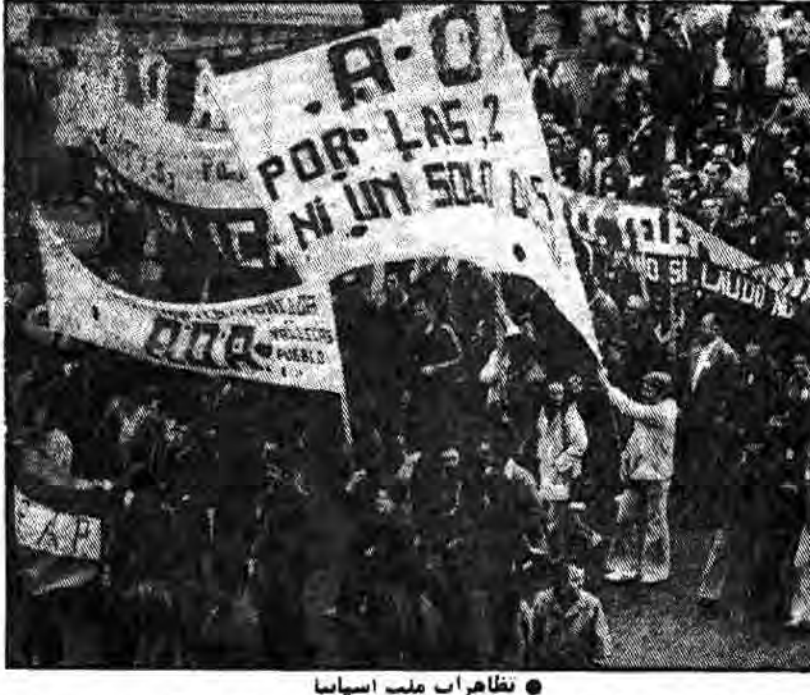
نظارت ملت اسپانیا

در پی موافقت پارلمان اسپانیا جهت ارائه درخواستی مبنی بر پیوستن این کشور به پیمان آتلانتیک غیرعزم لروم موافقت نهایی کنگره آمریکا و پارلمانی دیگر کشورهای عضو، این پیمان به درخواست اسپانیا پاسخ مثبت داد. در اینجا سوالی که مطرح میشود این است: چرا دولت اسپانیا تمایل پیوستن به پیمان آتلانتیک پیدا کرد؟