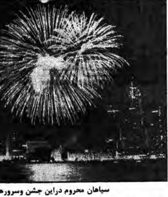
سیاهان محروم در این جشن سورورا سهمی ندارند.

نشان میدهند. بطور مثال اعضای کولکس کلان که در نوامبر سال ۱۹۷۹ در گورینسور واقع در کار- ولینای شمالی پنج تن از طرفداران مبارزات ضد نژاد پرستی را بقتل رسانیده بودند، یکسال بعد توسط یک هیئت منصفه که منحصر از سفیدپوستان تریکب یافته بود، تبرئه شدند. در سراسر کشور و نه