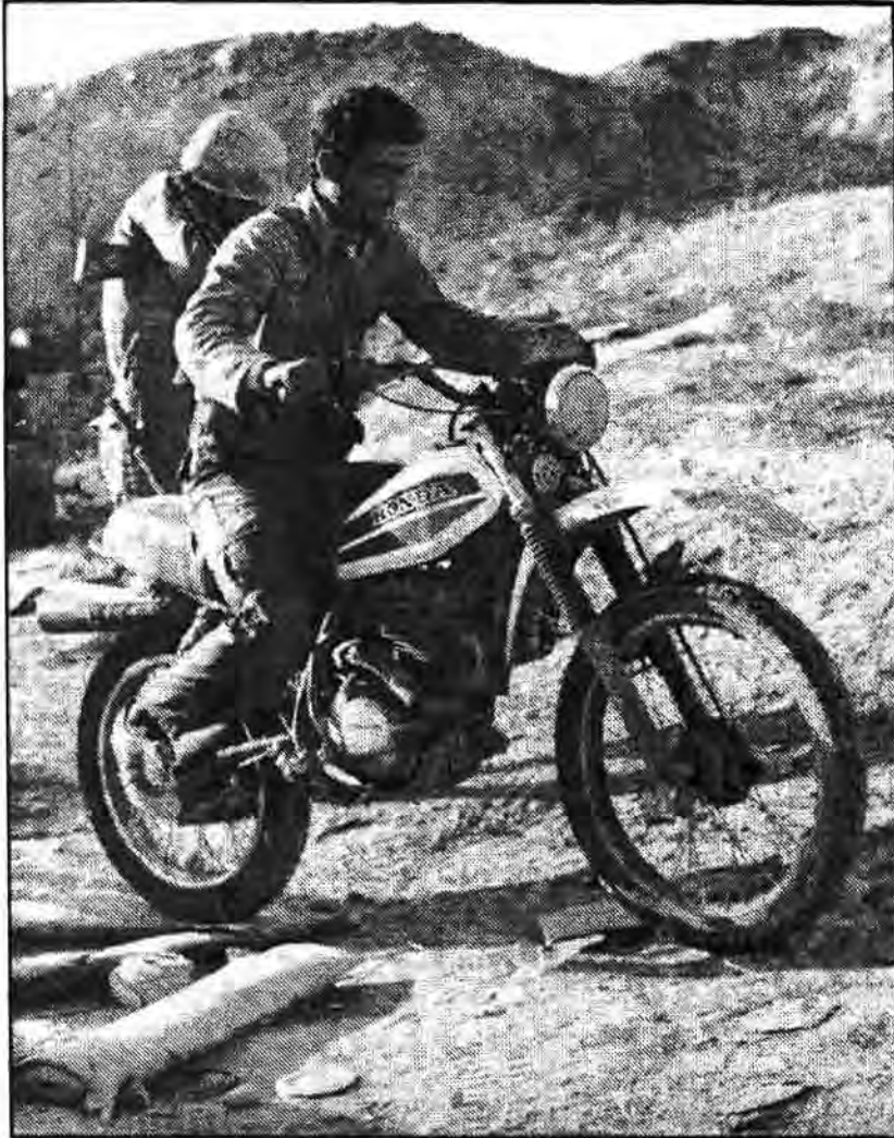
تک سواران عرصایمان با عزمی راسخ و قلبی مملو از عشق به الله سوار بر موتور میروند تا سیادی گردند از برای تانکها و توپهای دشمن.