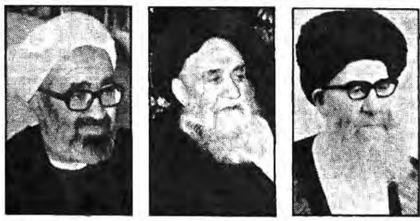
آیت... العظمی... آیت... العظمی... آیت... العظمی...

۷۹ روحانی از شهرهای قم و مشهد عازم جبهه‌های سرد شدند