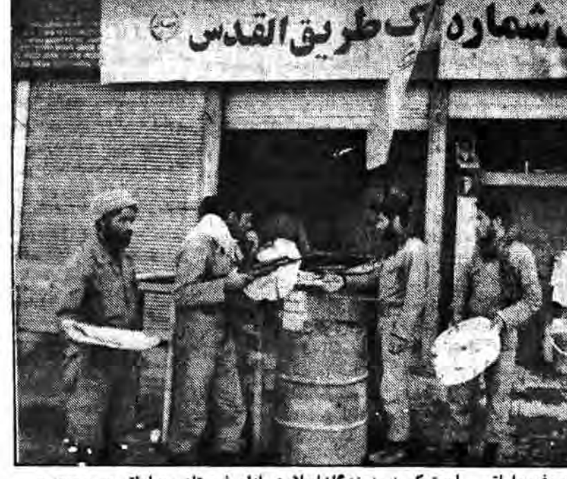
اینجا همان نانوایی معروف صلواتی است که رزمندگان اسلام در ازای فرستادن صلواتی بر محمد و ائمه نانی می گیرند و زندگی بی پیرایه خود را همچون اسلاف پاک خویش که با خود در دست داشتن بیت المال با قرص نانی خود را سیر می کردند می گذرانند کجا باند آنها که ما را در حصر اقتصادی فرو بردند تا وفور نعمت را ننگرند.

بستان رسیدم در سنگر برادری را دیدم که سلاحی بردوش داشت و زیر لب دعا کرده و یکصد فریاد میزدند بستان رسیدم در سنگر برادری را دیدم که سلاحی بردوش داشت و زیر لب دعا کرده و یکصد فریاد میزدند