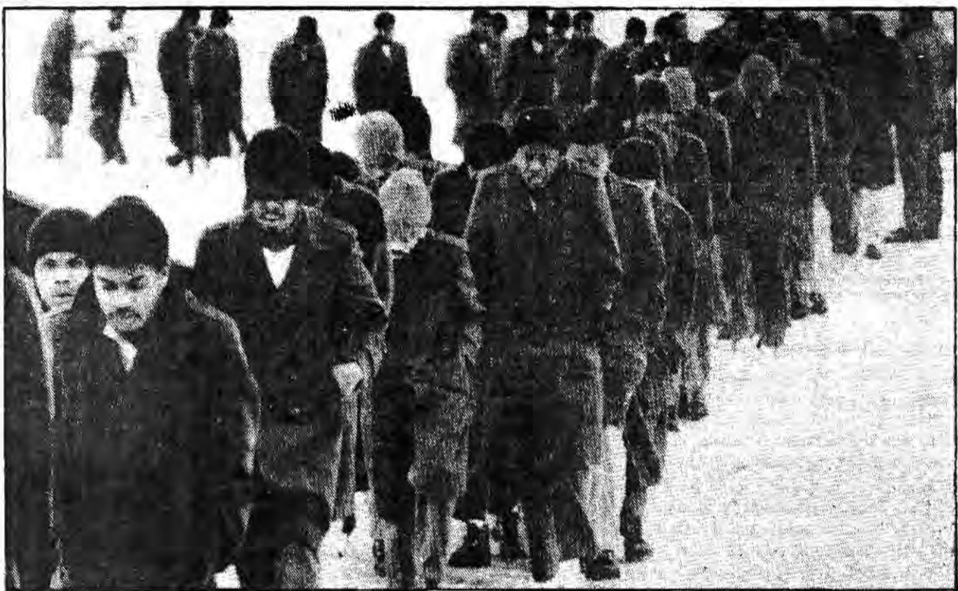
استقبال یخزده در سرزمین موعود؛ رژه از زندان به کافه تریا در زندان فدرال در استویل نیویورک

در حالیکه این محله صاحب بالاترین میزان مرگ و میر در تمام کشور آمریکا است و سرویسهای بهداشتی آن هیچگاه جوانگوی نیازهای این منطقه نبوده است. این عمل سخوی در نحوه