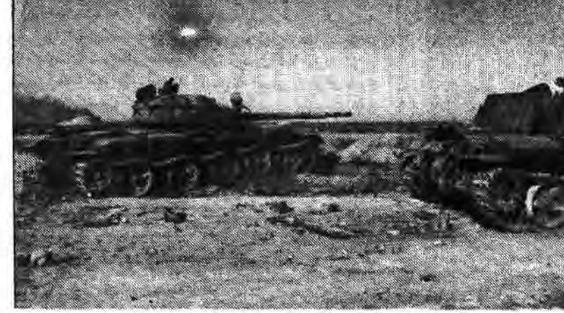
صدام تکریتی با این هدف، یورش وحشیانه خود به ایران را آغاز کرد که پس از یک هفته ایران را تصرف و انقلاب اسلامی را در نطفه خفه کند اما اکنون پس از ۱۸ ماه از نبرد برای صلح و آتش بس دست بدامان مجامع بین المللی شده است.

بستان رسیدم در سنگر برادری را دیدم که سلاحی بردوش داشت و زیر لب دعا کرده و یکصد فریاد میزدند بستان رسیدم در سنگر برادری را دیدم که سلاحی بردوش داشت و زیر لب دعا کرده و یکصد فریاد میزدند