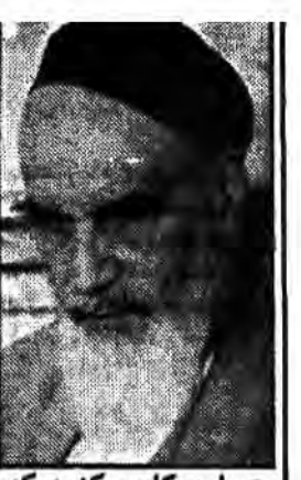
باید کاری کنید که دشمنان اسلام مصداق معینی از نقاط ضعف شما نداشته باشند.

برای ارشاد و هدایت زندانیان تلاش بیشتری بعمل آید