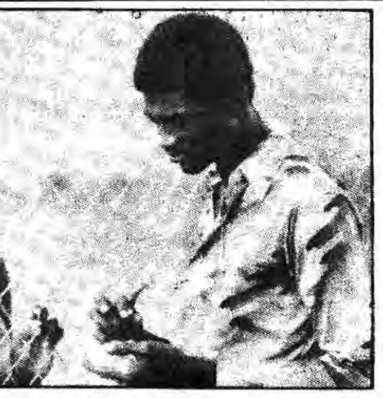
زن وشوهر در مراکز سواد کمپ گروم.

نهانه احتیاج از یک و تمییز در جهت عکس! در حال کنار گذاشته شدن و فراموشی است. در جهت اعمال همین طرز تکرار است که وزارت دادگستری، مدارس شیکاگو را در انتخاب نحوه حمل دانش‌آموزان مدارس که قلاً باستانی اجباراً بوسیله اتوبوس صورت میگرفت- آزاد گذاشته است.