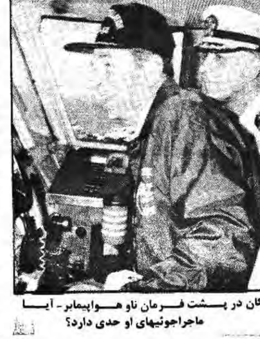
ریگان در پشت فرمان ناو هواپیمابر - ایسا ماجراجویتهای او حدی دارد؟