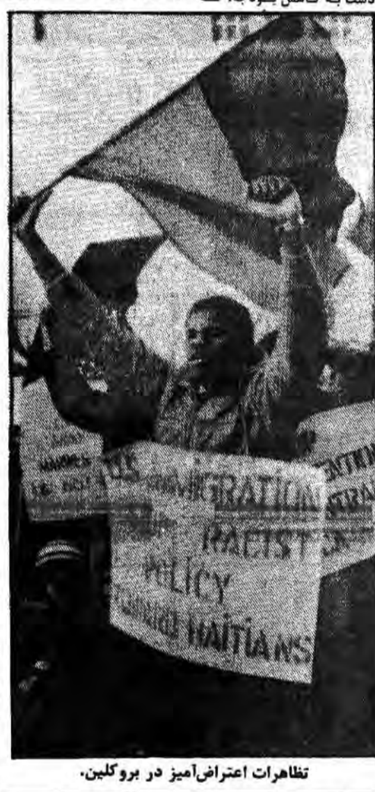
تظاهرات اعتراض آمیز در بروکلین.

در محیط کاهش فعالیت اقتصادی و عکس العمل سیاسی ناشی از آن، دستکاه اداری ریگان، همزمان و در دو جبهه به دستاورهای هر چند محدود ولی قابل لمس، که محمول مبارزه بیست ساله جامعه سیاهپوست آمریکا هست، محسوس شده است. بدین ترتیب که از طرفی دست به کاهش بودجه، که