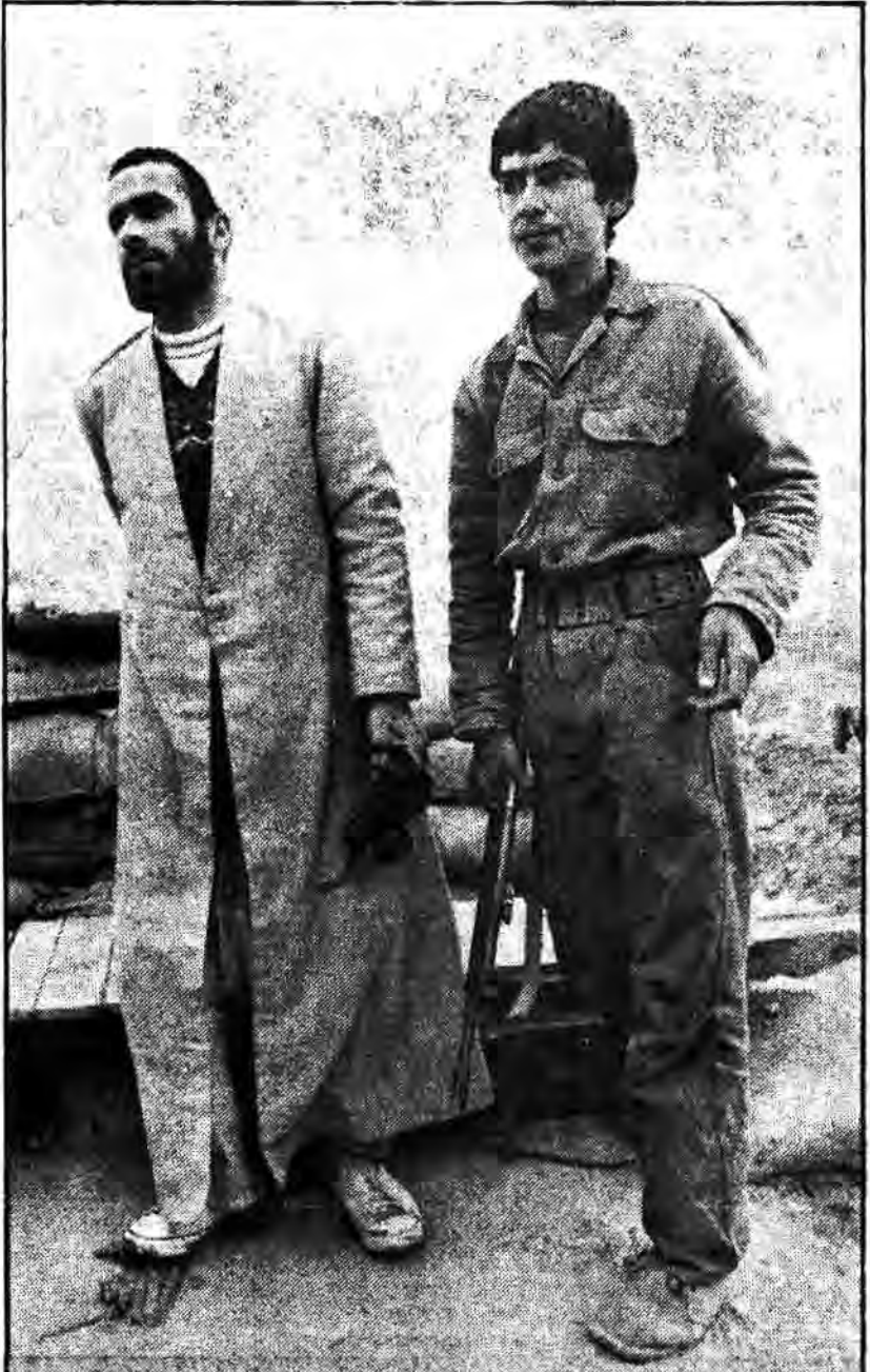
برادر راننده ای که همراه ما بود در نزدیکی یکی از مناطق ویران شده توقف کرد و گفت در اینجا در یک شب دهها انسان شهید شدند که از حمله آنها جانم واقائی بودند که شب اول زندگی را سپری میکردند و وقتی مردم برای نجات آنها تلاش میکردند دیدم که آنها با مشاهده این صحنه اسف انگیز بی اختیار اشکهایشان جاری میشد.

پس از دیدار با نیروهای جمهوری اسلامی به اهواز باز گشتیم. این سفر ضمن کوتاه بودن مدت آن ولی برای ما سفر بسیار پرباری بود. در پایان با آرزوی موفقیت برای رزمندگان اسلام و طول عمر برای امام است باید یادآور شوم که آنچه در