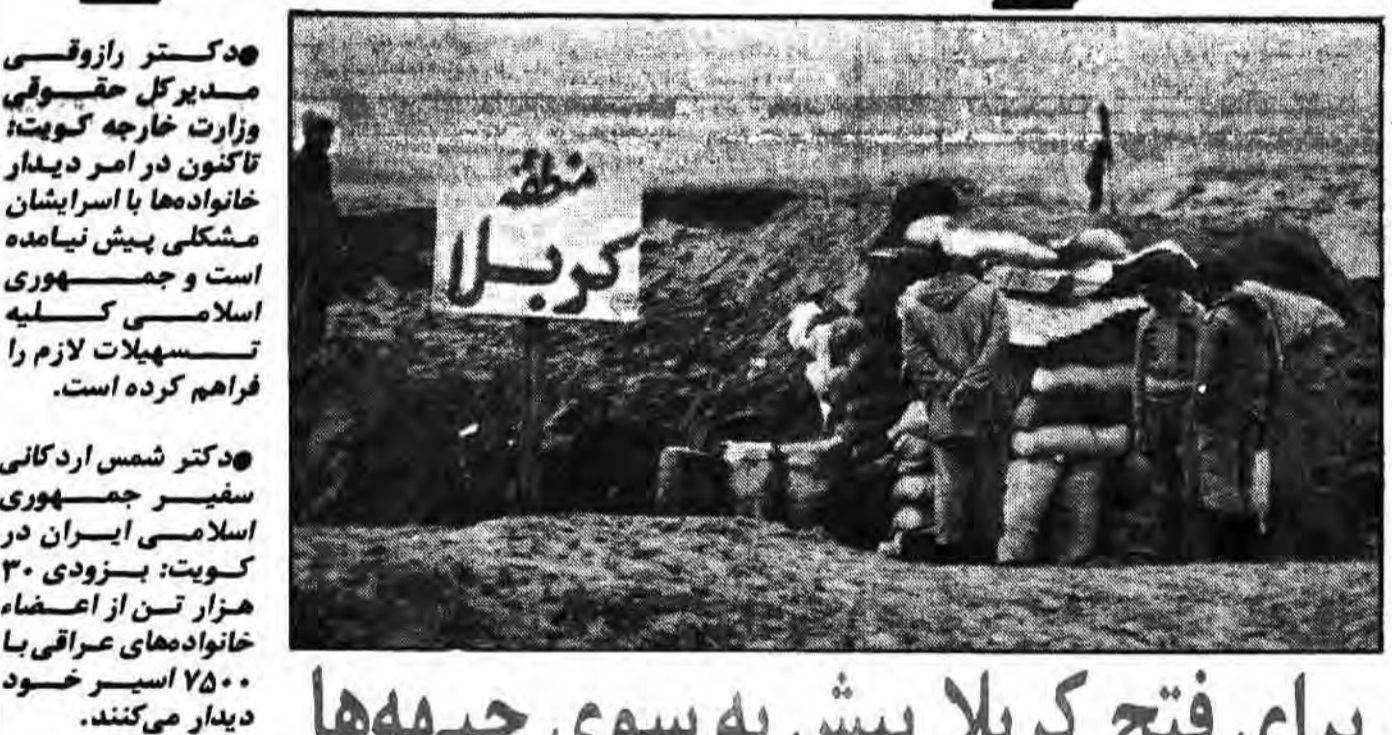
برای فتح کربلا پیش به سوی جبهه‌ها

بلاشگاه کرکوک عراق بر اثر بمباران ۲۴ ساعت در آتش میسوخ ۷۵۰ مزدور صدام در جبهه‌های جنوب کشته و یا زخمی شدند عشایر چریک مسقادی سلاح از قلب مواضع دشمن در گیلانغرب بقیعت گرفتند بدنبال فرار سربازان عراقی: گردانهای ارتش بعث با کمبود نیرو روبرو هستند