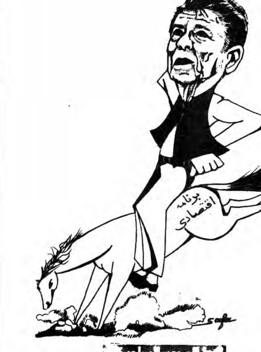
کاریکاتور از: النهار العربی والدولی