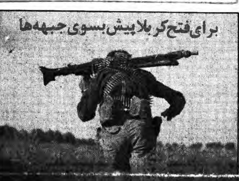
برای فتح کر بلا پیش بسوی جبهه‌ها

جمهوری اسلامی ۱۲ صفحه شنبه ۲۲ اسفند ۱۳۶۰ - شماره ۸۰۸ - سال سوم - شماره ۲۰۰