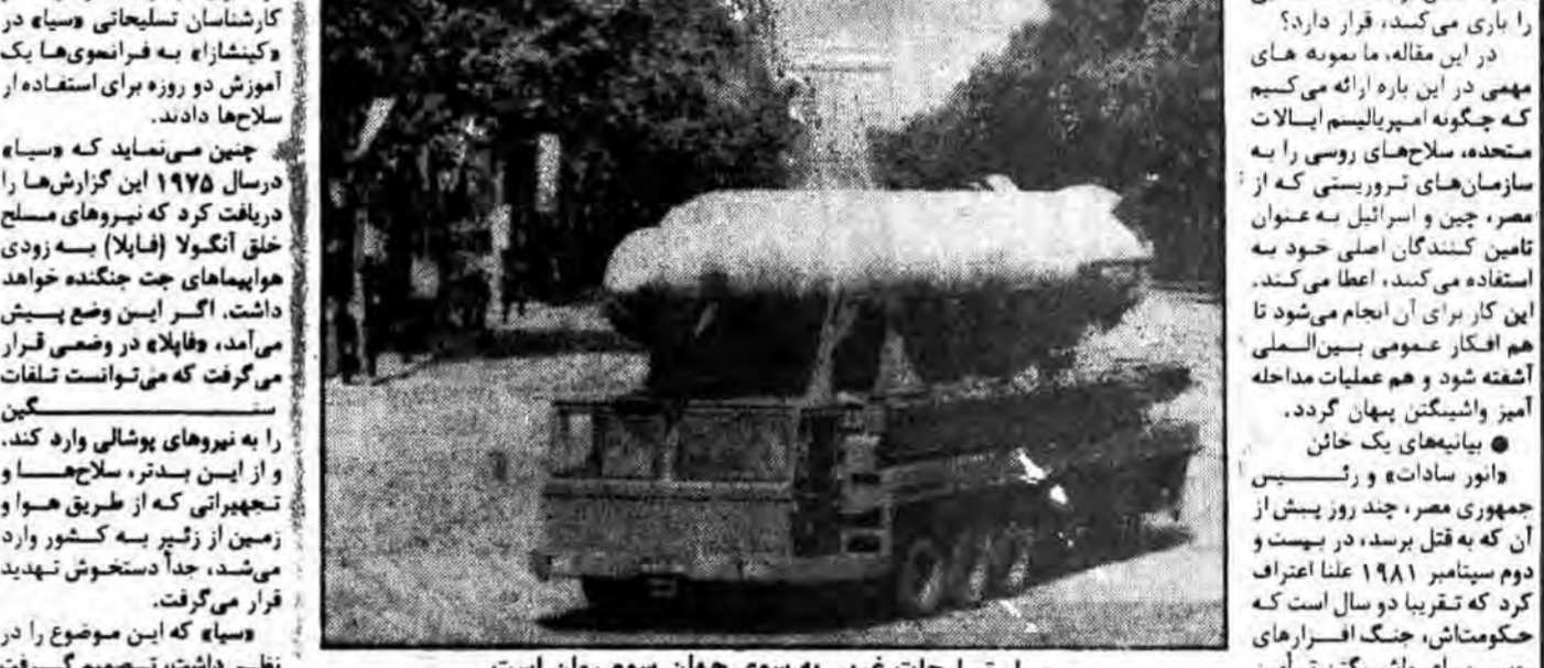
سبل تسلیمات غربی به سوی جهان سوم روان است