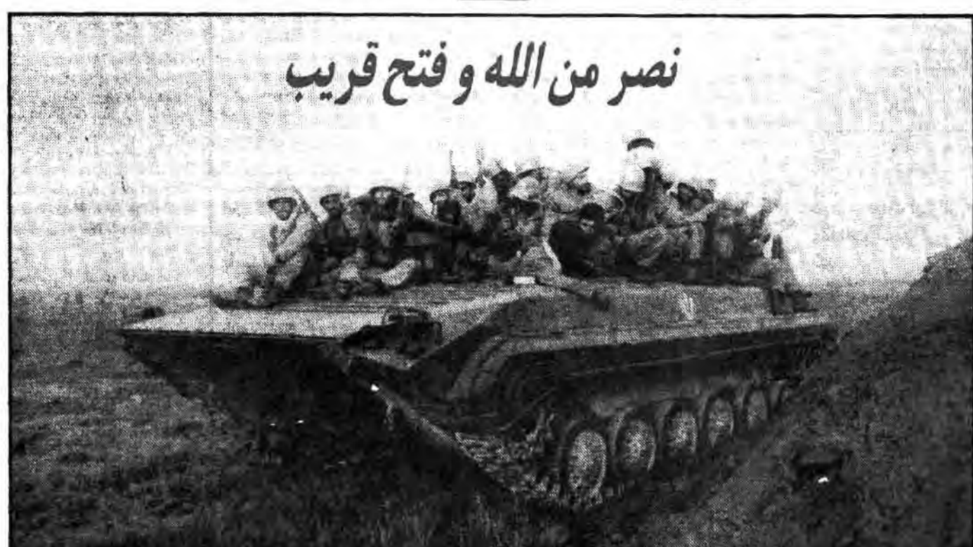
در انتظار فتح نهائی: رزمندگان پیروزمند اسلام که از نیمه شب دیشب در سراسر جبهه بحال آماده باش کامل درآمده اند، در انتظارند تا با صدور فرمان حمله سراسری، خاک ایران را برای همیشه از لوث وجود کفار و مزدوران متجاوز پاک کنند.

شمارش معکوس ساعت (س) حمله از اولین ساعات بامداد امروز آغاز شد یکی از بزرگترین حوضچه های نفتی شمال خوزستان آزاد شد