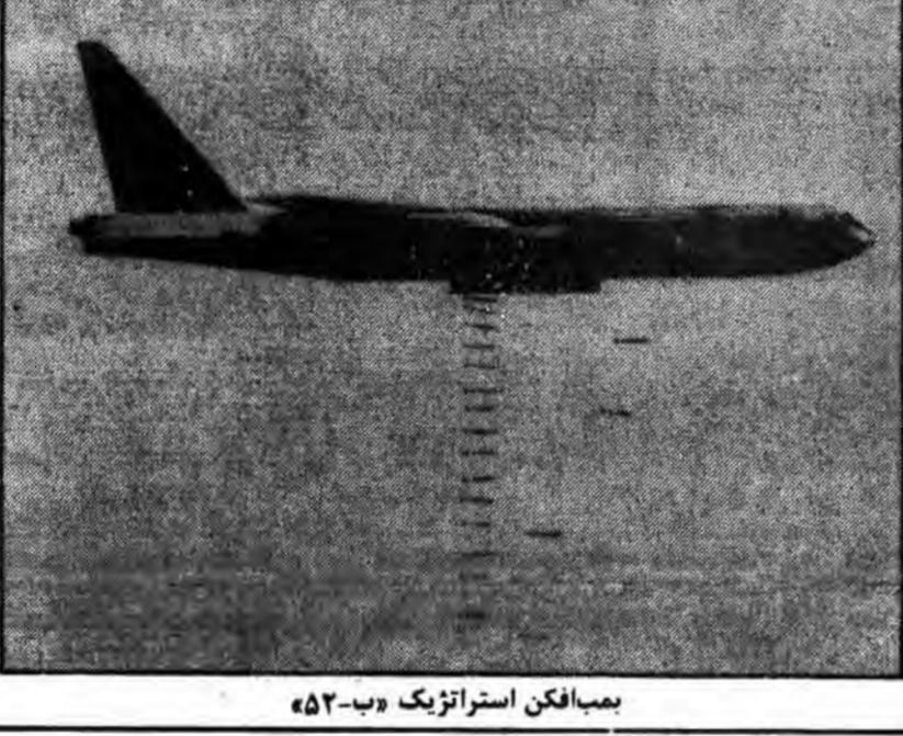
بمبافکن استراتژیک «بی-۵۲»