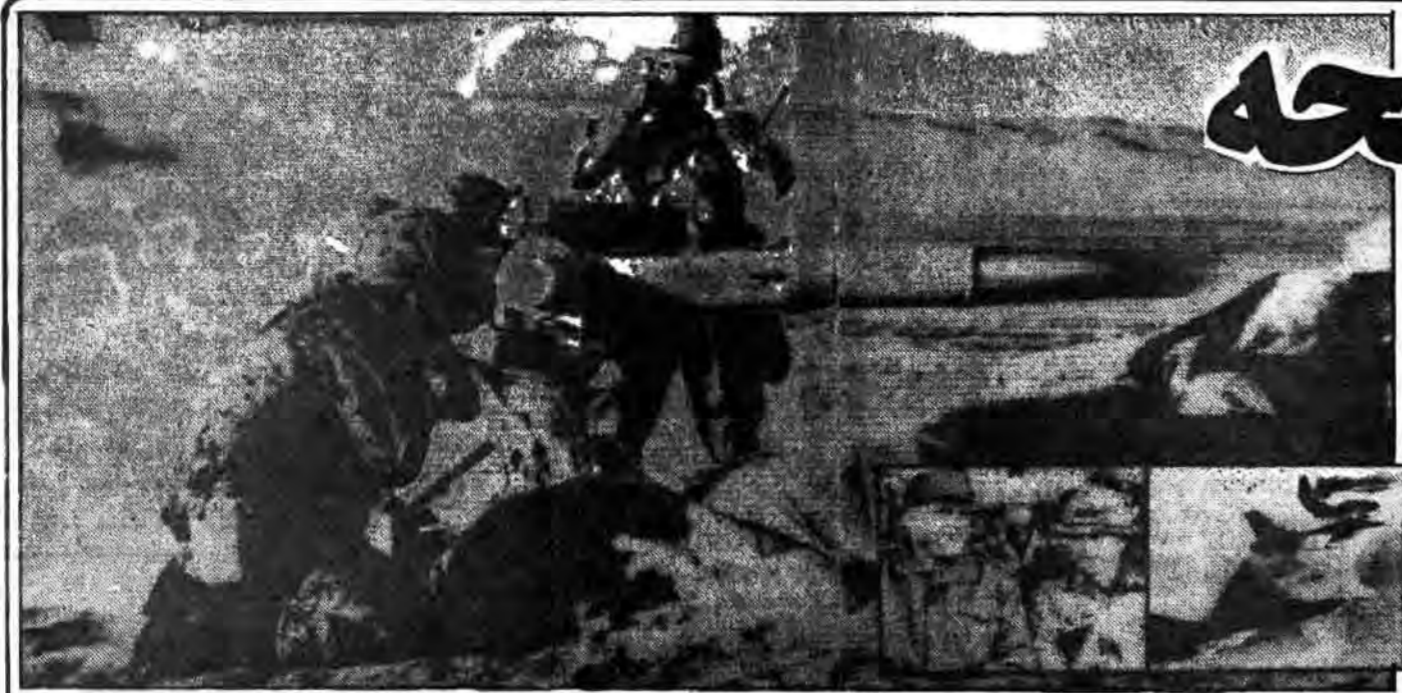
صحنه‌ای از مانورهای مشترک آمریکایی‌ها و مصری‌ها؛ خطر دوستان صحرایی امپریالیسم در منطقه مسلمانان کمزرا حطرحود شیطان بزرگ نیست

توجه به این حدیث و مدارک دیگر، ما ممکن است سؤال کنیم که آیا آنها اکنون آماده می‌شوند تا به «بومی‌های» یهودی از کشورهای درباری کاتیب که در آنها از سلاح‌های روسی استفاده می‌شود، آموزش دهند؟ در حقیقت، آنچه مسلم است، آن است که نیروهای ویژه منطقه آماده می‌شوند، افرن بر آنست که در شارهٔ ۴۸۱ «مجلهٔ سربازان»، ارگان رسمی ارتش است. ایالات متحده منتشر شد در این منطقه که بسیار روشن کننده است، گفته شده است که چگونه پیچ دست از گروه سازدهم نیروهای ویژه مسلح به تفنگ‌های «اس-۱» و مسلسل‌های «اس-۱» می‌شود، یاد بگیرند، اما تمرین‌های ضد شورش در جزیرهٔ «بورتو ریکو» شریک شرکت کردند، با