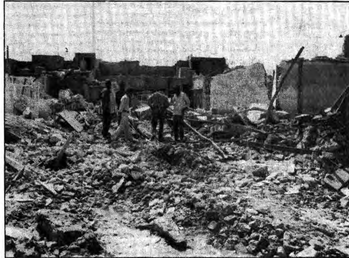
برخشت خشت این ویرانه‌ها خون شهیدان این سرزمین نقش بسته و از هر نقشی، شهیدی دیگر بر هستی یزیدیان خروج خواهد کرد

خبرنگاران خارجی شاهد عمل وحشیانه خلبانان مزدور صدامی بودند