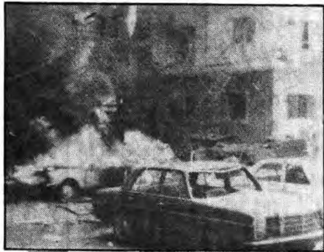
در حالی که بمبهای آمریکایی اسرائیلی این گونه صحنهها را در لبنان ایجاد میکنند، مزدوران حاکم منطقه هر چه تنگتر در اغوش امپریالیسم قرار میگیرند

سرانجام قتل وی شد. ترکیه یک هیات تجارتهی اسرائیلی در ترکیه و شناسایی «درفساکتوری» اسرائیلی را همچنان حفظ کرده است. آمریکا ممکن است از زوالها بخواهد تا آنها کار افزونتری را در این مورد انجام بدهند. حتی نیجریه که بیشتر جمعیت آن مسلمان است، نشان داده است که مایل است فلسطین اشغال شده را به رسمیت بشناسد. نیجریه به این ترتیب میگوید حسن نیت نشان میدهد.