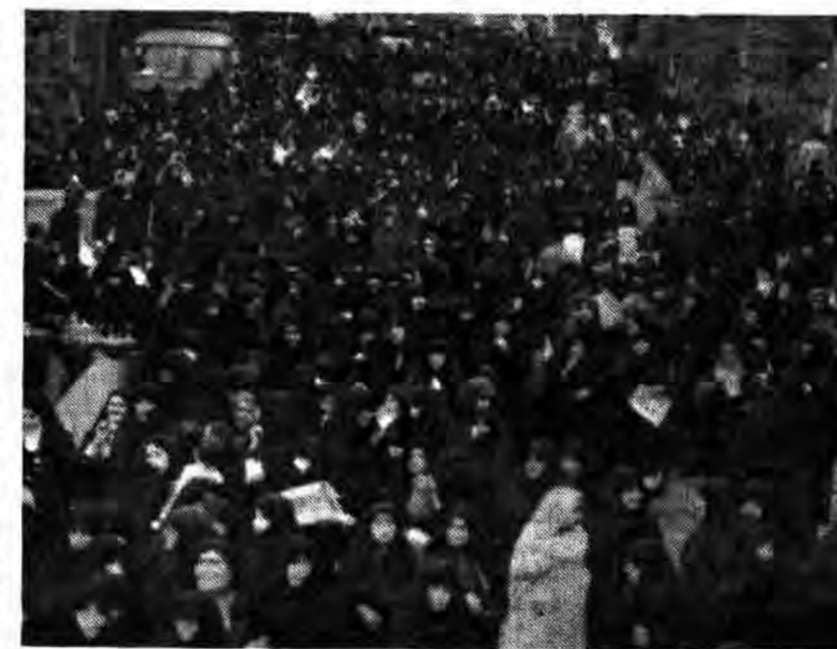
مراسم گرامی داشت روزه‌ن باشکوه تمام برگزار شد. در تصویر، شرکت‌کنندگان در مراسم دیده می‌شوند.