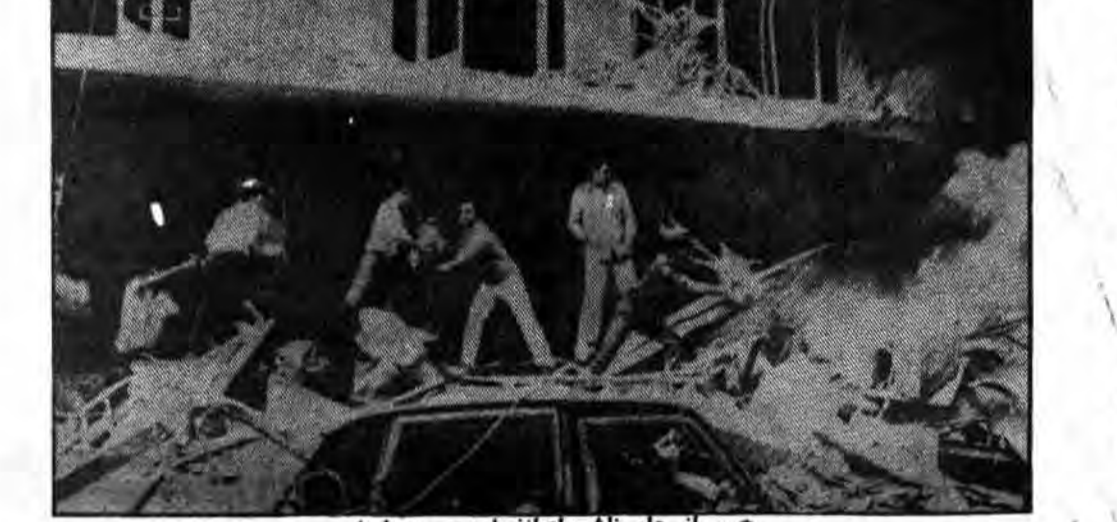
ویرانی‌های ناشی از انفجار بمب در لبنان

صهیونیستی معنی پیاده شدن نقشه‌های صهیونیسم است و نقشه صهیونیسم اینست که مردم محروم جنوب لبنان از خانه و کاشانه خود سیرون سربود و سر برهای خود را بکشد تا کشته