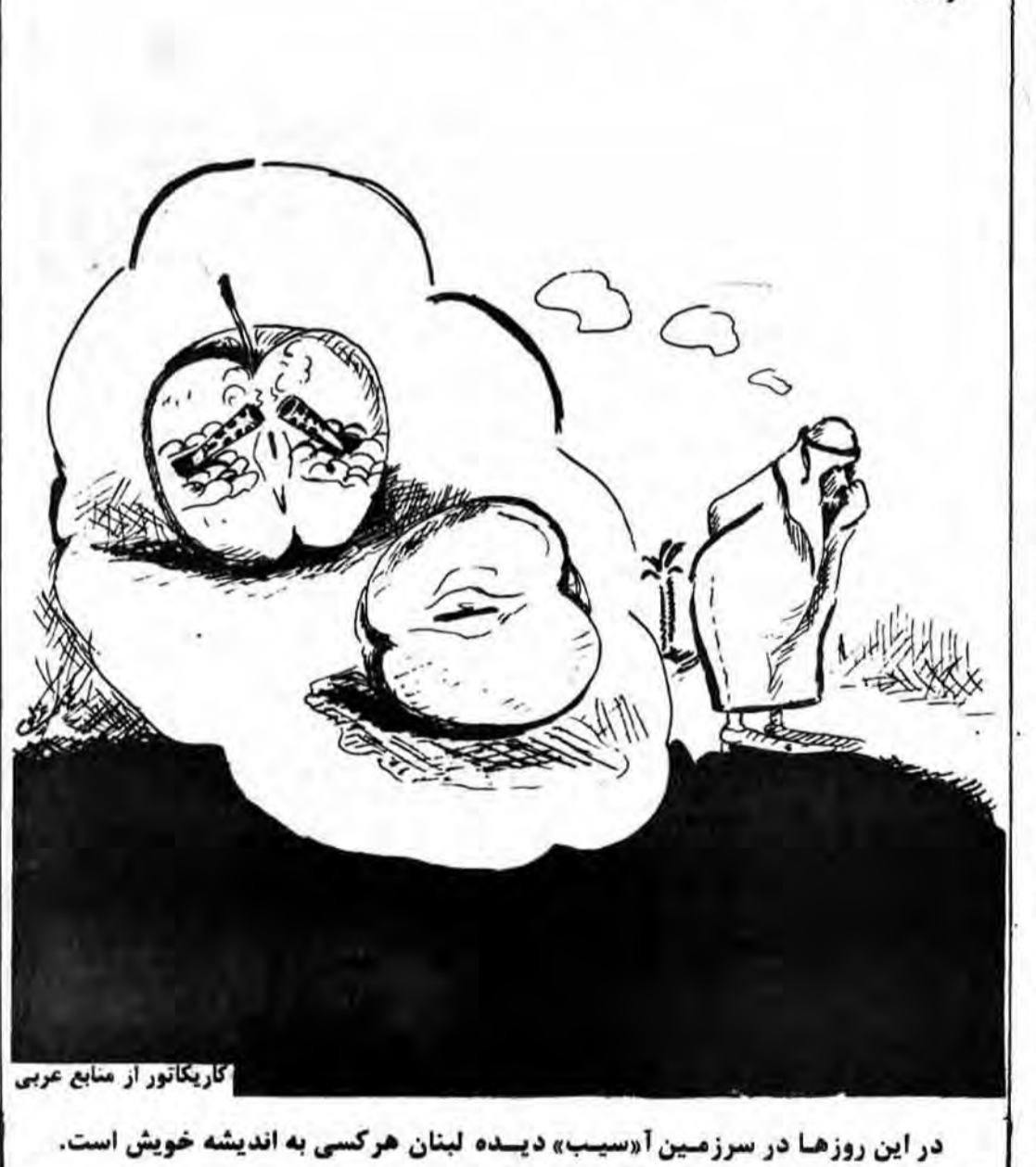
کار یکتا تور از منابع عربی

برخی از دولت‌های عربی واردات سیب لبنان را متوقف کردند