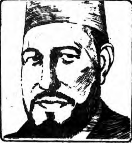
حسن البنا بنیانگذار جنبش اخوان المسلمین در مصر نکته برداشت:

۱- پیوند فرهنگی مسلمانان آگاه جهان با جریانی اسلامی با نام «اخوان المسلمین» ۲- دوتوطئه نفوذی و خشونت نظامی (سرکوبی) علیه جریانی بنام «اخوان المسلمین» از جانب استعمار. در مورد اول باید این حقیقت را اذعان داشت، که مگر می‌توان جریانی با نام اخوان المسلمین که شخصیت‌هایی مانند حسن البناء، سید قطب و جوانان پرشوری مانند الجهاد... غیره داشته است، را تکذیب کرد!