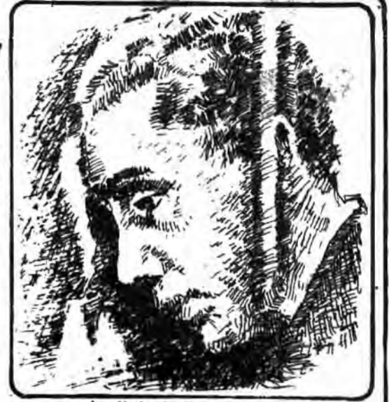
سید قطب یکی از رهبران اخوان المسلمین (بسم الله الرحمن الرحيم)