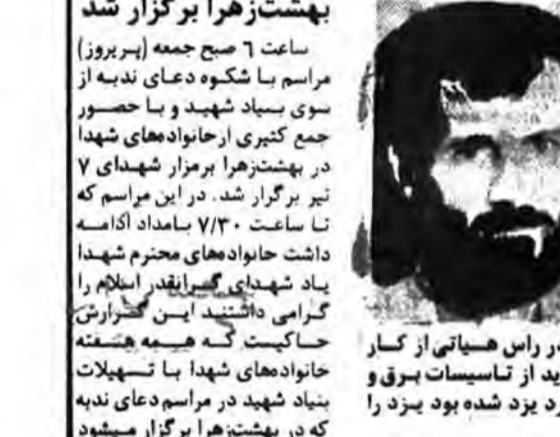
وزیر نیرو اعلام کرد: کامبود برق استان یزد بزرودی بر طرف گشایش یافت

دعای کمیل در شهرهای استالیا برگزار شد دعای کمیل در شهرهای استالیا برگزار شد