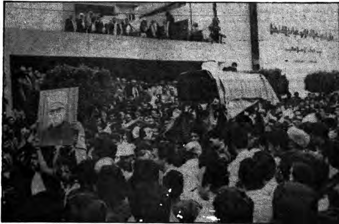
بیروت- عکس رادیویی از تشییع جنازه شیخ احمد عصفار رهبر معروف مسلمانان (سنی) لبنان که روز سهشنبه در قسمت غربی لبنان ترور شد. هم مسلمانان و هم مسیحیان امروز را تعطیل کرده و در تشییع جنازه وی شرکت کردند.

واحد مرکزی خبر استقلال از خبرگزاری گزارش داد مسلمانان و مسیحیان بیروت و سایر شهرهای لبنان بعنوان اعتراض علیه قتل شیخ احمد عصفار روحانی برجسته مسلمان دست به اعتصاب عمومی ۲۴ ساعته زدند. شیخ احمد عصفار از روحانیون مسلمان مخالف گروههای مارکسیستی روز دوشنبه در محوطه خارج از مسجد در غرب مسلمان نشین بیروت بقتل رسید. پلیس لبنان اعلام داشت که درباره این قتل سرگرم تحقیق هستند. رهبران جامعه اسلامی این