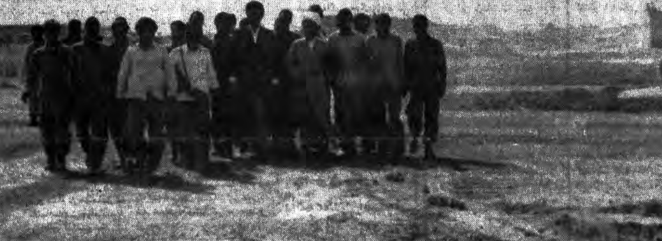
آیت‌الله مشکینی از اراضی آزاد شده در عملیات بیت‌المقدس دیدار کردند

ارتش اسلام در ۳ کیلومتری خرمشهر مستقر شد