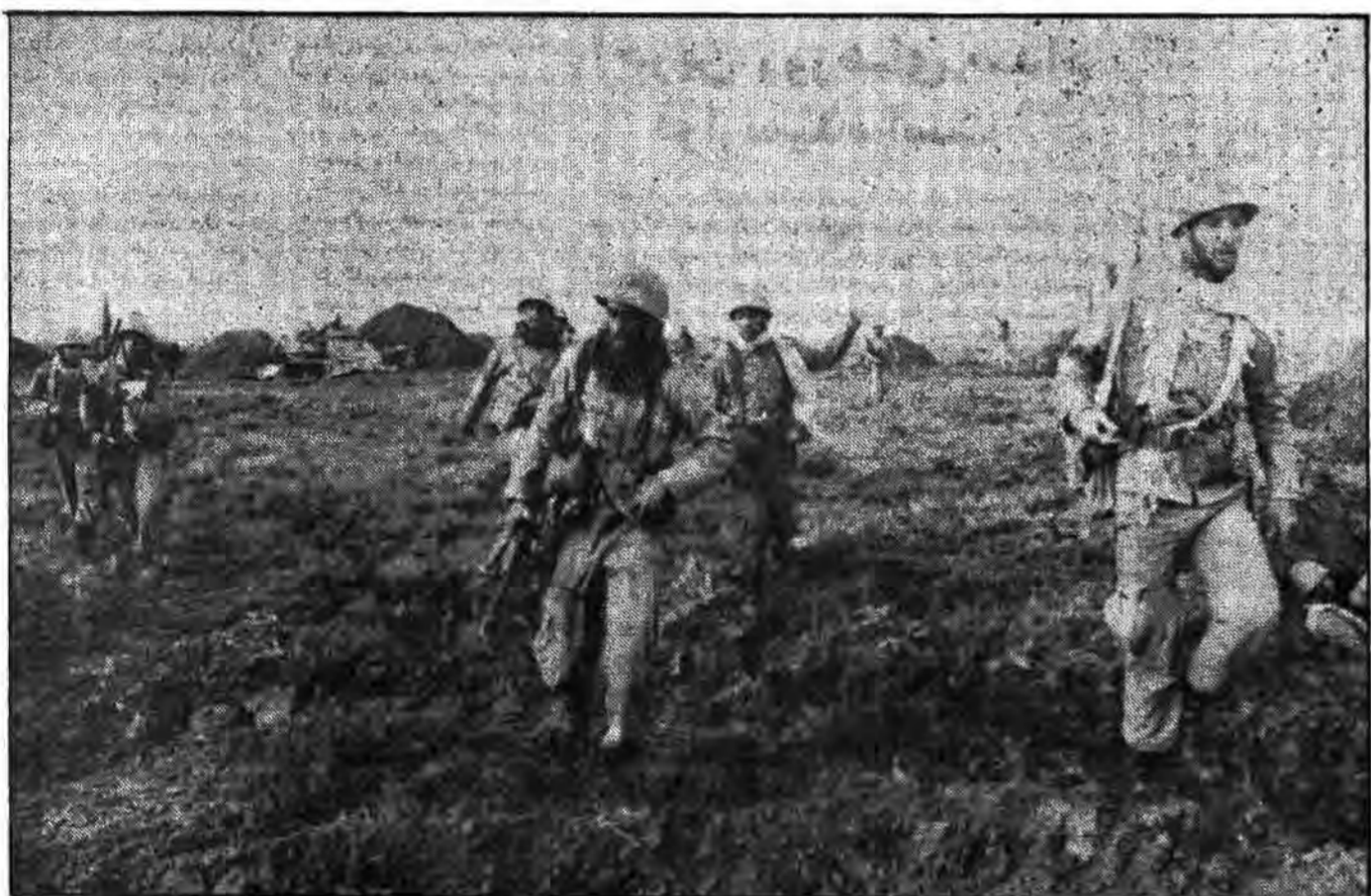
«یا علی ابن ابی طالب» رزمستان پیروز و رمزتان - حافظ جانتان