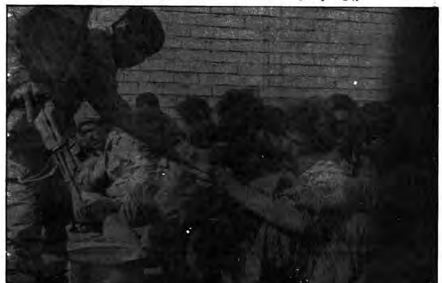
عکس رادیوفوتوئی از اسرای عراقی در عملیات بیت المقدس