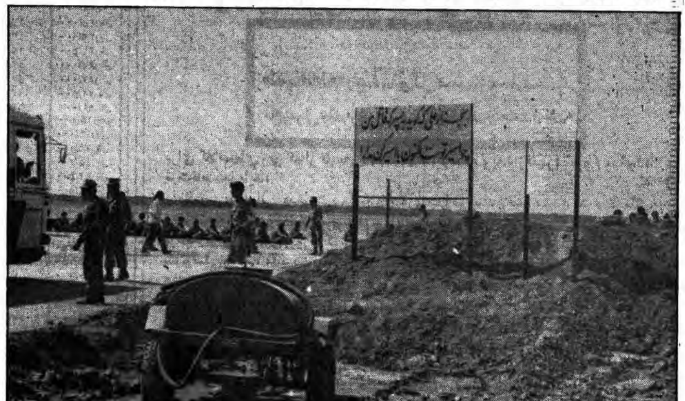
سپاهیان اسلام با اسرا علی‌وار رفتار می‌کنند و در جنگ از او الهام می‌گیرند، با قدرت و حسی او به نبرد می‌روند، مسامحه ندارند و با اسرا نیز با اخلاق و رفتاری عملی گونه برخورد می‌کنند.