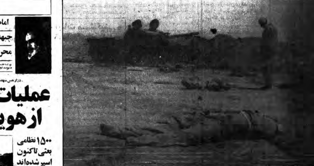
از ابتدای جنگ گفته بودیم خوزستان را گورستان خواهیم کرد

الیس الصبح بقریب امام: تمامی افراد جبهه‌ها همین مردم محروم و زاعه نشین هستند