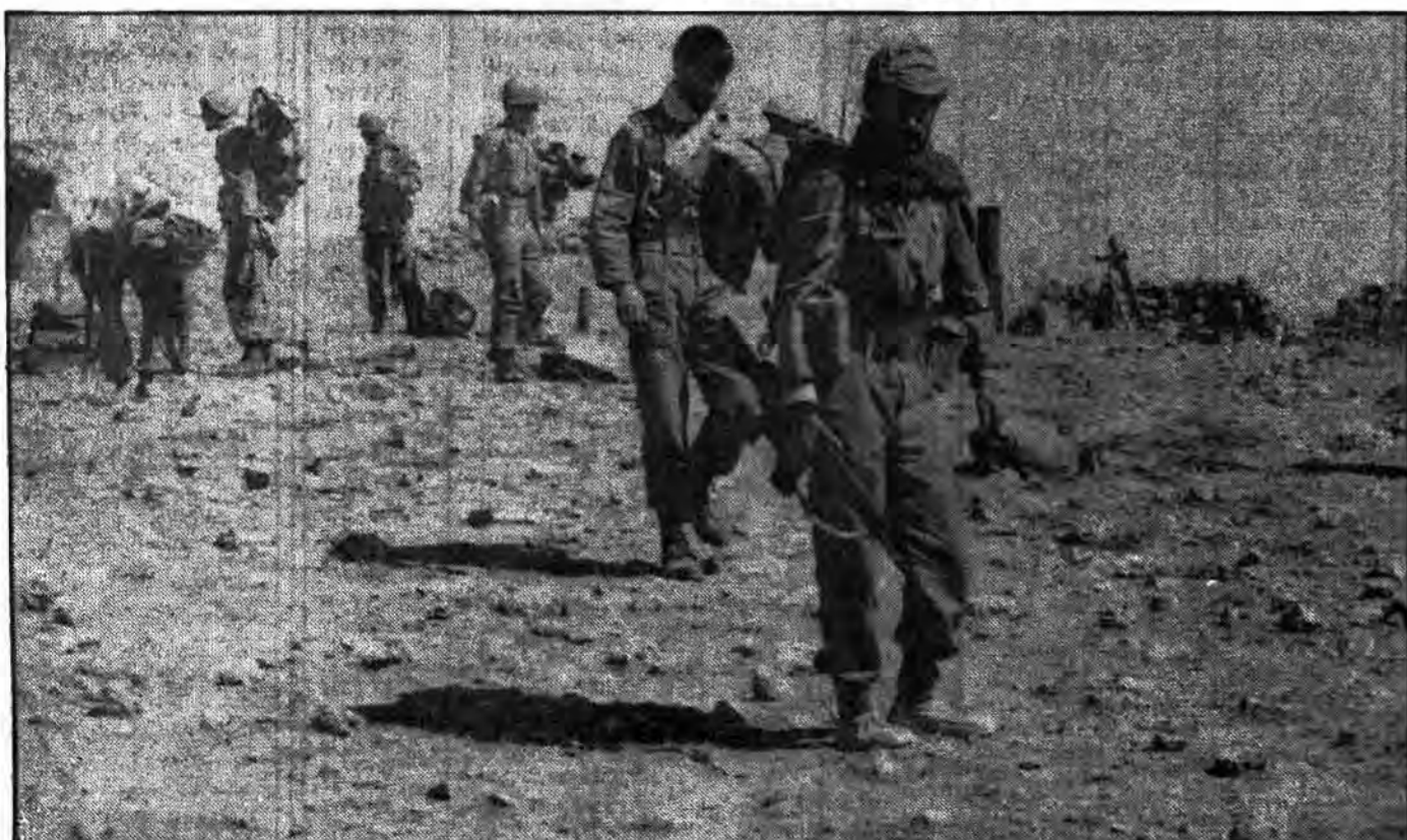
استراحتی کوتاه، و بعد حرکتی به وسعت استواری گامهایشان در امتداد نابودی کفر صدامی.