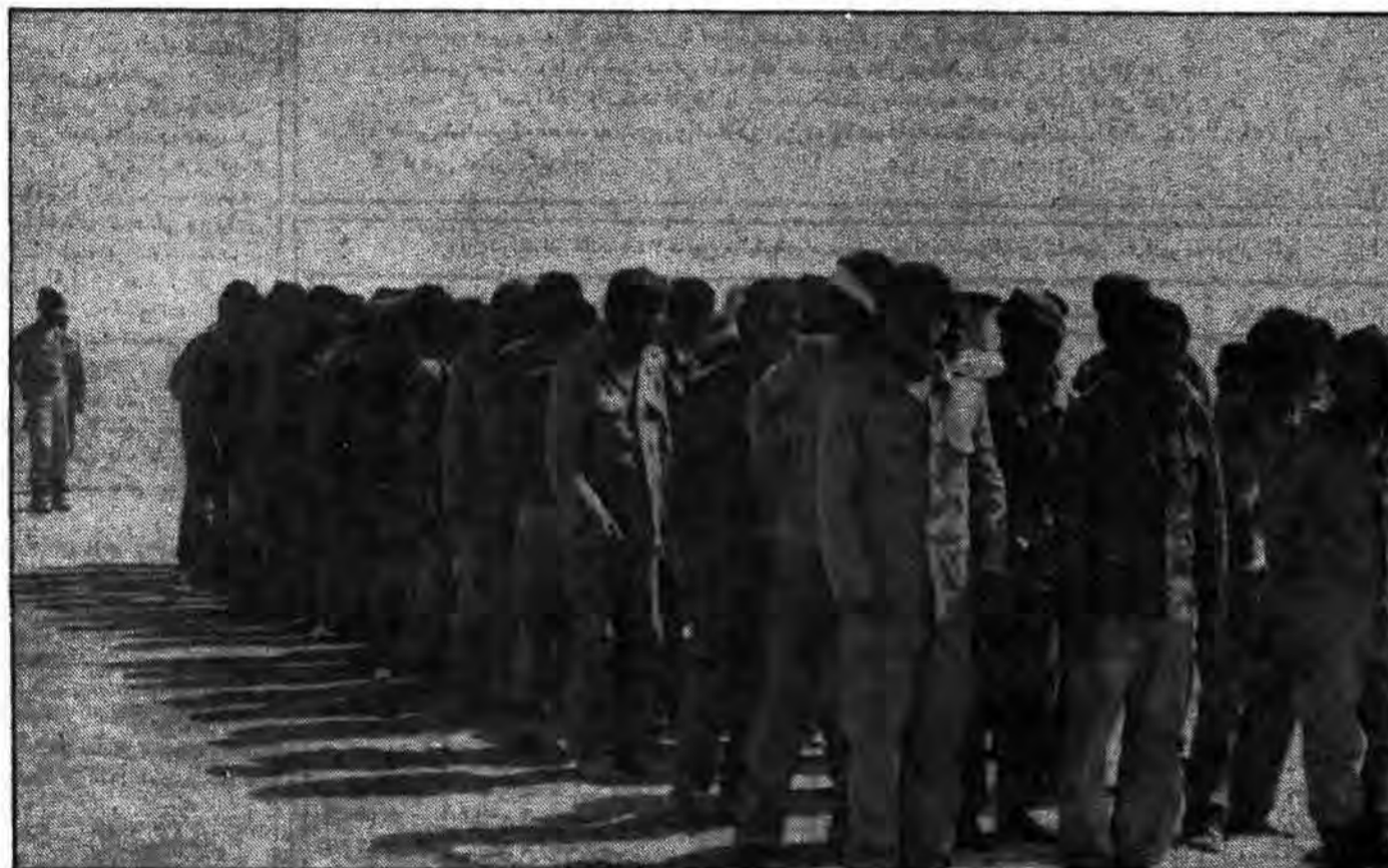
گروهی از اسرای عراقی به پشت جبهه تخلیه می‌شوند