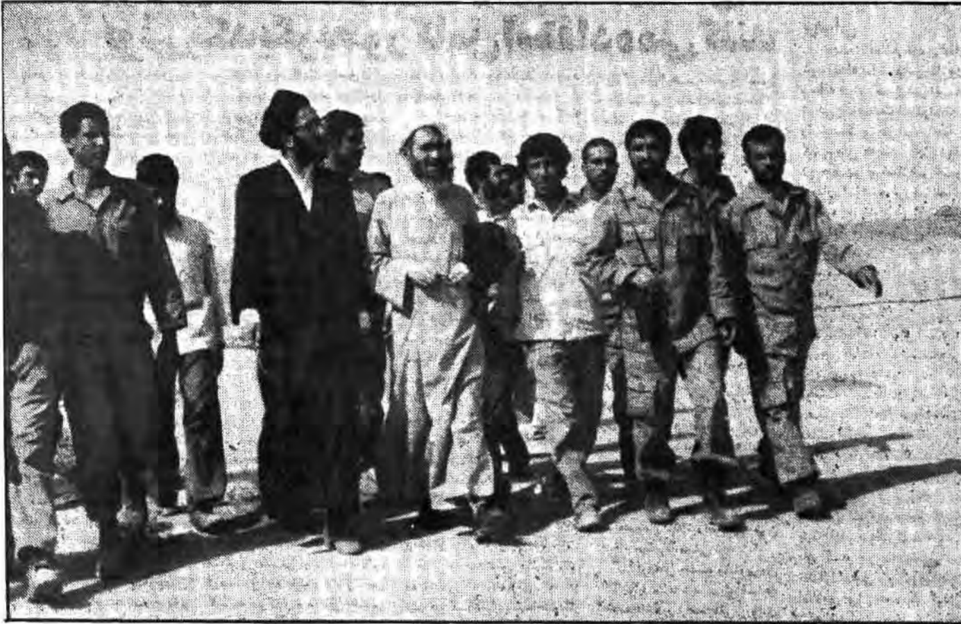
آیت الله مشکینی در جبهه‌ها حضور دارند و رزمندگان را روح و روانی تازه می‌بخشند.