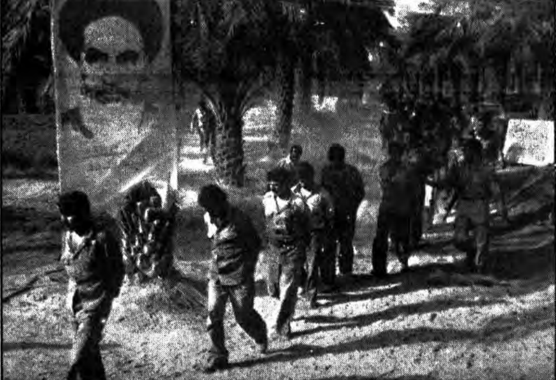
بدنبال تهاجم گسترده ارتش اسلام به قوای کفر صدام در شمال خرمشهر نظامیان بعثی عراق گروه گروه تسلیم میشوند در تصویر بالا گروهی از مزدوران بعثی که در روز در شمال خرمشهر با اسارت نیروهای اسلام درآمداند به پشت جبهه منتقل میشوند.

۸۸ تانک و نفربر دشمن سالم به غنیمت گرفته شد