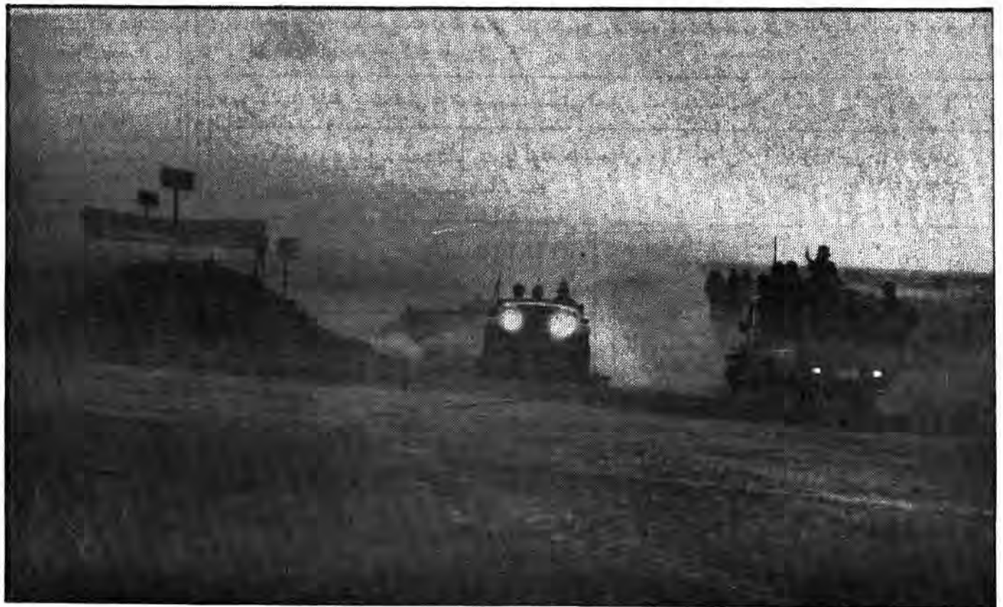
سحر خیزان لشکر اسلام به ندای مرغ حق لبیک گفته و در سبیده سحر عملیات خویش را شروع می نمایند