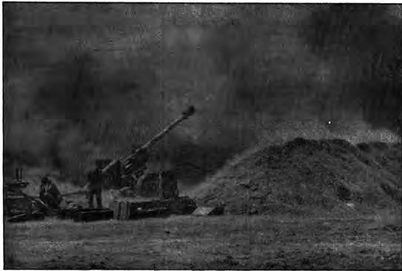
توپخانه رزمندگان جان بر کف اسلام در جنگ تحمیلی نقش بسزایی داشته است و اینک در عملیات الی طریق القدس، توپخانه رزمندگان با آتش شدید خود پیروزیهای چشمگیری را به ارمغان می آورد.