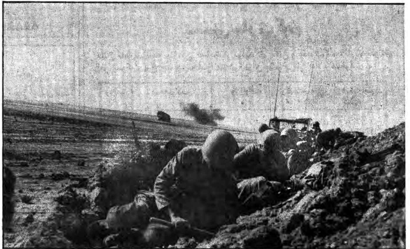
خاکریزهای دشمن یکی پس از دیگری بدست سپاهیان اسلام درهم کوبیده میشود و رزمندگان ما در موضع جدیدی قرار می گیرند.