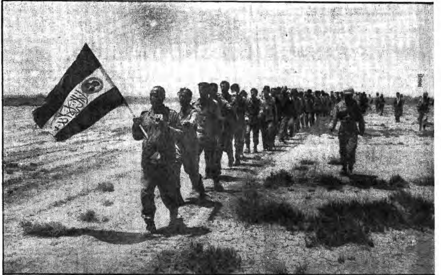
آداء جاه نصرالله والفتح و رایت الناس بد خلون فی دین الله افواج، اسرای عراقی خوشحال از پیوستن به صفوف رزمندگان اسلام و با در دست گرفتن پرچم لااله الاالله و عکس رهبر انقلاب اسلامی امام خمینی آرزوهای صدام آمریکائی را بگور می سپارند.