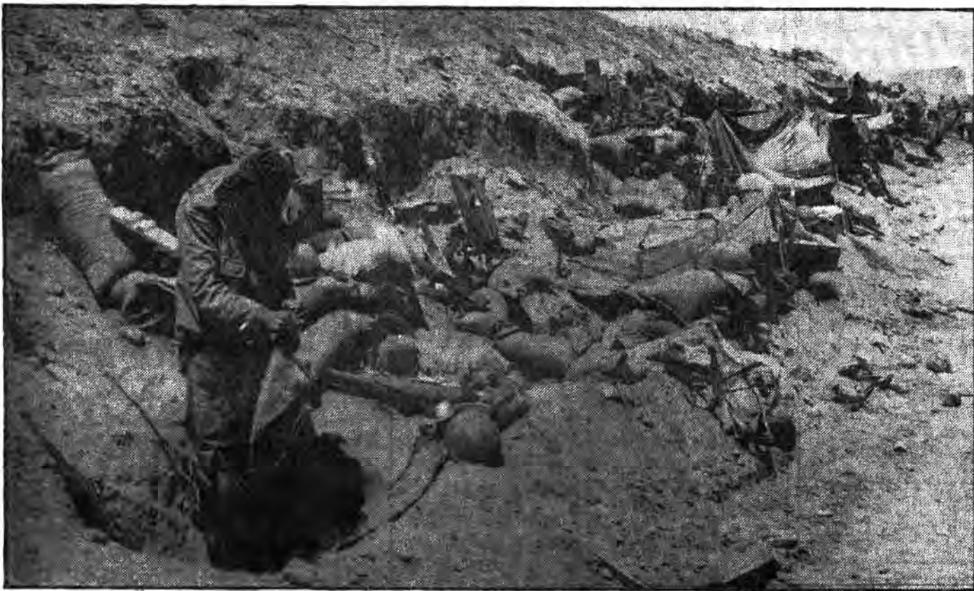
بعد از طی مسالمتی و فتح خاکریزهای دشمن رزمندگان اسلام در محلی جدید استقرار می یابند تا عملیات بعدی را بسرجه اجرا در آورند.