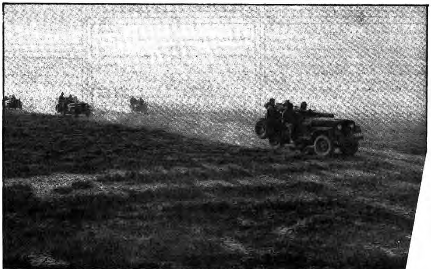
حله نه گفتار، نساہ باسداران با عزم راسخ و قلبی سرشار از ایمان به الله، با تفنگ ۱۰۶ به شکار تانکهای مستجاوزین می شتابند.