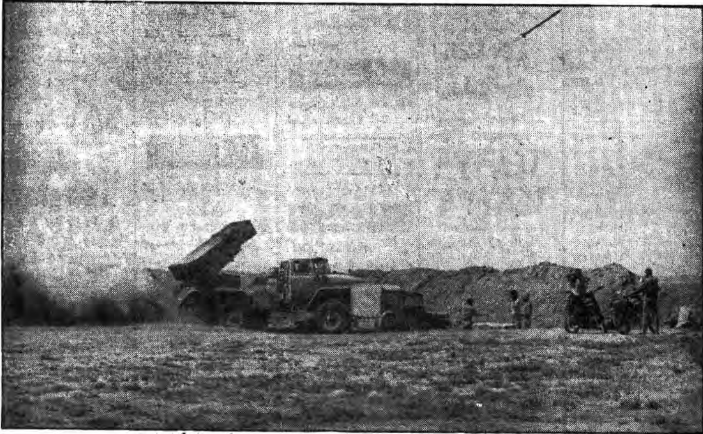
آتش بی امان کاتبشاهای رزمندگان اسلام قدرت هرگونه تفکر را از فریب خوردگان صدام گرفته است.