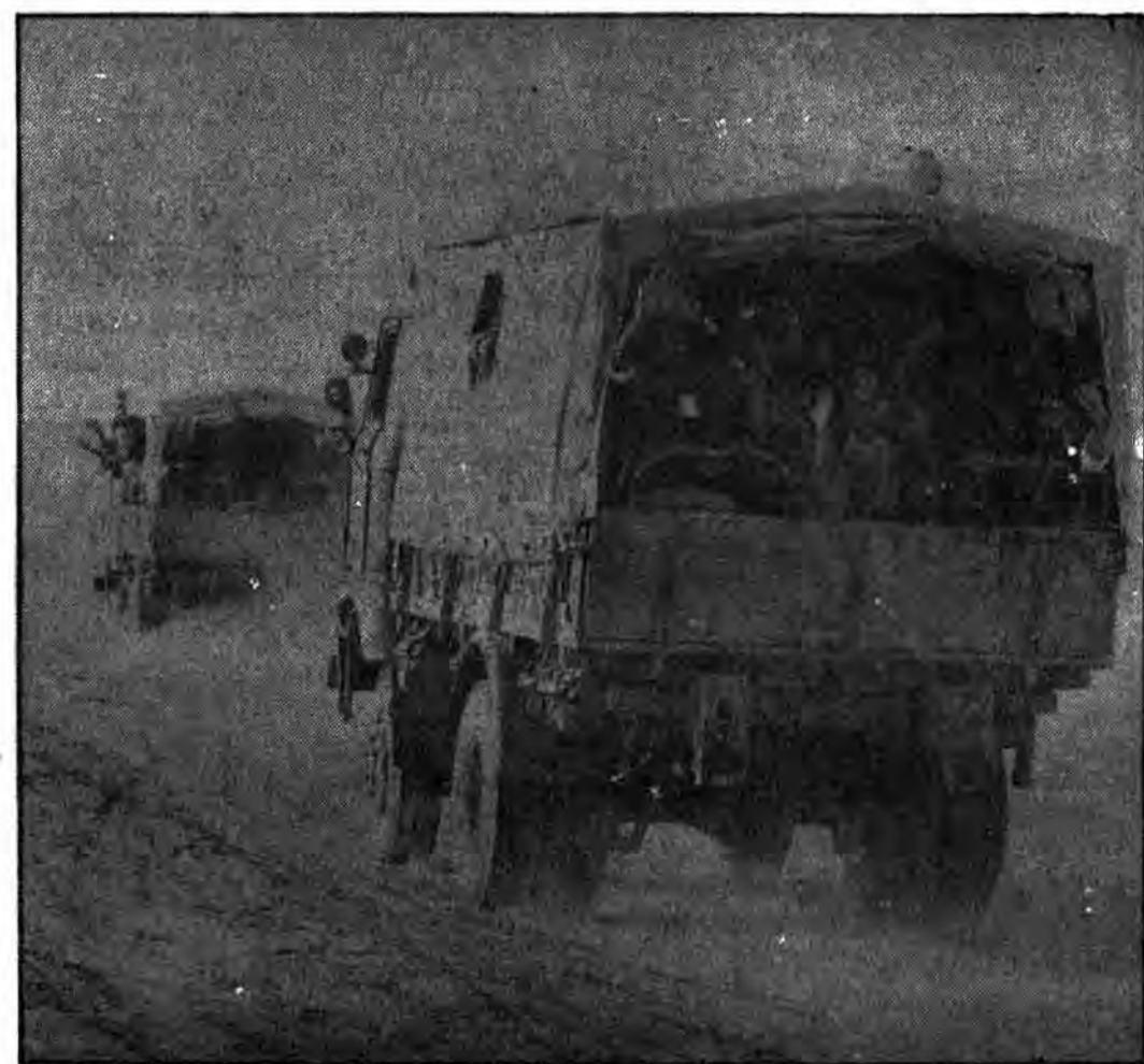
● مزدوران، این مدافعان کفر، اینگونه در ستیز یاسق به ذلت رسیدند