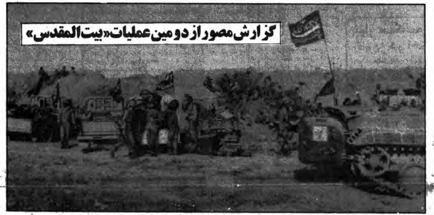
گزارش مصور از دومین عملیات «بیت المقدس» مازنده برآنیم که آرام بگیریم موجب که آسودگی ماعدم ماست نیروهای اسلام دیروز در نوار مرزی شمال غربی خرمشهر مستقر شدند و پرچم اسلام را باهتزاز در آوردند و در آن نوار مرزی توسط خبرنگار اعزامی جمهوری اسلامی به جبهه های جنگ حق علیه باطل ارسال شده استقرار جنبدالله و باهتزاز در آمدن پرچم اسلام در نوار مرزی رانشان میدهد

۳۵۰ کیلومتر مربع از اراضی شمال خونین شهر آزاد شد