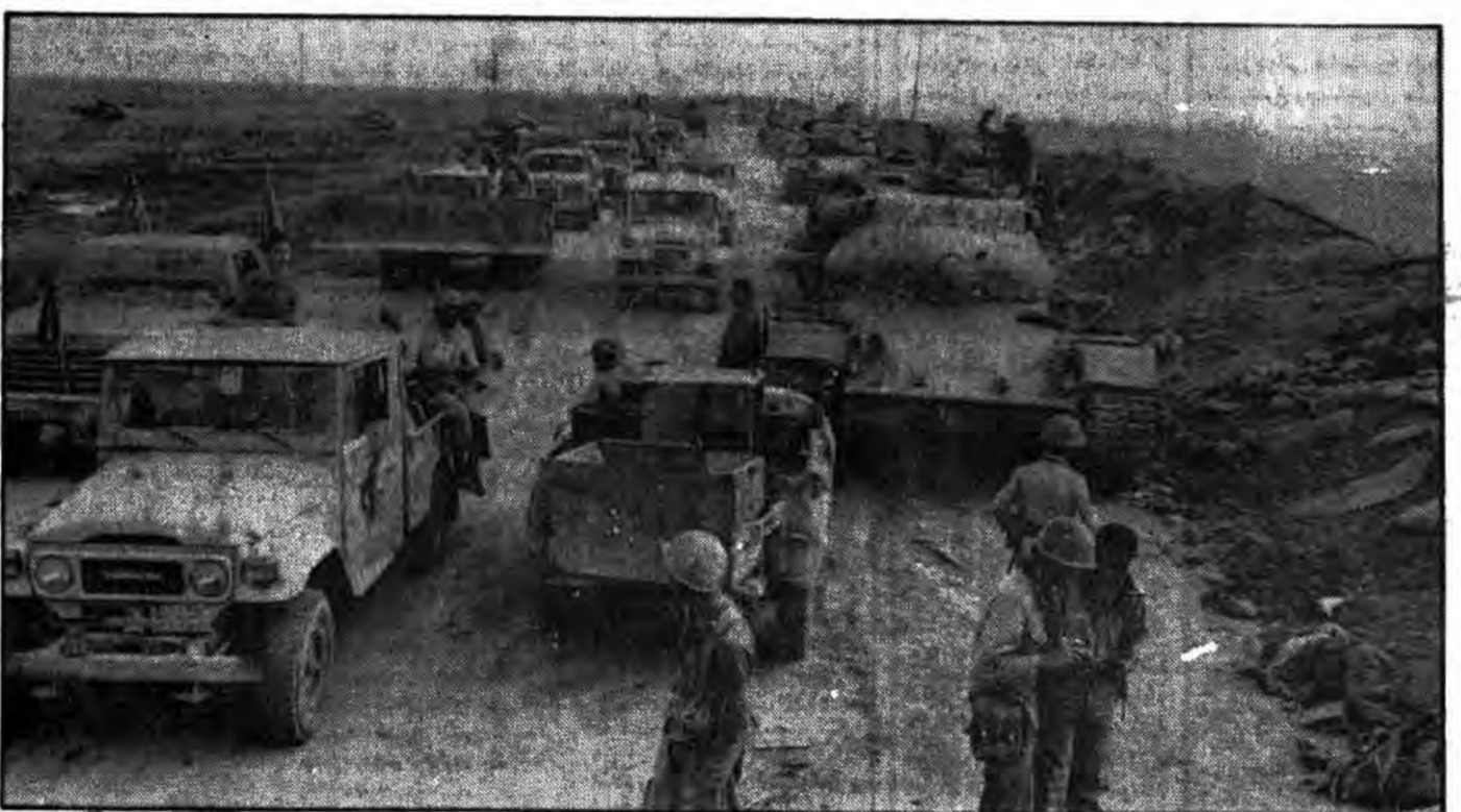
اینگذ درهای بهشت به سوی شهر حماسه و مقاومت، شهر خون و شهادت گشوده شده است به پیش بشتابید! اسفالت‌های بخون آغشته خیابانها، دیوارهای خونریز، سنگ‌شهای خونین کوجهها، از همه مهم تر شهدای این زندگان جاوید شما را به خونین شهر خوانده‌اند. به پیش بشتابید! خدای قوتان یغشدا!

آسوشیتد پرس اعتراف کرد: جنگ به نقطه بسیار حساسی رسیده است صفحه ۲