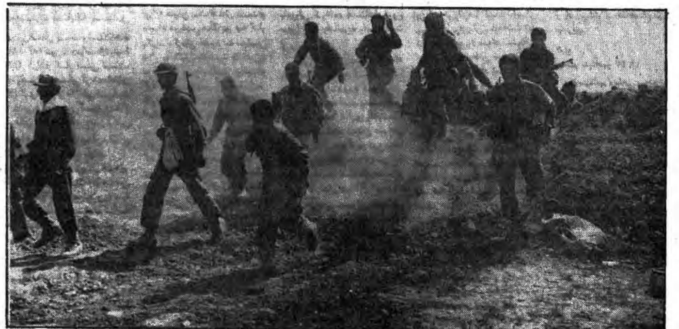
رزمندگان اسلام با عزمی استوار و اراده ای پولادین با فریاد الله اکبر خاکریزهای دشمن کافر را یکی پس از دیگری پشت سر می گذارند و می روند تا آخرین سنگرهای کافران را مسخر خود سازند.