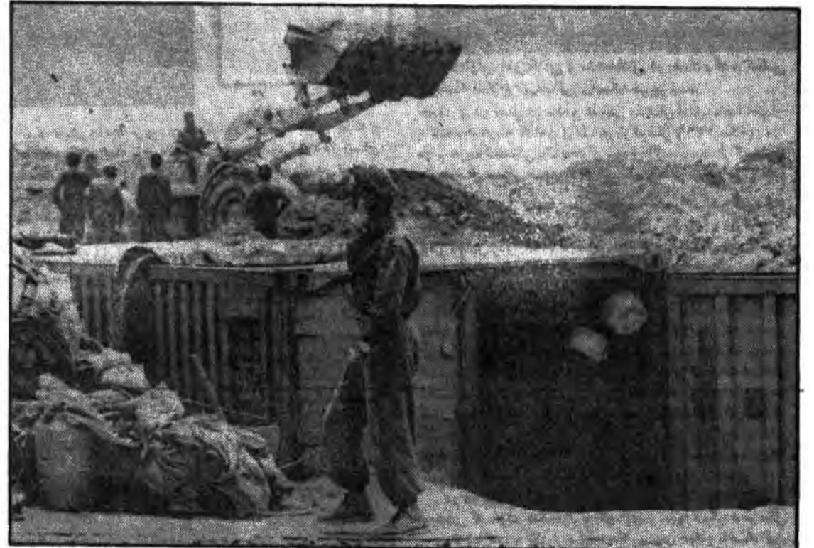
گویا حبیب این مظاهر است که با قامتی چون سرو گامهایش را محکم بر زمین کوبیده است تا خصم زبون را راهی گورستان فنا کند.

ای خفته دروصال یم خون ای وادی غریب ای در وطن غریب در غربت وطن چه صبورانه خفته ای توشهر پر غرور و تحمل تو ادرخش صلابت ای قصه همیشه جاری اعصار شمشیر بر کشیده قهار از شکوه سستی که بر تو روآشد هرگز چرا غم خود را نگفته ای ای قامت رفیع شهادت ای سرزمین پاک نجابت تو در اسارت زنجیر دشمنی لغتی صبور باش زنجیر هاگسل که تو امروز با منی ما شاهدان خاک پر از لاله توایم ای مهد عزت و شرف و مهر و معرفت ما عاشق توایم..... ما و اله توایم..... یاران بی ستوه نبی یاور تو اند ششصد شبانه روز همه در باور تو اند خرمشهر..... ای شهر سرفراز ایام ذلت و اشغال بخت رفت دوران بردگی و اسارت بسر رسید ای قهرمان شرق - من نام کوچهای تو بخاطر سپردم دشمن خیر نداشت که در لفظهای جنگ صدها هزار بار - برای تو مردام برخیز - شب گذشت فجر امید بر پرچم اسلام بوسه زد قدرت کن که فاتحان از دروازه های سلجمه با قدرت تمام سوی تو آمدند بهاپوس آمدند تا با گلاب ناب - تنت شستشو دهند. تا قصه اسارت ترا از ماهیان آزاده کارون بشنوند و قصه قطره های خروشان خون پاک شهیدان را خون مطهر حسین و محمد را برخیز - آفرین مردان پرتوان و فاتح اسلام آمدند.