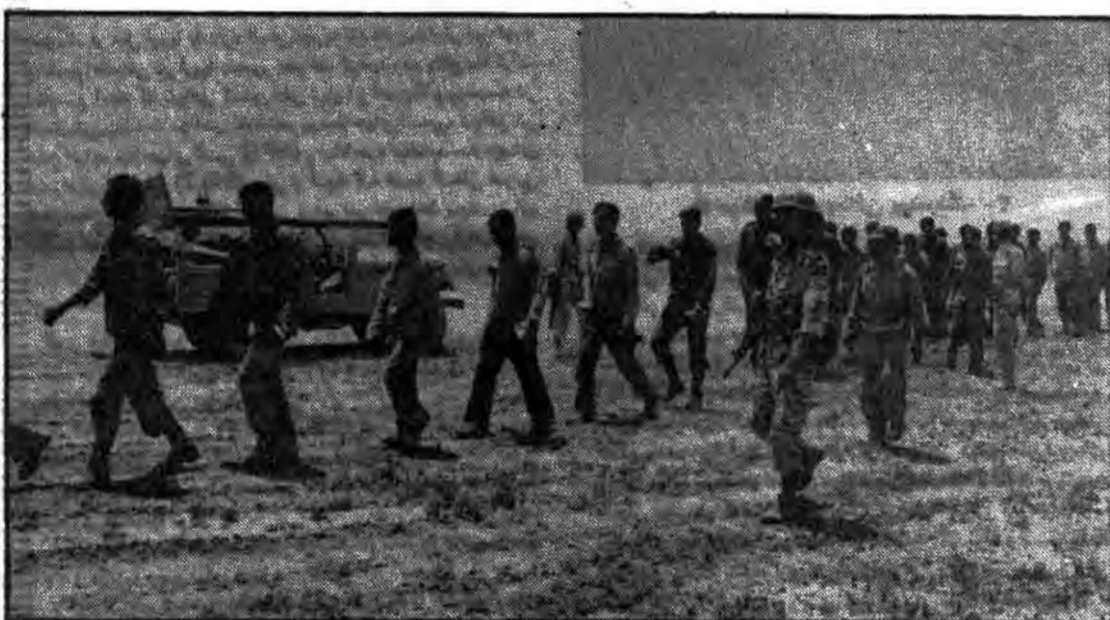
پاسداران حق، با عطفوت اسلامی در حال انتقال اسرای فریب خورده عراقی هستند.