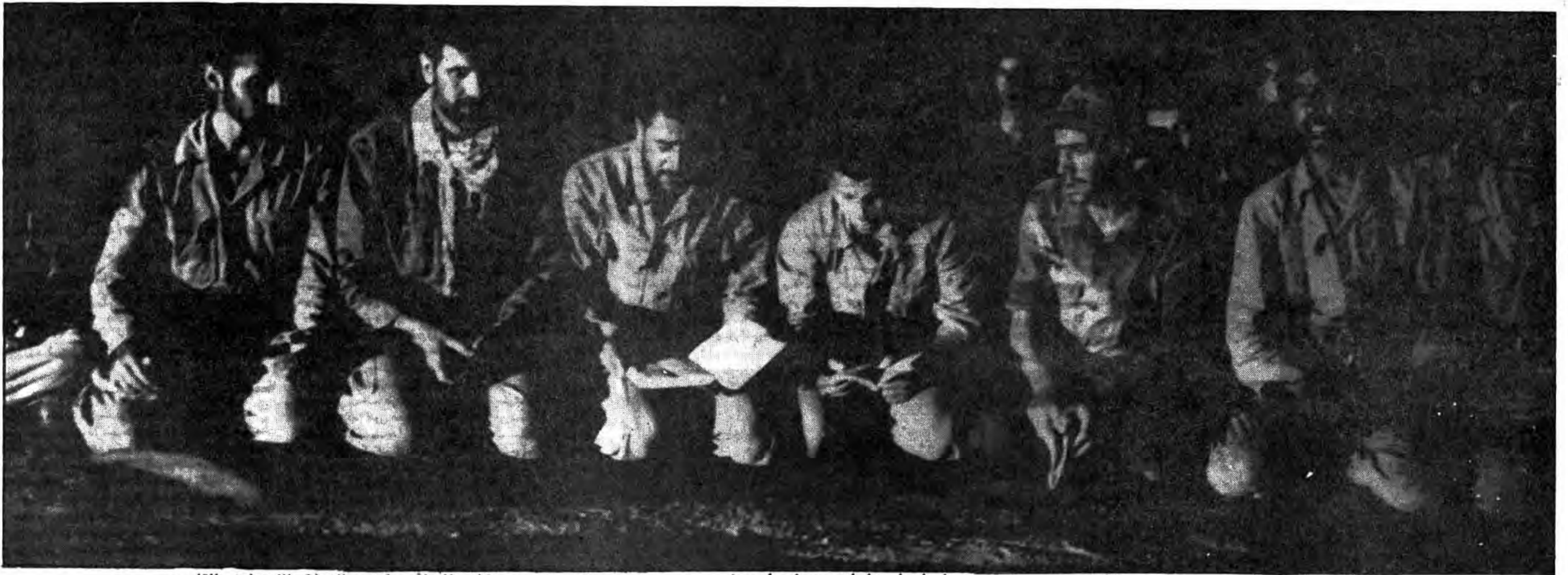
رزمندگان اسلام در ظلمت شب با قلبی سرشار از عشق به الله، همراه با دعا و مناجات و درخواست نصر و پیروزی، مستمسانه معبودشان را فریاد می کنند - الا بذکر الله تطمئن القلوب