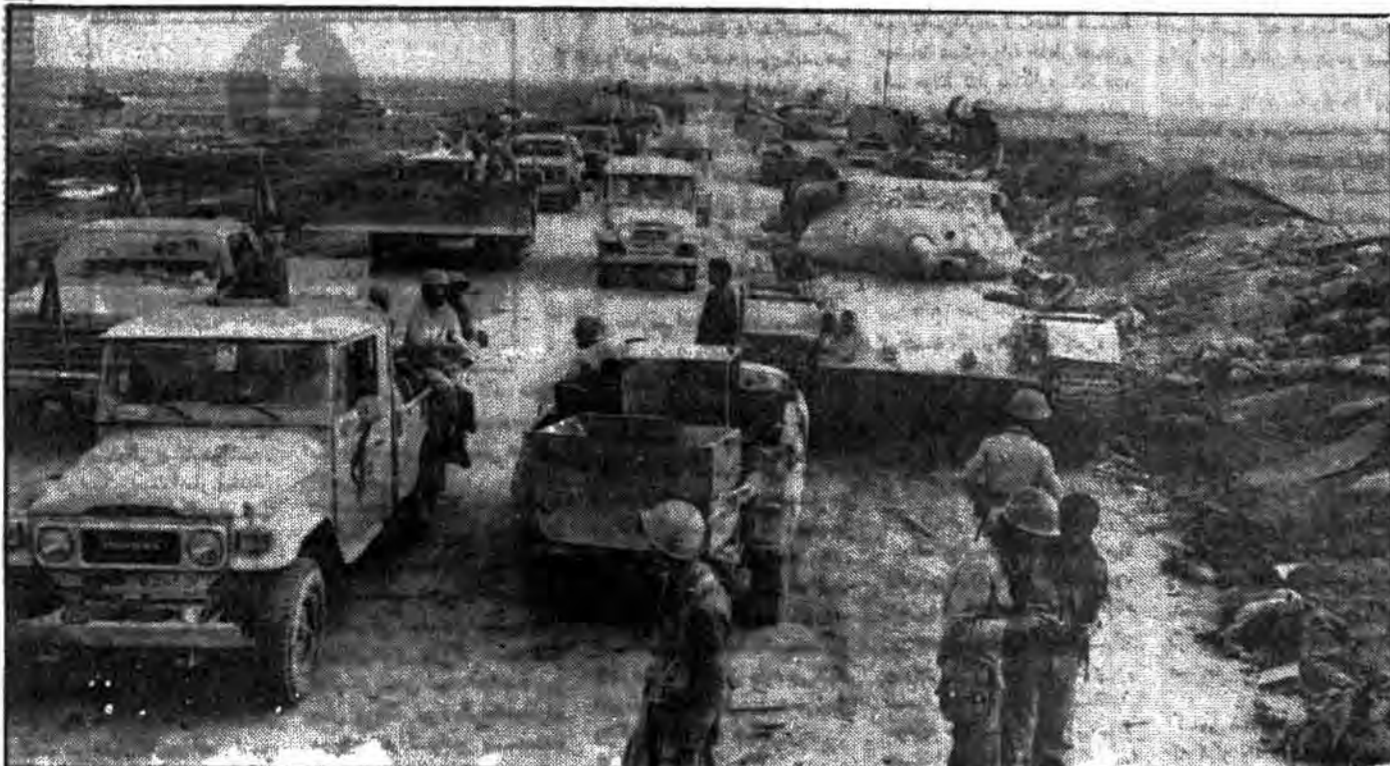
اینکا درهای بهشت به سوی شهر حماسه و مقاومت، شهر خون و شهادت گشوده شده است به پیش بشتابید! اسفالتهای بخون آغشته خیابانها، دیوارهای خونریز، سنگفرشهای خونین کوهها، و از همه مهم تر شهدای این زندگان جاوید شما را به خونین شهر خوانداند. به پیش بشتابید! خدای قوتتان بخشد!