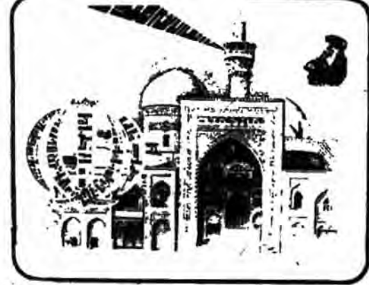
جمعه ۲۴ اردیبهشت ۱۳۶۱ - ۲۰ رجب ۱۴۰۲

● فرهنگ فاسدش را به مسلمانان تحمیل کردند.