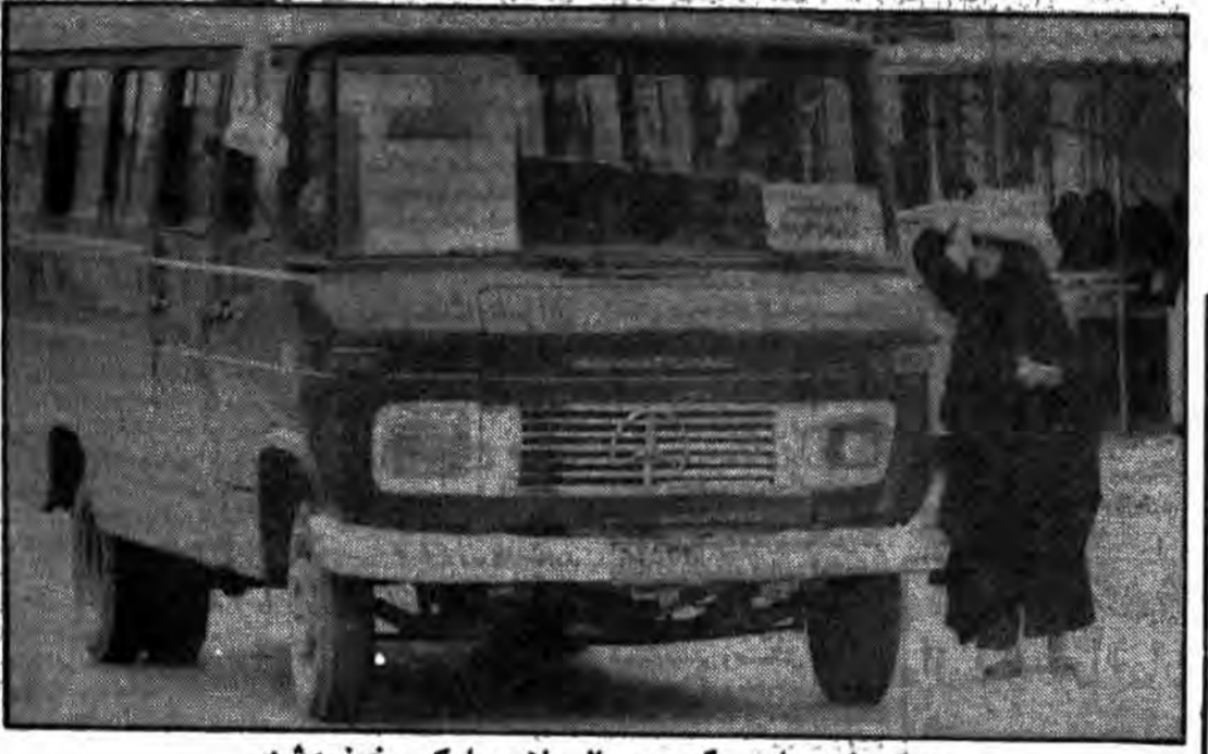
به خرمشهر باز می گردیم - السلام علیک - خونین شهر

رژیم بعثی خانواده های اسرای عراقی را از آن کشور اخراج می کند