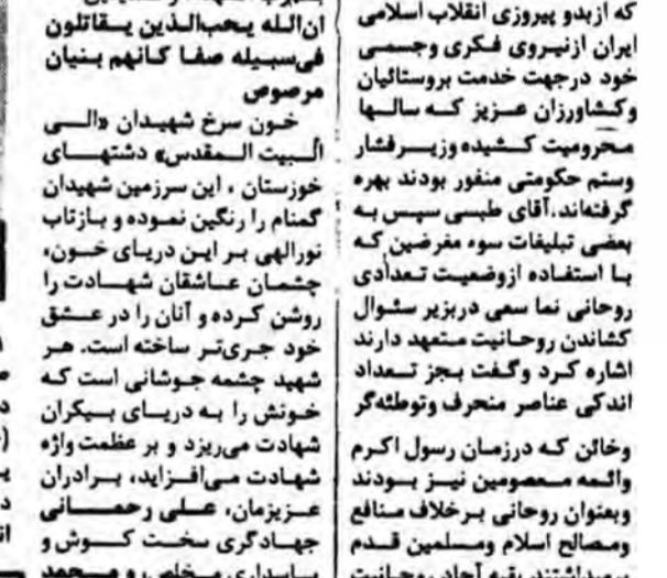
بسم رب الشهداء والصدیقین