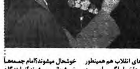
خوشحال می‌شوند تا ما را می‌بینند

شکل آزاد دادگاههای انقلاب تا چند ماهی هست از پیروزی انقلاب و شکستگند اسلامی بجز قاطع و بیطرفانه عمل می‌کنند و بیسیار هم موفق بودند.