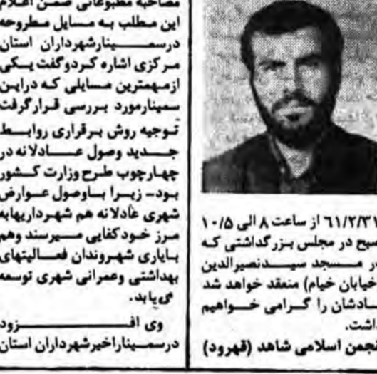
بسم رب الشهداء والصدیقین