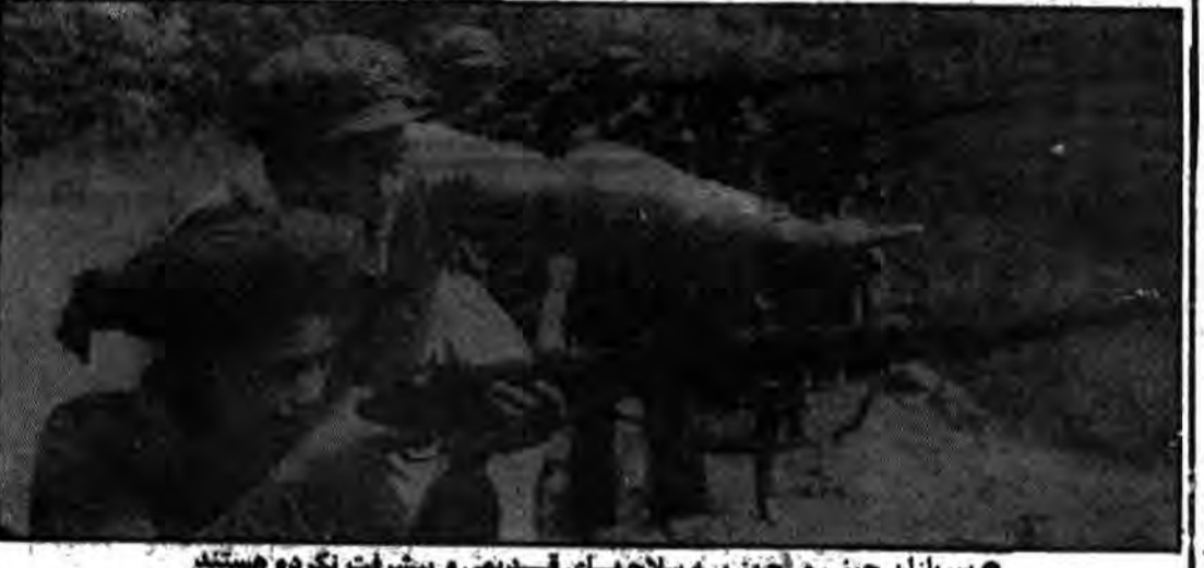
سربازان چینی مجهز به سلاحهای قدیمی و پیشرفت نکرده هستند.

هوارد ۱۲ هزار تانک چین در برابر ۶۴ و ۷۲ روسها نمیتواند از خود کاری انجام دهد. همچنین صد تانکهای قدیمی چین نیز در برابر سلاحهای پیشرفته شوروی و تانکهای آن بی نتیجه میماند. وضع این ارتش در دریا نیز زیاد نریمی ندارد زیرا ۱۳۰ کشتی وزیر درباری نیروهای ارتش چین دیگر گفته شده و در برابر کشتی وزیر درباری مدرن جدید از کار افتاده است.