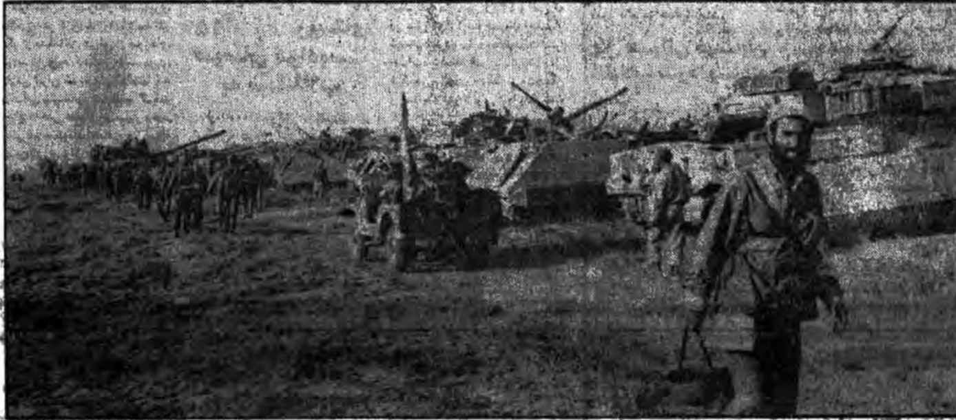
وزیران کابینه پشتیبان لشکران کفر را می شکنند و جهادگرانی بگوری چشم دشمنان شهرهای دینارشان را نورسبازان می کنند. عزیزانی غلبه های هروز را بچین می کنند و عزیزانی دیگر نهال روشنی میکارند مدافعانی زمین مقدسان را از شر غنسانان بساک می کنند و سازندگان شهر را بسرای آورد صاحبخانه آذین می بندند چنین رشادت و شهامت و ایثار کجا برای دشمنان قابل تصور است. غنسانان کجایاری دیدن این عظمت را دارند؟

وزیر کشور در هویزه: شما (سفر) رسالت سفیر بودن خود را در انتقال جنایات صدام به کشورهای خود ایفا نکنید.