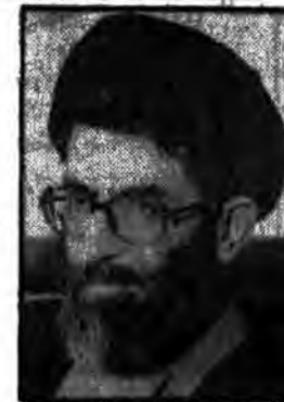
فضای سفارتخانه و کنسولگریهای جمهوری اسلامی در کشورهای خارجی باید فضای ایران باشد... ما سفیری را که دائما با وزارت امور خارجه ارتباط مستعد داشته باشد مطلوب تلقی می کنیم.

رئيس جمهور در ملاقات با کارداران و کارمندان وزارت خارجه و استاندار گیلان و خانواده شهید انصاری: