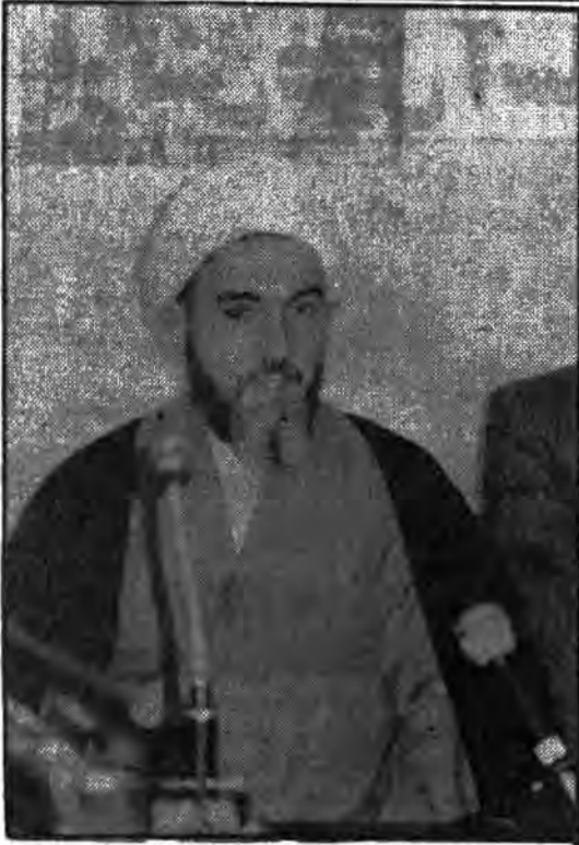
این است که قضات دادسراها که از قبیل بسازرس و دادسرا و دادستان و اینها می‌توانند از افرادی که غیر از آن شرایط که گفتیم