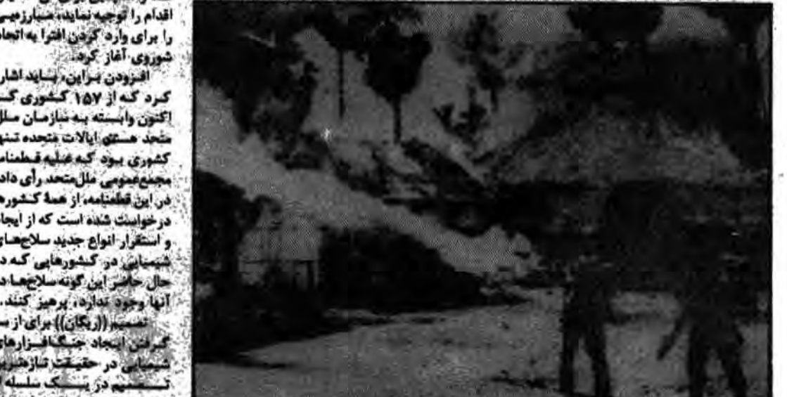
جنگ شیمیایی آمریکا علیه ویتنام آمریکا تنها کشور در جهان ۱۵۷ کشور و ملل متحد بود که علیه قطعنامه خودداری از ایجاد و توسعه انواع جدید جنگ افزارهای شیمیایی رای داد.

جنگ افزارهای شیمیایی یعنی جنگ افزارهایی هستند که در آن دو عامل شیمیایی که تا اندازه ای سمی می باشند و به نوبه خود با یک جسم یا گلوله کار گذارده شده است، در اثر انفجار با هم تماس پیدا میکنند تا مواد بسیار سمی بسوزند. گزارشی داده می شود که آنها مرکز گسترش شامل شیمیایی جنگی بسیار سمی و سایرین هستند که یک کیلوگرم آن اقدام را برای وارد کردن افترا به ایجاد شوری آغاز کرد.