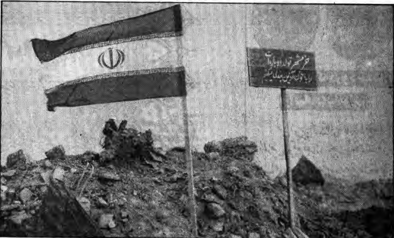
بعثیون جنایت پیشه پنداشته بودند که پناه مستحکمی برای خود ساخته‌اند اما نمی‌دانستند که خانه امن‌شان در برابر اراده رزمندگان خداجوی ایران لانه عنکبوت را می‌ماند