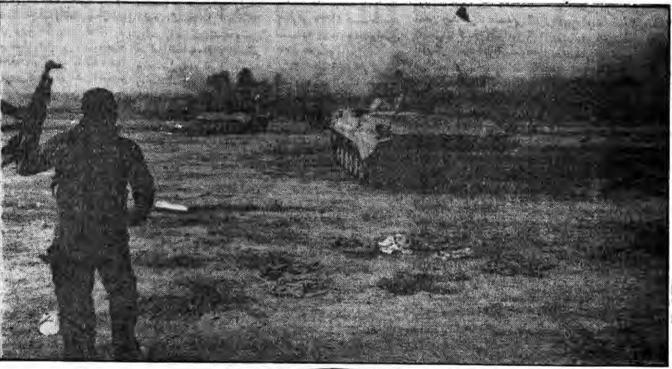
لشکر خدا در شهر خون و حماسه مستقر شده‌اند و با عنانم بدست آمده از دشمن کافر برای پیروزی‌های عظیم آینده به پیش می‌روند.