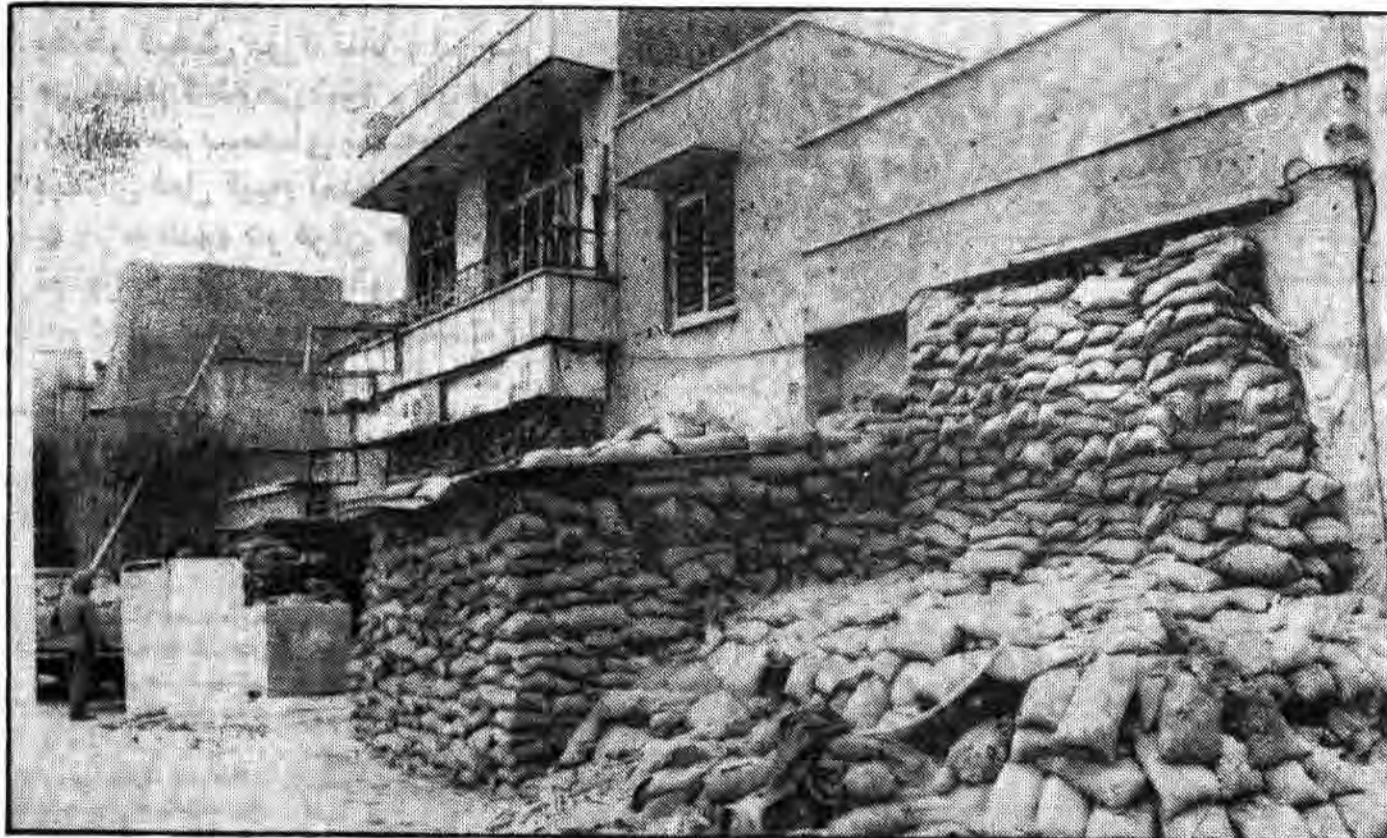
خرمشهر! سرانجام خون عزیزانمان ثمر بخشید. سرانجام ایشان گریه‌های اطفال ۱۳ ساله‌مان منجر به آزادیت گشت آزادیت مبارک.