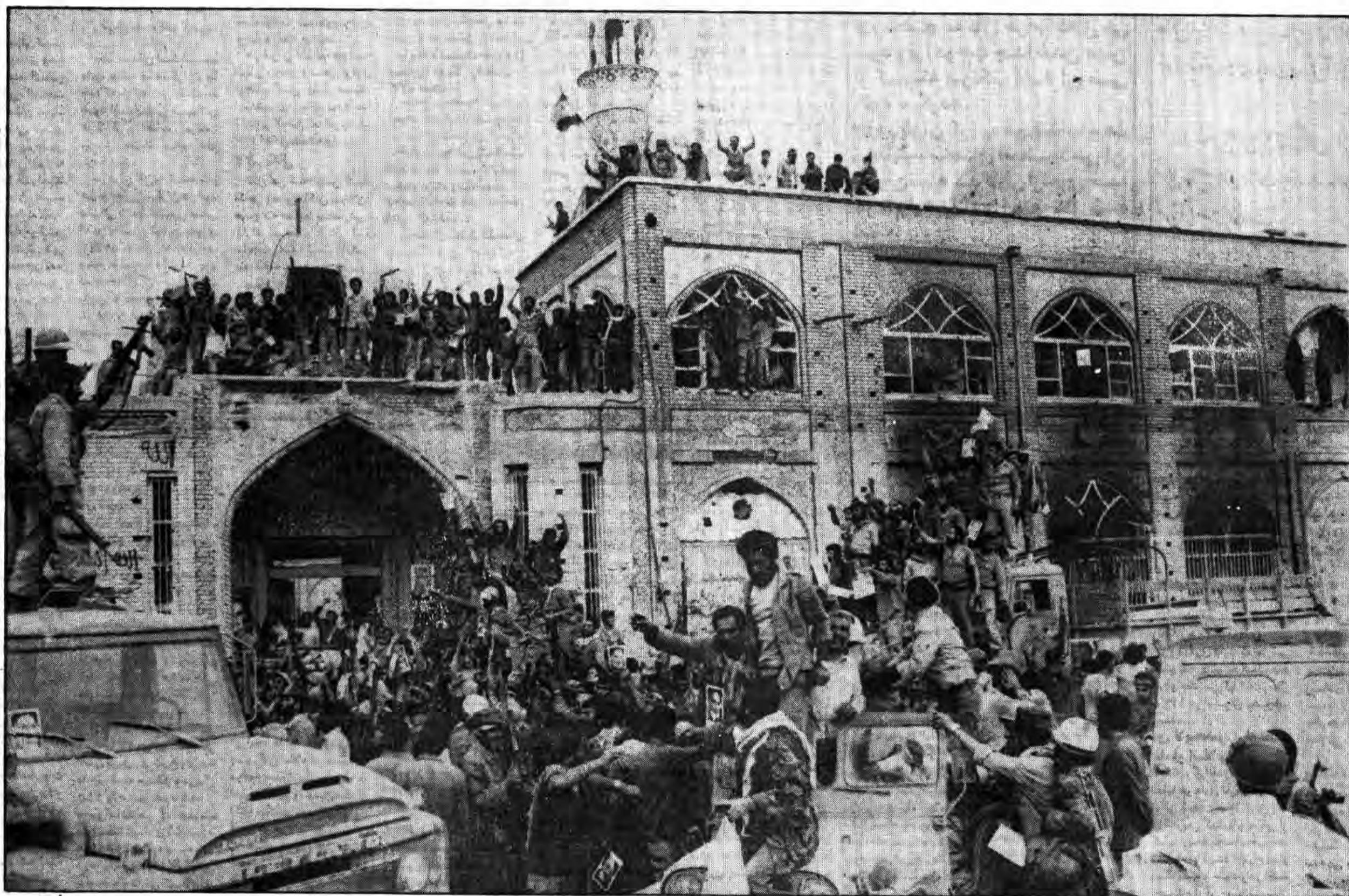
خرمشهر! نظاره کن ظفر اسلام بر کسفر، نظاره‌گر باش شور و هیجانی را که از آزادیت پدید آمده نظاره کن که چگونه بهترین فرزندانمان با قدم‌هایشان خاک زمین تو را نوازش می‌کنند، دیده بر جای قدم‌هایشان باید نهاد