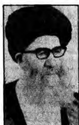
آیتالله العظمی مرتضی جعفری در پیما... متناسبت فتح خرمشهر: قدرت‌های بزرگ هیچگاه نمی‌توانند در مقابل ملتی که پیرو مکتب سیدالشهداء هستند ایستادگی کنند

پیام تبریک آیتالله العظمی گلپایگانی موج بازگشت به اسلام راتوپ و تانک و اسلحه پیشرفته مستوقف نخواهد نمود