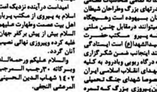
آیتالله العظمی جعفری در پیما... متناسبت فتح خرمشهر: قدرت‌های بزرگ هیچگاه نمی‌توانند در مقابل ملتی که پیرو مکتب سیدالشهداء هستند ایستادگی کنند

آیتالله العظمی مرتضی جعفری در پیما... متناسبت فتح خرمشهر: قدرت‌های بزرگ هیچگاه نمی‌توانند در مقابل ملتی که پیرو مکتب سیدالشهداء هستند ایستادگی کنند