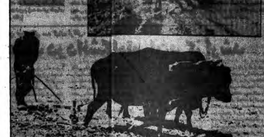
مزارعی در استان خراسان که در حال کاشت پنبه است.

● در زمینه تولید جوجه یک روزه گوشتی و مرغ تخم‌گذار از مرز خودگفائی گذشتیم. وزیر کشاورزی و عمران روستایی در پاسخ سؤال خبرنگار که در زمینه تولید جوجه یک روزه گوشتی و مرغ تخم‌گذار از مرز خودگفائی گذشتیم، اظهار داشت: در این زمینه ما تا حد زیادی موفق شده‌ایم و اکنون می‌توانیم نیازهای داخلی کشور را تامین کنیم.