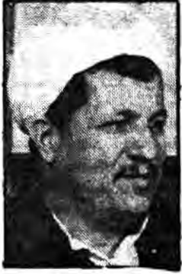
جناب آقای حسن حبیبی رئیس مجلس شورای اسلامی

انقلاب فاشیستی و استبداد فاشیستی در عراق است که مجلس شورای اسلامی انجام آن است. از کارهای عصای که تاکنون در مجلس پارسی شده، طرحها و لوایح مادر در مسائل اقتصادی مانند اراضی شهری و ملی کردن بانکرهای خارجی و بسیاری چهارم دیگر لوایح سیاسی مانند طرح احزاب و مطبوعات و لوایح اداری مانند لایحه بازسازی بود است و در مجموع در بخش اقتصادی سیاسی و اداری و هم در خصوص کلی نظارت بر جریانهای کشور مجلس بسیار موثر بوده و مردم مطمئن هستند که احتمال انحراف در مجلس که دارای چندین محیط پارسی است وجود ندارد و در آینده پایه حرکتهای ضروری انقلاب در مجلس ریخته خواهد شد.