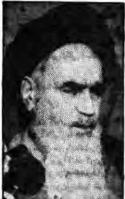
اسلامی موفق باشند امید است دولت و ملت شریف از پشتیبانی این بنیاد در ریغ نمایند