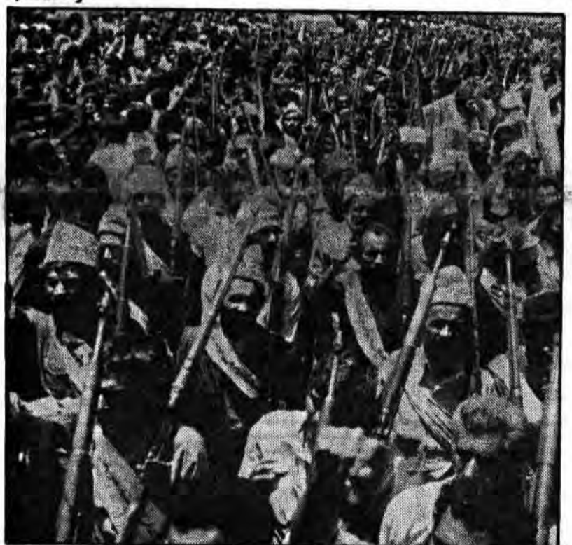
در سالروز ۱۵ خرداد روز حماسه و خون و قیام، صف راهپیمایان تهران را عظمت دیگری بود و این عظمت ناشی از شرکت یکپارچه عشایر غیور و سلحشور، این ذخایر و مرزبانان میهن اسلامی بود. تصویر فوق نیروی همیشه آماده عشایر را، که بطور مسلح در راهپیمایی پوماله ۱۵ خرداد (دیروز) شرکت کرده بودند نشان می‌دهد

تلفن‌های جدید روزنامه جمهوری اسلامی ۰۲۰۶۱۱۴-۱۸