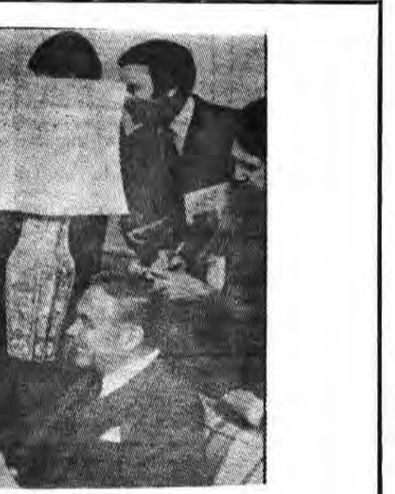
سیاست خارجی آمریکا و مراکز عمده قدرت در آن کشور در دست صهیونیست ها قرار دارد و رژیم اشغالگر قدس همیشگی است

بسیاری از صهیونیست های که در آمریکا و اروپا بسر می برند، تابعیت دوگانه دارند که یکی از آنها تابعیت کشور محل اقامت آنها و دیگری تابعیت اسرائیل است.