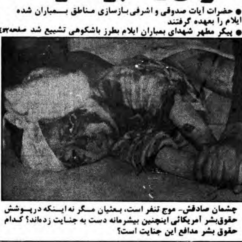
جشمان صادقش - موج تنفر است، بعثیان مسگر نه اینکه در پوشش حقوق بشر آمریکائی اینچنین بشیرمانه دست به جنایت زده اند؟ کدام حقوق بشر مدافع این جنایت است؟

گزارشات تازه و مصور از جنایت بمباران ایلام توسط صدام قوای اسلام دوهواپیما و یک ناوچه جنگی عراق را نابود کردند ● حضرات آیات صدوقی و اشرفی بازسازی مناطق بمباران شده ایلام را بعهدہ گرفتند ● بیکر مطهر شهدای بمباران ایلام بطرز باشکوهی تشییع شد صفحه ۳۳