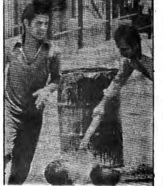
مسلمانان مناطق اشغالی، سلاحهایی را که به شمشیت میگیرند استفاده می کنند. در عکس سوزاندن کلاه خود های سربازان اسرائیلی مشاهده میشود

☆ صلاح الدین ابویی در جنگ با دشمن تاکتیک نابود سه گانه را ابداع کرد. بدین گونه که نیروهایش را به سه گروه تقسیم کرد که به تانک دشمن را و بویژه حمله به فرار از برابری دشمن و کشتن آن به کمیته های از پیش آماده شده را به خوبی فرا گرفته باشند.