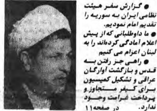
گزارش سفر هیئت نظامی ایران به سوریه را تقدیم امام نمودیم. ما داوطلبانی که از پیش اعلام آمادگی کرده‌اند را به لبنان اعزام می‌کنیم. راهی جز رفتن به قدس و بازگشت آوارگان عراقی و تشکیل کمیسیون برای کسب مستجابوز و پرداخت ضمانت وجود ندارد. در صفحه ۱۱

هیات بلند پایه نظامی ایران پس از بازگشت از سوریه: در نبرد با اشغالگران قدس ارتش و سپاه مثل همیشه مشترکاً وارد عمل خواهند شد در صفحه ۱۰