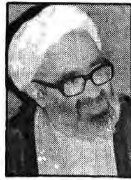
بسیار دارم ملت مسلمان و مظلوم عراق آمادگی کامل دارد تا ملت مسلمان و بیروهای زرمده ایران را عسور حاکم آن کشور مسجد الاقصی را نجات دهد در صفحه ۱۰

فرمانداران سراسر کشور با آیات عظام در قم، رئیس دیوانعالی کشور و نخست وزیر دیدار کردند در صفحه ۱۱