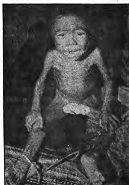
«اینها به سوی سوء تغذیه، بدون دسترسی به داروهای پیشرفته، جان می‌سپارند. چند هفته پیش در یک سفر به یک روستای فقیر در غرب آفریقا، من دیدم که کودکان در آنجا در اثر مالاریا جان می‌سپارند.»

هر سال یک میلیون کودک آفریقایی زیر پنج سال در اثر مالاریا جان می‌سپارند تقریباً ۱۰۰ میلیون تن از مردم جهان به سوء تغذیه دچارند. از سال ۱۹۶۱ تا سال ۱۹۸۰ بیش از ۵۰۰۰۰۰ کارشناس، کشورهای جهان سوم را به سوی غرب ترک کردند. آمریکا از فرار مغزهای کشورهای توسعه نیافته استفاده کرده و در ۳۰ سال اخیر ۱۰۰۰۰۰ میلیون دلار از این راه سود برده است. رؤسای تجارخانه‌های بزرگ، پشاهگانی را به دهه‌ها کشور توسعه نیافته می‌فرستند تا آنها روشنگران، مهندسان جوان و غیره را شکار کنند. گرسنگی، تهی‌دستی، بیماری و غیره، یکی از نتایج ربودن مغزهای جهان سوم است.