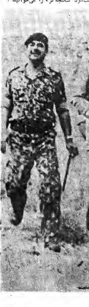
صدام و محافظینش