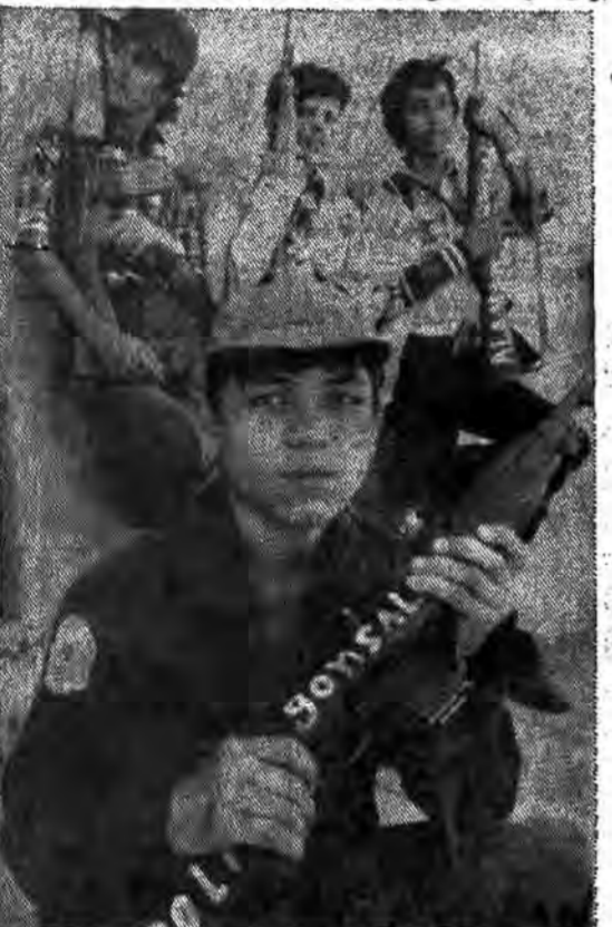
چریک های ال سالوادور به نگهداری ایستاده اند

با ما نیست. زمانی بود که به نظر می رسید موازنه میان نیروهای حکومت و نیروهای انقلابی برقرار شده است. یعنی آن که به نیروهای میهن پرست و نه ارتش شورا