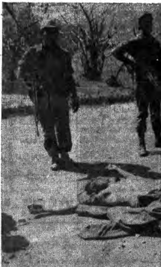
دراوج مبارزه ضد امپریالیستی نیروهای آزادی بخش سربازان ال سالوادوری خلق ستم دیده را به گلوله می بندند.