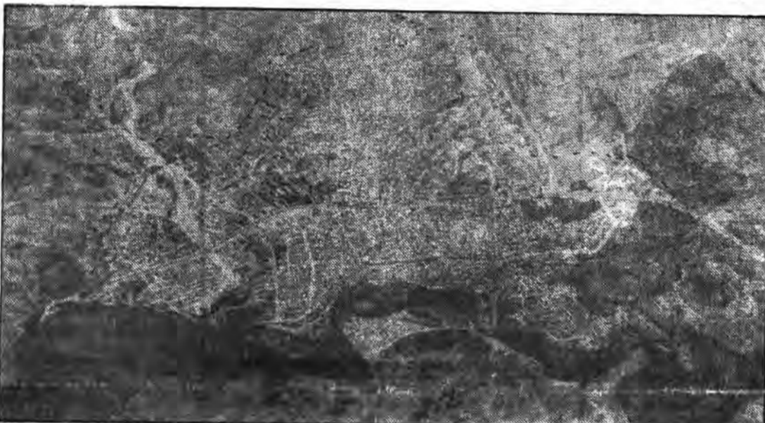
تصویر هوایی شهر مرزی قصر شیرین قبل از هجوم وحشیانه مزدوران ویرانگر صدام صهیونیست با خاک یکسان شده است

استحکامات دشمن در خاک عراق زیر آتش قوای اسلام قرار گرفت