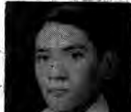
با نسی را انجام بدهد و با تمام...