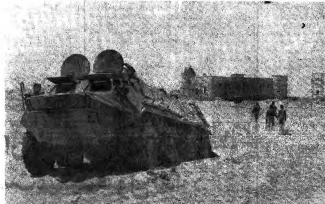
● زخمی شدن لشکر اسلام در عملیات رمضان بایورش دلیرانه پاسگاه «زید» در عمق خاک عراق را تصرف خود در آورند.

بدستور صدام کفیل وزارت خارجه عراق اعدام شد ● رادیو آلمان: عملیات رمضان ثابت میکند ارتش بی روحه عراق دیگر قادر به تجدید سازمان و تقویت نیرو نیست. ● روزنامه تایمز: قطعه نامه شورای امنیت در جهت تأیید مواضع عراق در جنگ و پاسخی فوری به ترس عراق از عملیات احتمالی ایران بوده است. ● روزنامه تایمز: نباید تعجب کرد که مقاومت ارتش عراق در برابر حمله ایران یک شبه درهم شکسته شده باشد. در صفحه ۱۲ و ۱۳