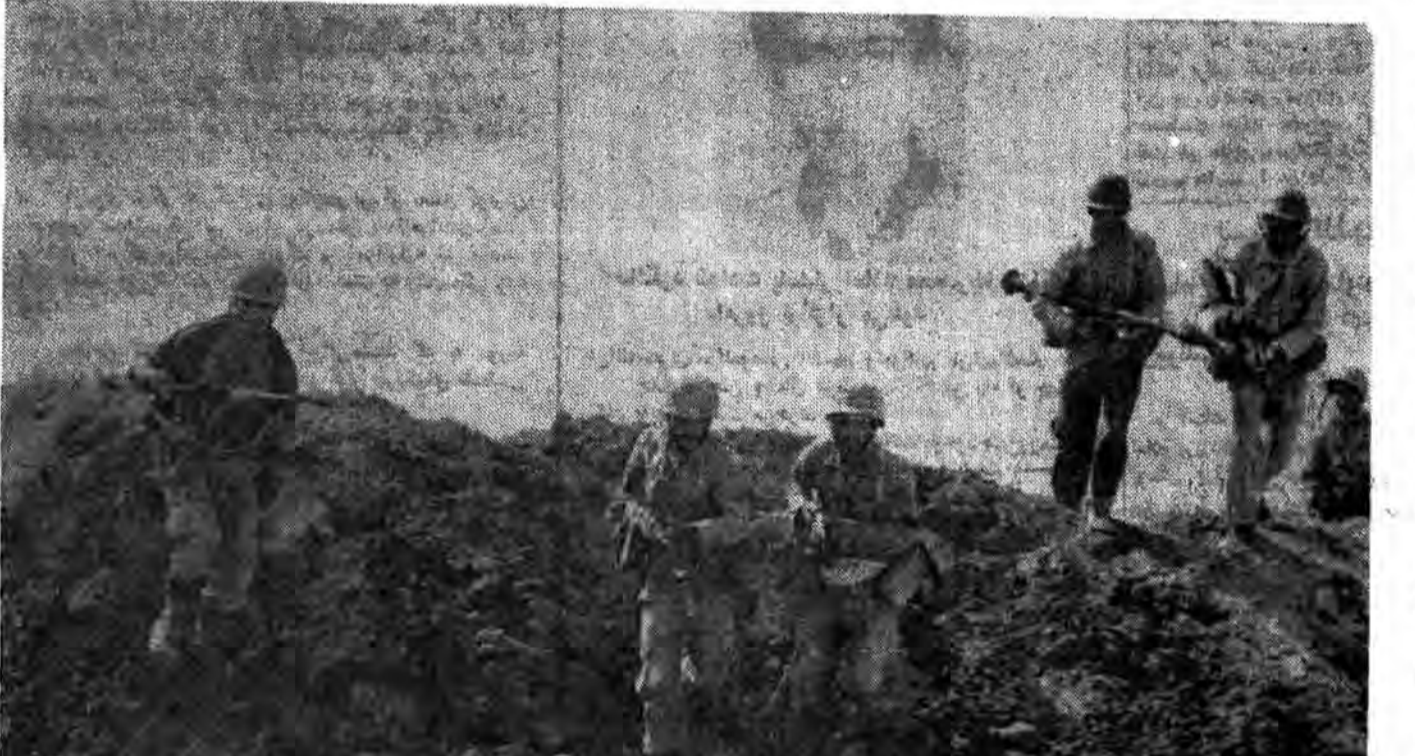
گزارشی از عملیات رمضان