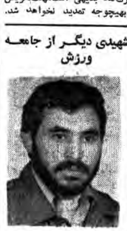
شهیدی دیگر از جامعه ورزش

عراق باید از شر این مفسدین و این غاصبین فارغ بشود «امام خمینی»