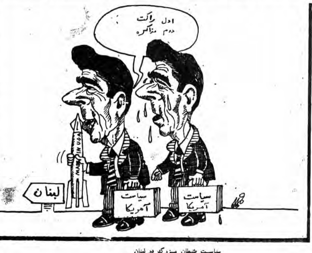
سیاست شیطان بزرگ در لبنان

جدیدی یا بوجود آورد که برکناره آفریقای شرقی مسلط گردید. آنها مردم فرهنگ ساحلی خوانده شدند. موزامبیک که در یادبود پرتغالی‌ها نماد امپریالیسم را دور زدند و در سال ۱۹۷۸ میلادی به موزامبیک رسیدند، مسلمانان از قدرت جنوب پیش‌رفته بودند که در شهر سوفالا (درست در جنوب بندر کونی بیلا) اقامت کردند. بیشتر مردمان «ماتاکا» - «لوموه» که در مناطق شمالی موزامبیک سکونت کردند، مسلمانان بودند و در ضمن جامعه‌های مهمی از مسلمانان در میان مردمان «کونی» و «یانو» در شمال غربی و در میان خلق «توتگا» در جنوب‌غربی وجود داشتند. پناهداری مانند جزیره موزامبیک «گنگوش» و «سوفالا»، «مراکز» و ترقی تجارت میان آفریقا، هند و خاورمیانه بودند. پرتغالی‌ها در حالی که از غیرت مسیحی سرمست بودند و به‌علت جنگ‌های صلیبی میان مسیحیان و مسلمانان نفرت فراوانی از مسلمانان داشتند، فرامی‌سپارند. «هتری دریانورد» پادشاه پرتغال، جنگ ملیتی جدیدی را علیه جهان اسلام آغاز کرده بود و هدف او از این عمل آن بود