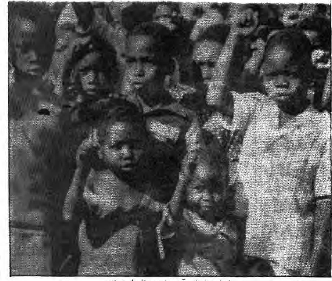
اینجا سرمایه‌های آینده ملت موزامبیک هستند

نیروهای پرتغالی در این کار به آن‌ها کمک کردند. «فرلیمو» در سالهای اولیه قدرت خود، یک نظام خشن مارکسیستی لنینیستی را برپا کرد و همه آثار دین و مذهب را از میان برد. شیخ مسلمان که قبلاً در زمان پرتغالی‌ها رنج برده بودند، در این زمان ضعیف‌تر شدند. چاپ و توزیع ادبیات اسلامی و حتی قرآن ممنوع گردید و یک نظام آموزشی «دکترنی» مارکسیستی معرفی گردید. با گذشت زمان، پارتی‌ها از دوستان «موندلین» به موزامبیک بازگشته‌اند و ست‌های برجسته در حکومت این کشور پدید آمده‌اند و «فرلیمو» دارد ارتباط‌های خود با غرب را بازسازی می‌کند و حکومت که از کنترل