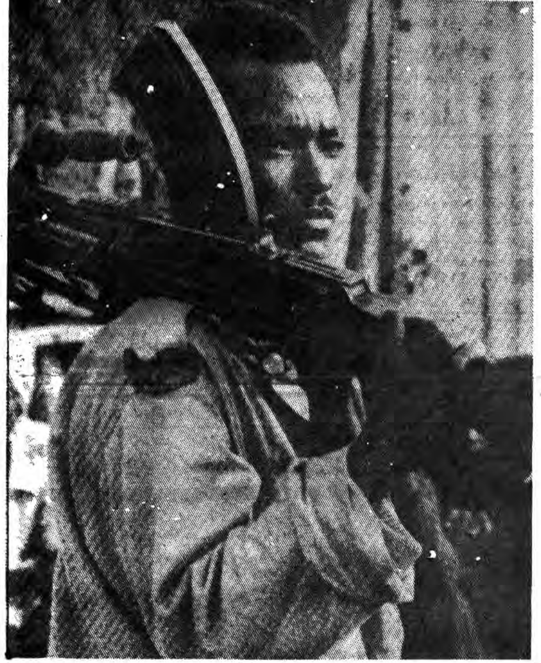
تمام فرقه‌های ملت موزامبیک طی منطقه اجنبی‌ها به‌تجدد مبارزه میکنند.

جدیدی یا بوجود آورد که برکناره آفریقای شرقی مسلط گردید. آنها مردم فرهنگ ساحلی خوانده شدند. موزامبیک که در یادبود پرتغالی‌ها نماد امپریالیسم را دور زدند و در سال ۱۹۷۸ میلادی به موزامبیک رسیدند، مسلمانان از قدرت جنوب پیش‌رفته بودند که در شهر سوفالا (درست در جنوب بندر کونی بیلا) اقامت کردند. بیشتر مردمان «ماتاکا» - «لوموه» که در مناطق شمالی موزامبیک سکونت کردند، مسلمانان بودند و در ضمن جامعه‌های مهمی از مسلمانان در میان مردمان «کونی» و «یانو» در شمال غربی و در میان خلق «توتگا» در جنوب‌غربی وجود داشتند. پناهداری مانند جزیره موزامبیک «گنگوش» و «سوفالا»، «مراکز» و ترقی تجارت میان آفریقا، هند و خاورمیانه بودند. پرتغالی‌ها در حالی که از غیرت مسیحی سرمست بودند و به‌علت جنگ‌های صلیبی میان مسیحیان و مسلمانان نفرت فراوانی از مسلمانان داشتند، فرامی‌سپارند. «هتری دریانورد» پادشاه پرتغال، جنگ ملیتی جدیدی را علیه جهان اسلام آغاز کرده بود و هدف او از این عمل آن بود