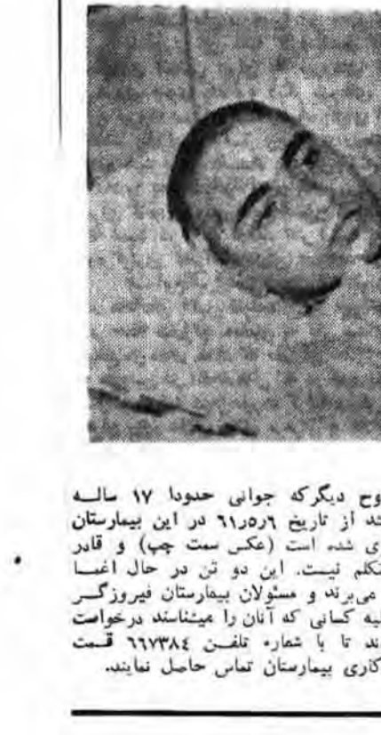
نام و نام خانوادگی این شخص در دسترس نیست.

استمداد بیمارستان فیروزگر از بستگان دوتن از مجروحین جنگ. این دو مجروح در جریان نبردهای اخیر در منطقه کرپلا مجروح شدند.