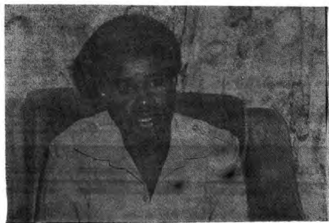
«سعد حداد» همان چهره‌ای بود که رژیم اشغالگر قدس از ۳۴ سال پیش در لبنان چنین شخصی بود.

حکومت‌های غیرقانونی در این اشغال‌شده‌های جنگ‌دوستانه در لبنان زمین برای تاسف‌ناک آن سرزمین یا حمایت قدرتمندی خارجی فراهم گردید. پس از سرری شدن به آن حمله اسرائیل به خاک لبنان و هنگامیکه آن دولت ناگزیر شد تا در پی فشارهای بین‌المللی و فشار آمریکا قسری خویش را از خاک لبنان فرابگذارد، باریکه به عرض متوسط ده کیلومتر که بموازات نوز آن کشور با لبنان واقع است (سربازان صلح سازمان ملل متحد آخرین بار بمقدام ۷۰۰ تن در آن نوازه‌ریز مستقر شدند) را بعنوان منطقه حد فاصل اعلام داشت و حکایت بر آن ناحیه را بر عهده سرگرد حداد واگذار کرد و سعد حداد سپس را ۱۰۰۰۰ تن از افراد چریک خود در آن بخش از خاک لبنان مستقر گردید که از این عده از مسیحیان و شیعیان همجنان به‌عنوان کمادوئیس (اگرچه بصورت محدود) پرداخته، از فراز خود حد فاصل مرزی سه آنتاری حاکم اسرائیل ادعا می‌کند. این ساله یونانی الاصل و دارای قلمه بازید به عمل آورد، در این مراسم با حداد نیز ملاقات کرد و آنها یکدیگر را در آغوش کشیدند. وگویی ضمن این دیدار یکین به‌دستیار خود اظهار داشته است: «بالوقت اکنون دیگر متعلق به‌صفتا». حاصل تاج‌اندازه اسرائیلیان در نظر دارند منطقه نوز این سرگرد را که اینک «حدادستان» نام گرفته، توسعه بخشند، و شوش اشکارا نیست، لیکن در صحت این مطلب اطمینان حاصل شده، که این امر اجرایی ۴۴ ساله یونانی الاصل و دارای منصب کاتولیک مسیحی بیشتر در نقش یک دستیار خصم عمل می‌کند تا در نقش یک «پتن» (مارشال) باشد. به‌رقتبیر ناخوشگین اسرائیل حدها یک ملت وزارت در دولت آینده لبنان درخواست کرده است.