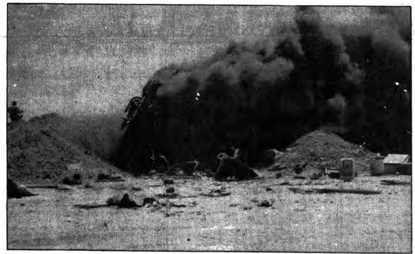
بچه ها، ای کافران بعضی آتش خشم خدا را که بدست توانای جندها بر سران می بارد هر چند که از مجهزترین ادوات زرهی جنگ با اسلام برخاسته آید و در آینده ای نه چندان دور آتش عظیم تر بر سران خواهد بارید و انقاص خون تمامی مظلومان در مدیانتوریتان را خواهند گرفت

بسم الله تعالی کانون سینماگران آماطور ایران وابسته به وزارت ارشاد اسلامی در مرحله نخست پذیرش از میان برادران شاغل در نهادهای انقلاب اسلامی برای دوره جدید فیلمسازی هنرجو می پذیرد. علاقمندان جهت کسب اطلاع و تکمیل فرم درخواست پذیرش میتوانند به نهاد ذریع و یا به محل کانون سینماگران آماطور ایران واقع در خیابان ولیعصر نرسیده به میدان تجریش باغ فردوس کوچه دلبز پلاک ۱۹ مراجعه نمایند. آخرین مهلت پذیرش فرم ۲۰ مرداد ماه جاری خواهد بود.