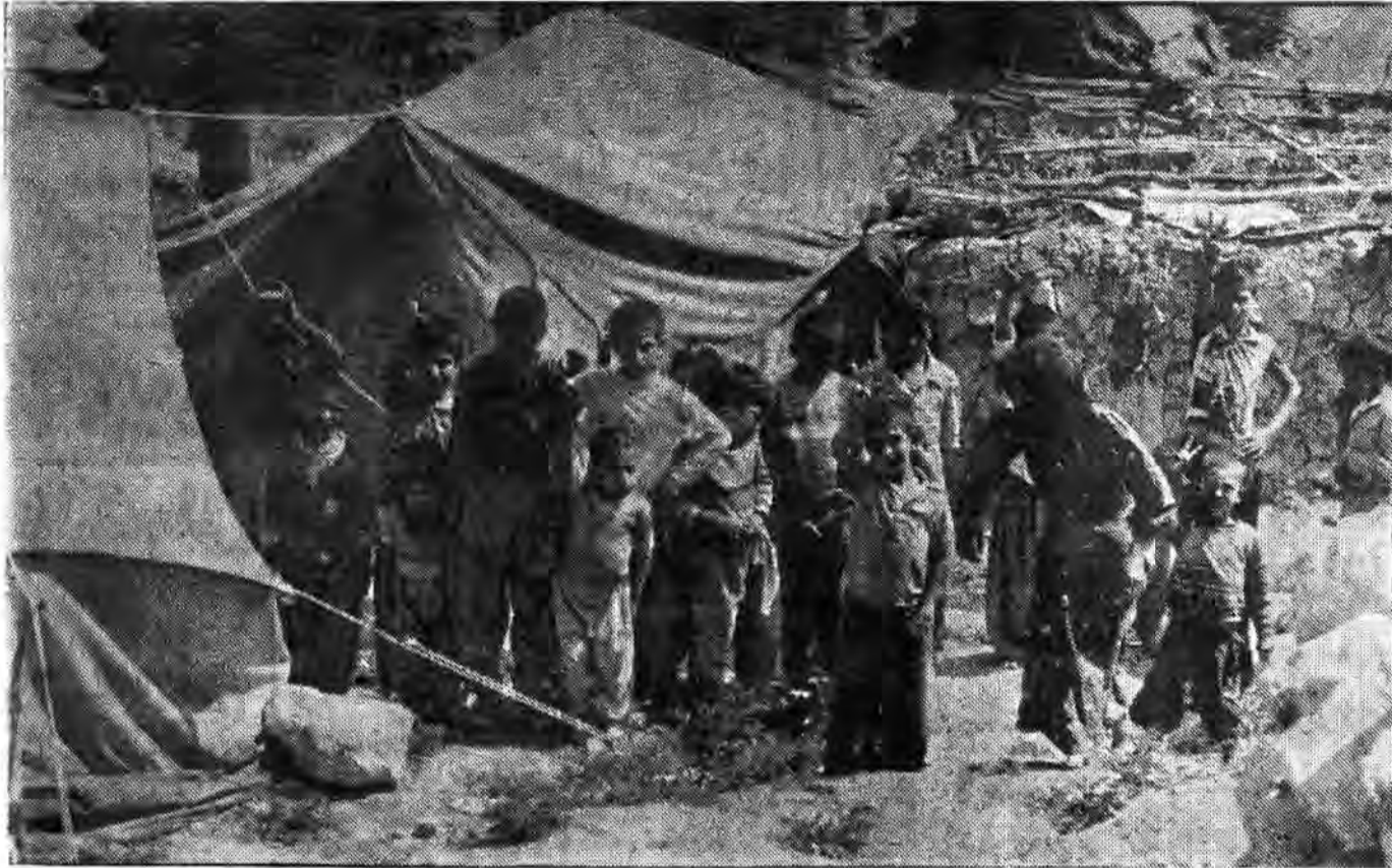
این کودکان و زنان عشار غرب چه گاهی کرده بودند که این چنین باید طعمه هوس شای جاهطلبانه آمریکای جانیکنار و سوگرش صدام قرار گیرند. اینها گاهی جز گفتن استقلال آزادی - جمهوری اسلامی، داشتند؟

دشمن آنقدر نفهم بود که تا کتک دختری را که قریب دوسال بارها مشاهده کرده و از پهلوی آن عبور میکرد بجای نفرات ما گرفته و برای انهدام آن گلوله تسویب بکار می گرفت. بیشتر مینهای میداین صدامیان بدون حساب و برنامه ایجاد شده بود. بیشتر مینهای صدامیان که بمنظور جلوگیری از حملات قوای اسلام احداث گردیده بود باهوشیاری و ابتکار رزمندگان اسلام کشف و جمع آوری شده اند. کف رودخانه ها، حاشیه جاده ها - پلهای پیاده رو، ساختمانهای تپه خراب - سایه پانهای تاک درختان توئمند - دشمنها و مزارعهای محل چرای گوسفندان و دهها مکان دیگر محلهایی هستند که دشمن در آنجاها انواع مینها را بکار برده و مین گذاری کرده است. مینهای ضد تانک ساخت شوروی، مینهای ضد نفر و باصطلاح مینهای چنده ساخت مصر و مینهای ضد تانک و نفر ساخت اسرائیل ارقام بزرگ مینهای کشف شده را تشکیل می دادند.