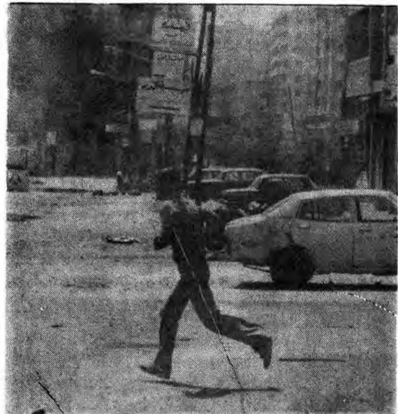
نیروهای سعد حداد، بعنوان دستیار دشمن متجاوز عمل میکنند.

* موشه‌دایان خونخوار در سال ۱۹۵۴ چه برنامه‌ای را برای لبنان مظلوم طرح کرده بود؟ * سرگرد فراری و مزدور، بنام «سعد حداد» چگونه برویاهای اسرائیلی «لبنان آزاد» جامه عمل می‌پوشاند؟ * سعد حداد یونانی الاصل ۴۴ ساله، نقش «ژنرال پتن» را در وطن‌فروشی فراتر از او در فرانسه بعهد گرفته است و یک دستیار خصم خونخوار شده است.