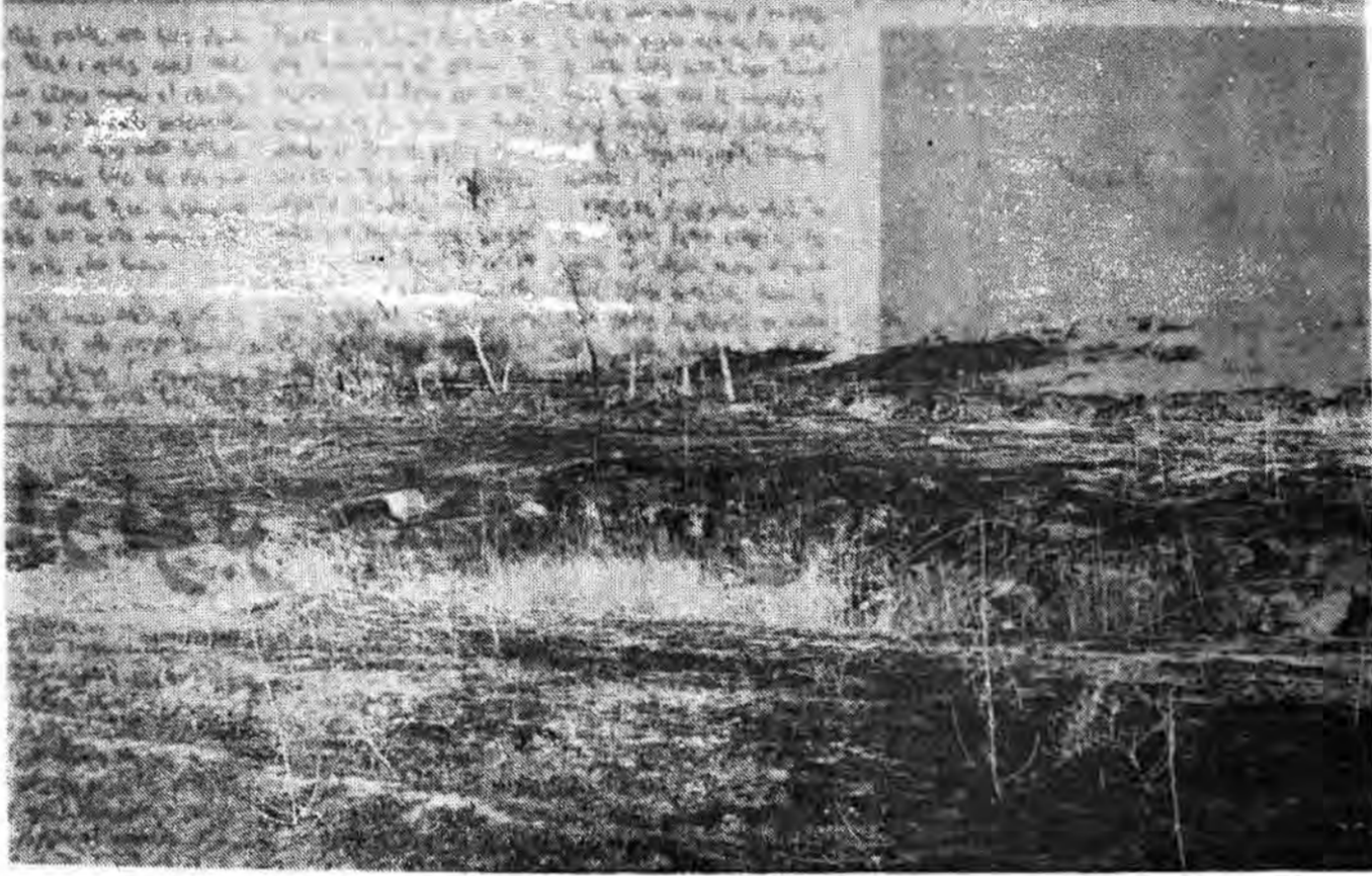
نونهای از هزاران بلخ در مناطق غرب کتور که توسط بعثیون بغداد در زمانیکه آن مناطق را اشغال کرده بودند آتش کشیده شده است.

✳ از آن همه جنایت که مزدوران صدامی در سواد وجود آوردند بگذریم. مزدوران صدامیان - کودکان دختران و پیرمردانی که توانائی فرار نداشتند را با اسارت گرفتند و آنچه قلم از نوشتن آن شرم دارد بر سر این بیسپاهان آوردند. ✳ آنچه این امت حزب الله از ابتدای نهضت گفته وبا ایناد جان و مال بر گفته اش استقامت ورزیده قیام برای خدا بوده و تا استقرار حکومت الله از پای نخواهد نشست. ✳ آقایان شورای امنیتی! آقایان حقوق بشری! وای تمامی مستکبران و جنایتکاران عالم، باردیگر به شما می گوئیم، اگر تمامی شما برای نابودی ما متحد شده اید ما هم تا استقرار حکومت الله و اهتزاز پرچم لاله الله بر تمامی عالم از پای نخواهیم نشست.