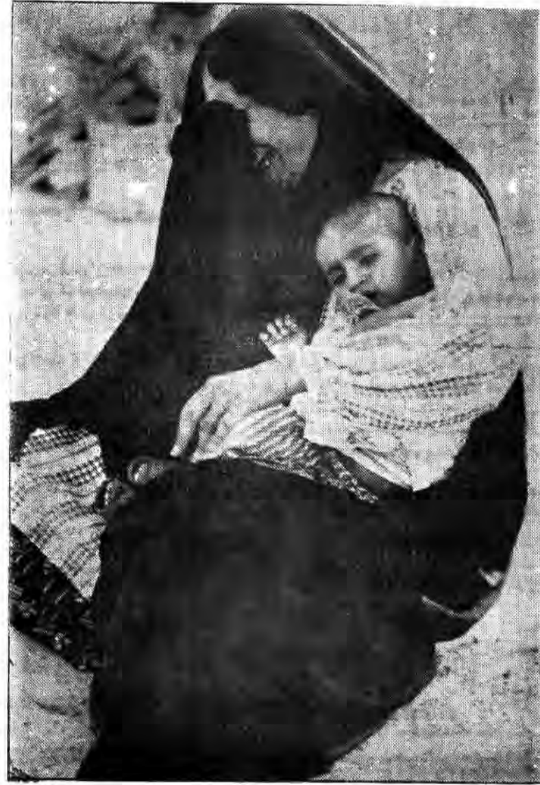
آقایان! خورای امنیت و حقوق بشر! چه جوابی به این مادران و زنان فرزند و شوهر از دست داده دارید، بدهند که به حیات از صدام خائن به اسلام و غرب برخاسته و برای حفظ این ابرجانیکنار که چنگ را به ایران و امت اسلام تمهیل کرد قطعنامه صادر میکنند.

دشمن آنقدر نفهم بود که تا کتک دختری را که قریب دوسال بارها مشاهده کرده و از پهلوی آن عبور میکرد بجای نفرات ما گرفته و برای انهدام آن گلوله تسویب بکار می گرفت. بیشتر مینهای میداین صدامیان بدون حساب و برنامه ایجاد شده بود. بیشتر مینهای صدامیان که بمنظور جلوگیری از حملات قوای اسلام احداث گردیده بود باهوشیاری و ابتکار رزمندگان اسلام کشف و جمع آوری شده اند. کف رودخانه ها، حاشیه جاده ها - پلهای پیاده رو، ساختمانهای تپه خراب - سایه پانهای تاک درختان توئمند - دشمنها و مزارعهای محل چرای گوسفندان و دهها مکان دیگر محلهایی هستند که دشمن در آنجاها انواع مینها را بکار برده و مین گذاری کرده است. مینهای ضد تانک ساخت شوروی، مینهای ضد نفر و باصطلاح مینهای چنده ساخت مصر و مینهای ضد تانک و نفر ساخت اسرائیل ارقام بزرگ مینهای کشف شده را تشکیل می دادند.