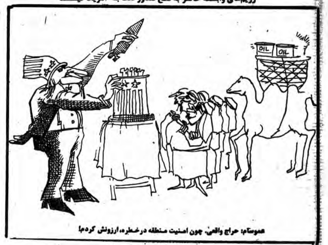
موسسات: حراج واقعی، چون اصنیت منطقه در خطر، آروزش کرده!