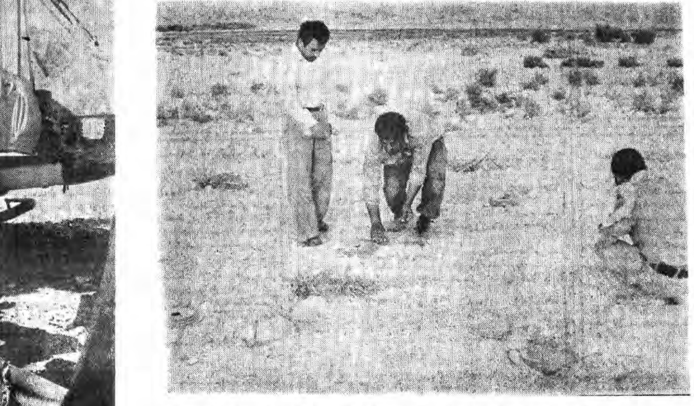
دشمن چه باطل اندیشیده است او با احداث میدان بزرگ بین بحال خود سنی برای جلوگیری از حمله رزمندگان اسلام ایجاد کرده است ولی رزمندگان چه خورند و آرام مشعل جیح آوری میبهاهند عکس فوق یکی از میداین مین گذاری شده در غرب کنورا نشان میدهد.