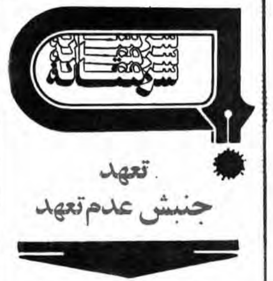
بسم الله الرحمن الرحيم