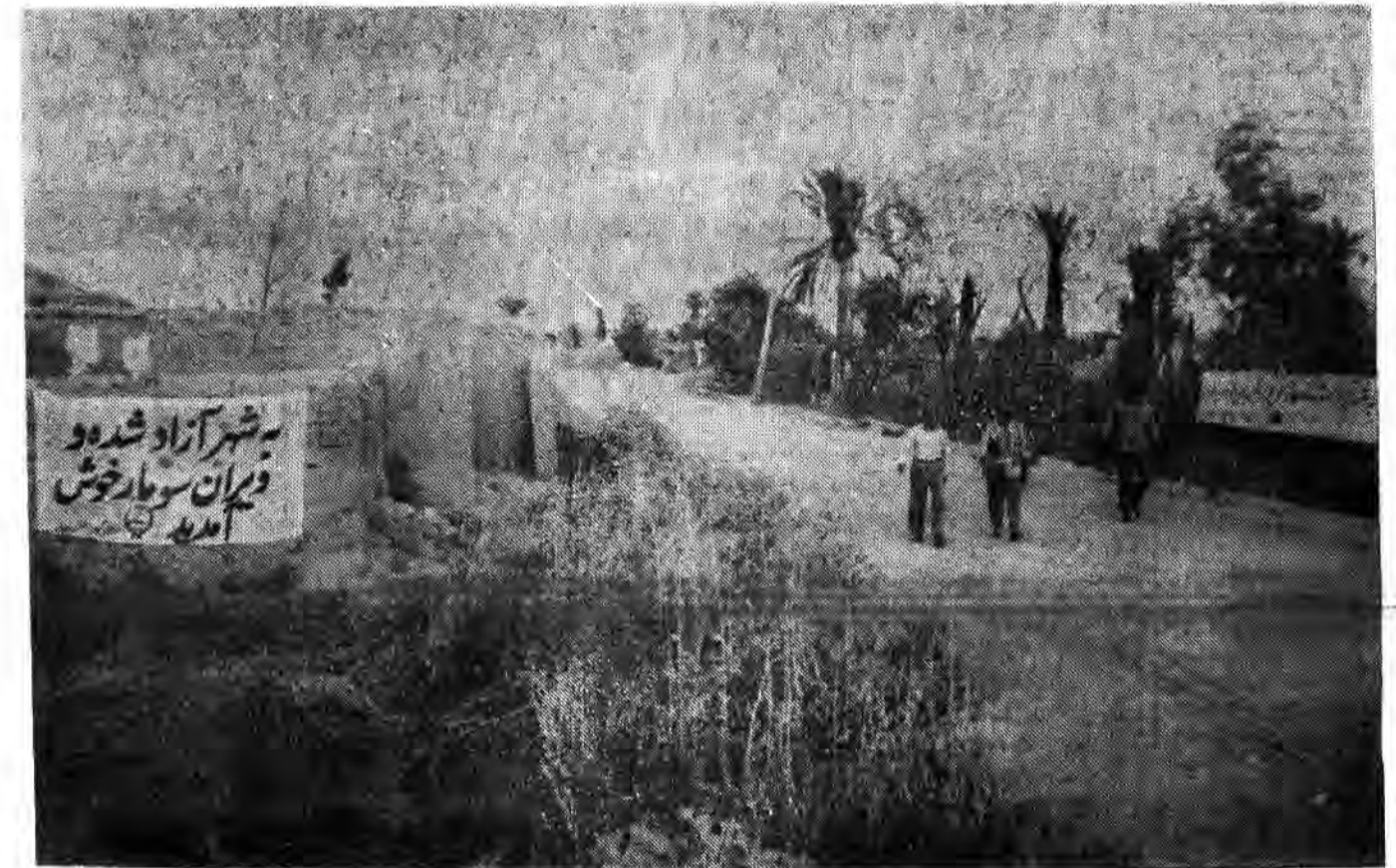
مجازوز یعنی ویرانگر از شهر سوهار فقط چندنیوار کلی در دروازه شهر باقی گذاشته اند.

انسان که اکثر آنها از عشار و کشاورزان بودند جمعیت شهر سوهار و ۱۸ روستای اطراف آن را تشکیل میدادند و باغات سرعی سوهار و روستا های اطراف همچنین بخش بزرگی از موقوفات بنیاد مستضعین بود. از طرف دیگر تلمیخانه آب سرعی شهر سوهار - نفت شهر و روستاهای این دو شهر در چهار کیلومتری شرق سوهار واقع است.