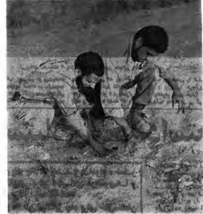
نگاه کنید چه صبور پس از خشی سازی مین در حال از زین بردن تله انفجاری که در زیر مین کار گذاشته میباید.