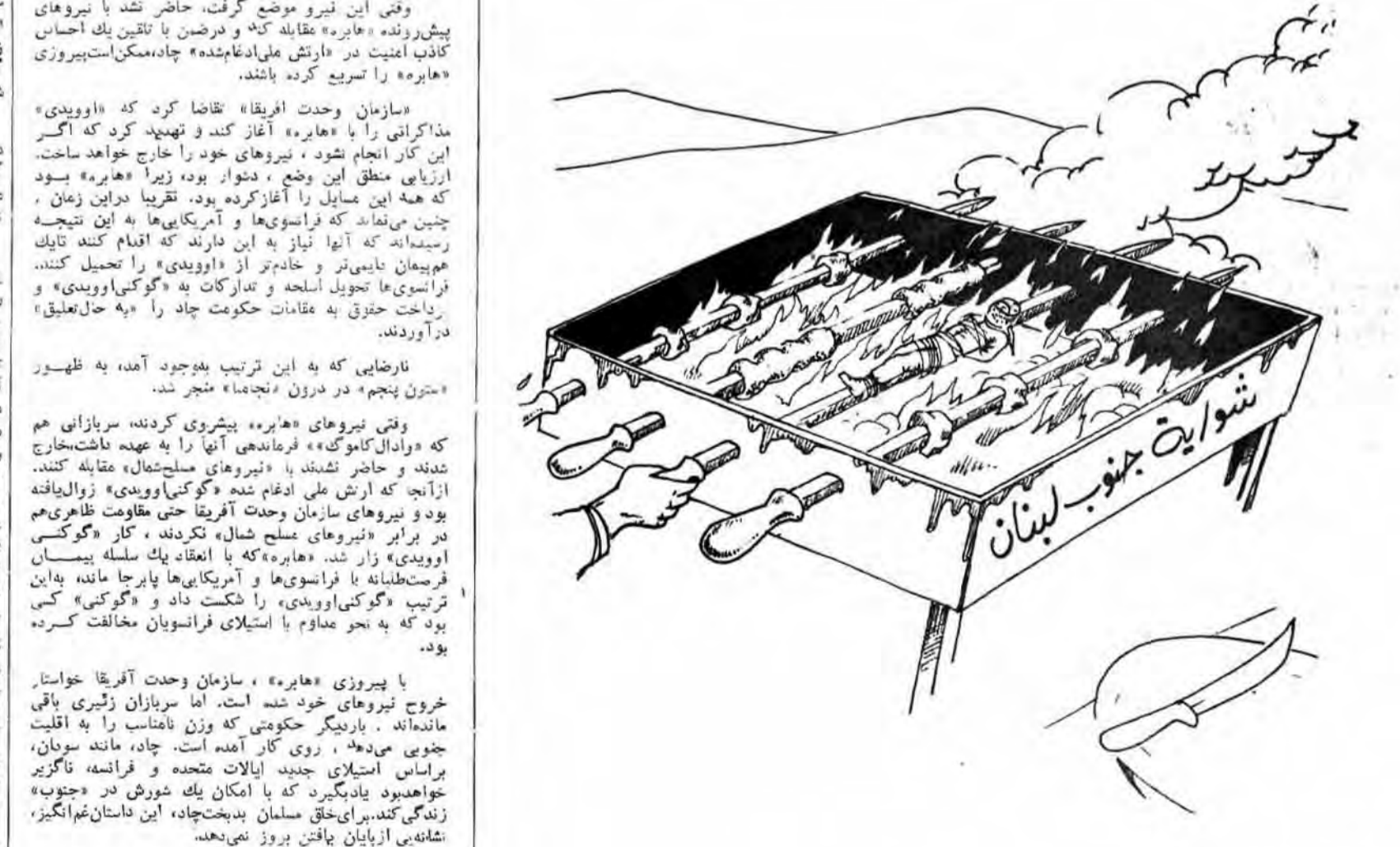
کاریکاتور از: از مجله عربی المجتمع بون شرح !!