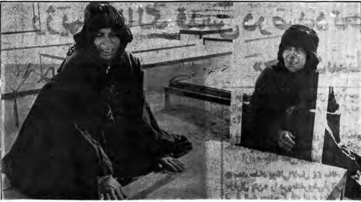
مادرم تو با صبر هفتاد زین استوار باش و بدان که دیگر حق تویی آمریکای جنایتکار در سازمان ملل هیچگونه تأثیری در اهداف ملل بیاعتماد ندارد