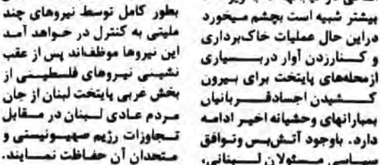
بگزارش واحد مرکزی خبر از بیروت در سیرت واقع اندکی در خیابانها که به ویرانه‌ها بیشتر شبیه است چشم مجبور در این حال عملیات خاک‌برداری و کسارادن آوار در بسیاری از محله‌های پایتخت جلیله بیروت کشیدن اجساد فرسوده بیمارانه و وحشیانه اخیر آمده دارد.