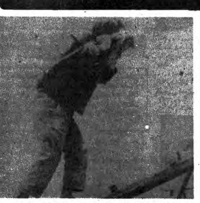
در سال ۱۹۷۹، ۷۵ میلیون کودک زیر ۱۵ سال در جهان مشغول بکار بوده‌اند که اکثر از کشورهای توسعه نیافته بوده است