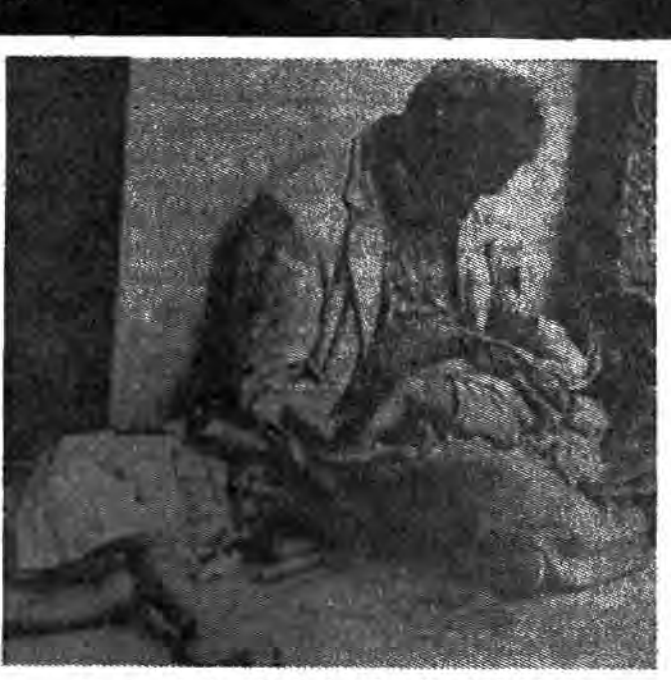
شرایط اسف بار و ناامید کننده‌ای که یک چهارم نوع بشر با آن دست به گریبان هستند.

متحمل میشوند. بحرانهای موجود سراسر به دارد. به تدریج رشد جمعیت در کشورهای عقب نگه داشته شده تولیدات کشاورزی آنان با اضافه عدم گسترش تکنیکی و صنعتی بطور کل، تمام جهان عقب نگه داشته شده را در حادترین وضعیت قرار داده است. تدریج رشد در کشورهای عقب نگه داشته شده- تولیدات قابل ملاحظه‌ای بدتر گردید. از طرف دیگر به عنوان یک حقیقت تلخ، در سال ۱۹۷۹ هفتاد و پنج میلیون کودک زیر ۱۵ سال در جهان مجبور به کار کرده‌اند، مخصوصاً در کشورهای عقب نگه داشته شده، در نمونه‌های بسیاری انجام کارهای خسته کننده و همواره شغلهای کم درآمد آنها بدون هیچگونه حق و مزایایی. ۲۵ درصد از نیروی کار جهان شامل زنان می‌گردد. با وجود اینکه آنها بیش از یک سوم کل نیروی کار را شامل می‌گردند، اما تنها یک دهم درآمد جهان را بدست می‌آورند. برای بیکاری و تخریب شد کارگری که توسط بهره‌کشان در این مواقع بحرانی اعمال می‌گردد، نتیجه آنرا بیشتر زنان