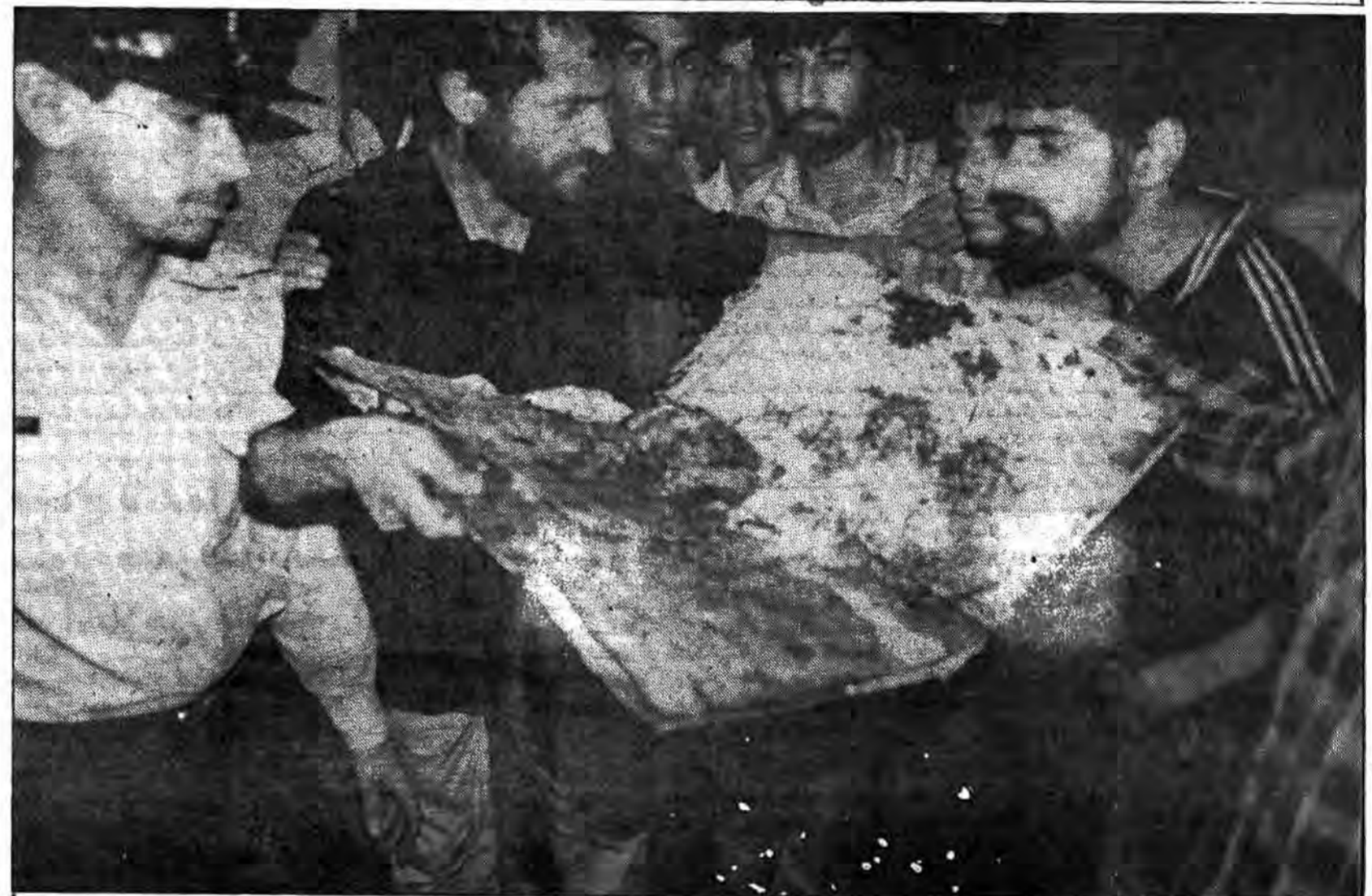
آیا حقوق بشری‌ها می‌بینند؟ اینها سند جنایات کسانی است که حقوق بشری‌ها برای آنها سینه جاک می‌دهند. درعکس مغز انسانی را می‌بینید که مزدوران آمریکا آنرا به این صورت درآوردند