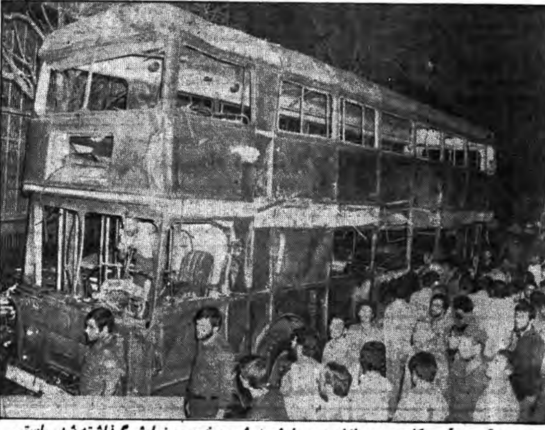
جهت گیری آمریکا و مزدورانش در حادثه دیشب بخوبی بنمایش گذاشته شد. راستی چه کسانی از اتوبوس استفاده میکنند؟

چشم‌ان منتظر کودکانشان دیگر آنها را نخواهد دید. قبلاً مزدوران آمریکا قربانیان جنایات خود را شناسائی میکردند. اما اکنون فهمیدند که همه مردم دشمنان سرسخت این جنایتکارانند. بساین حساب اینگونه خلق را به قربانگاه میبرند. امروز کودکان آنها وارث این خونهای بناحق ریخته هستند.