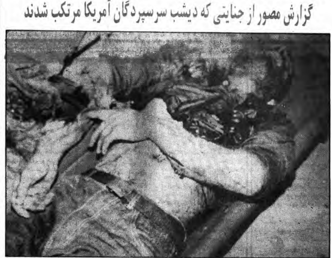
کوله بارش را بدست گرفته و با یکدنی امید به خانه میرفت. آیا او دست فروش کم بضاعتی است یا کارگری که شب هنگام با توشه ای برای فرزندان چشمبراهش به خانه میرفت؟ اما مزدوران امریکا سرو قامتش را اینگونه به زیر انداختند.

گزارش مصور از جنایتی که دیشب سرسپردگان امریکا مرتکب شدند