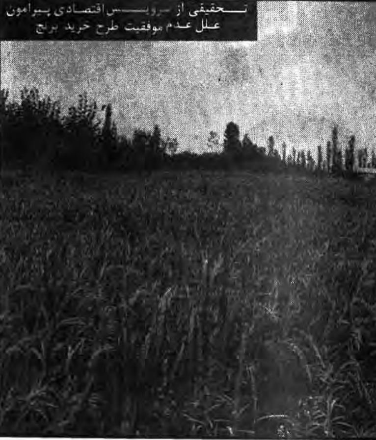
تحقیقی از سوی مأموران اقتصادی طرح خرید برنج

باید به اینها توجه کرد. اینها را باید بررسی کرد. اینها را باید بررسی کرد.