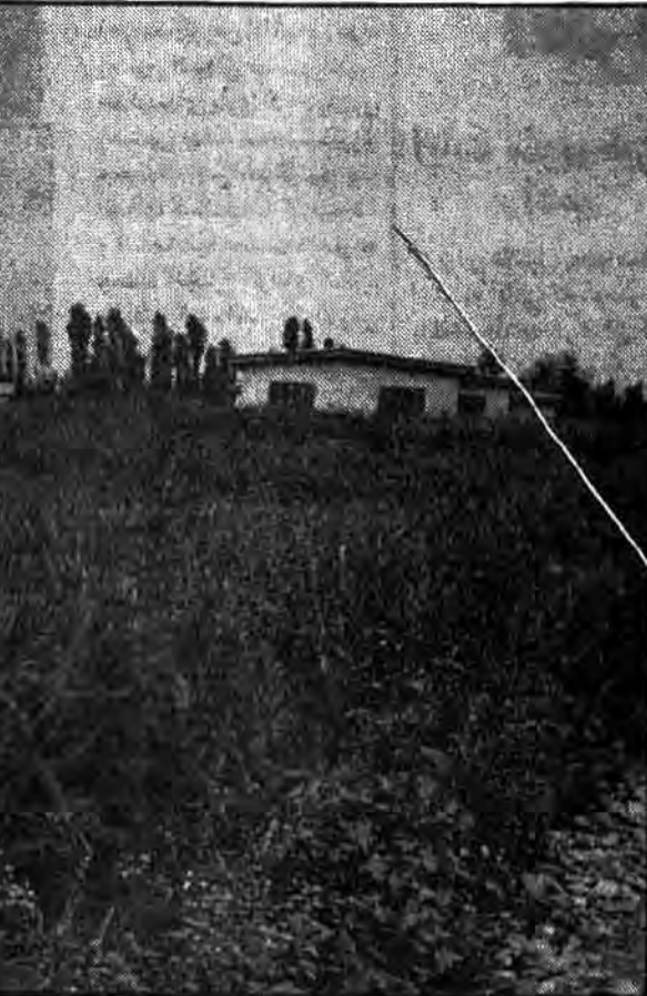
تحقیقی از سوی مأموران اقتصادی طرح خرید برنج

در مجموع من فکر می‌کنم که دولت برای اجرای این طرحها هنوز ضوابط و ضوابط لازم را وضع نکرده است. در واقع ما این طرحها را در حال اجرا داریم و هنوز نتوانستیم به اهداف خود دست پیدا کنیم. این طرحها را در حالی که در حال اجرا داریم، باید بررسی کنیم. اگر ما این طرحها را در حالی که در حال اجرا داریم، نتوانستیم به اهداف خود دست پیدا کنیم، باید این طرحها را در حالی که در حال اجرا داریم، بررسی کنیم.