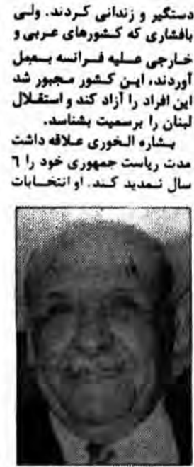
بشاره الخوری اولین رئیس جمهوری لبنان