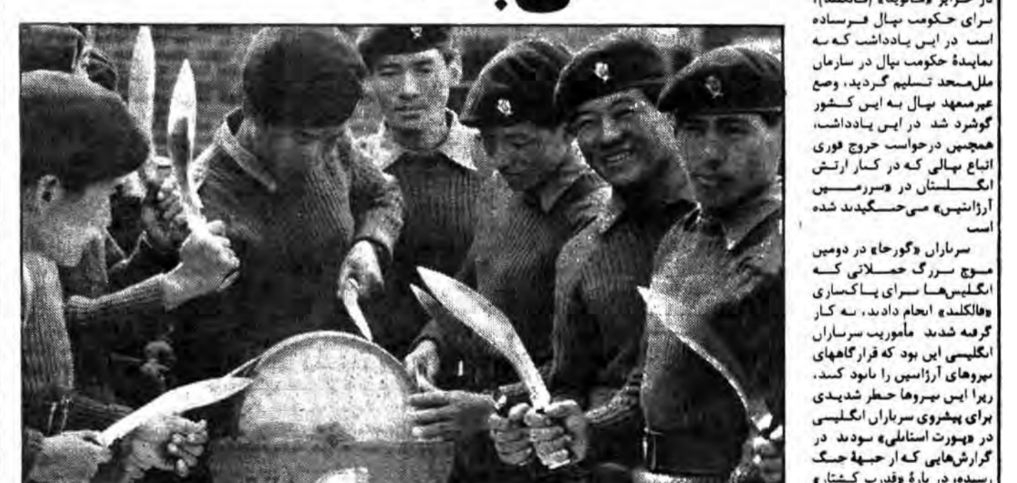
سربازان «گورخا» هور خادمان حلقه بگوش استعمار انگلستان هستند

پول کار می‌کند، نگران‌اند، ولی حکومت نیال سفیده دارد براساس موفقیتنامه سه جانبهی «مردن، سبتر از ترسوسودن است». انسان می‌تواند ببید که برای کشور نرسلی تنهی ساند نیال، درآمدهای «گورخاها» انگلستان می‌خواهد، مستقر از طریق «گورخاها» ساله ۲۰۰ میلیون نیالی است. «وقال توجیه بارشستنی‌ها، حقوق‌ها و دیگر و دیگر به دست می‌آورد. روزنامه نیالی «سامای» به نحو پاکیزه‌ی جنوبی اقیانوس اطلس خدمت می‌کند، شده‌اند هرچند که گروه سربازان انگلیسی به قیاس فرستاده شد، مطبوعات ترکی آنها را به عواص سردران ترکی کردید. وضع مردوزان «گورخاها» را