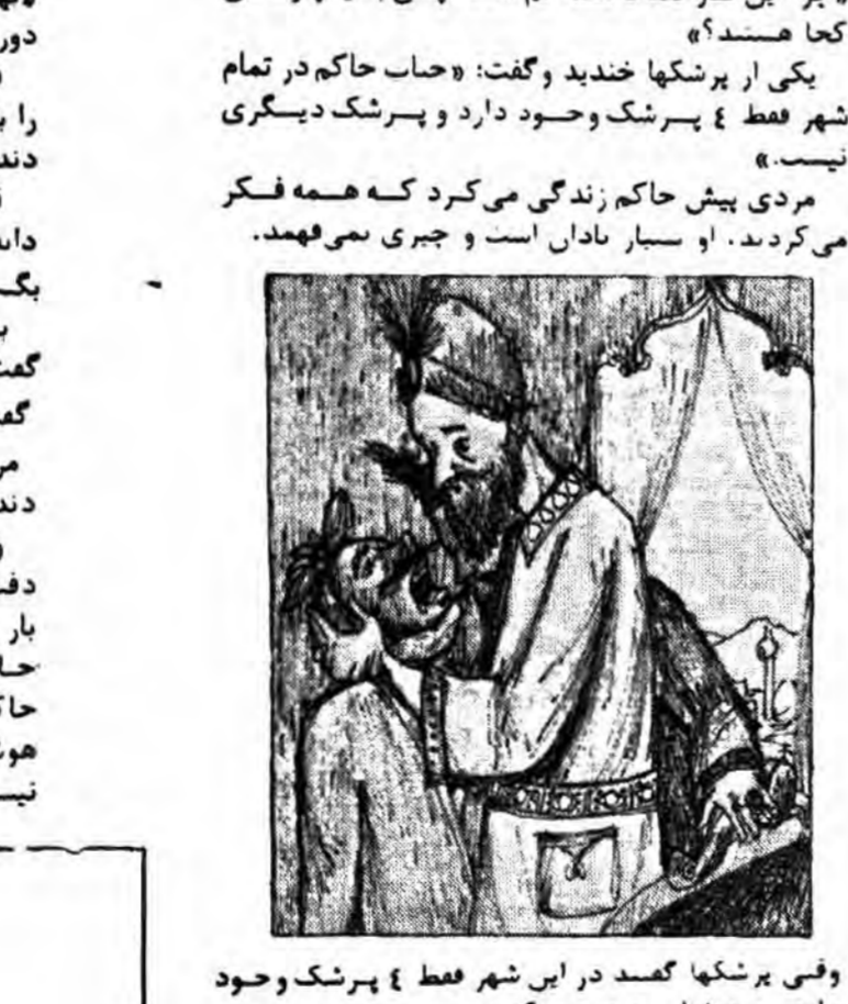
وقتی پرشکا گفت در این شهر فقط ۴ پرشک وجود دارد...