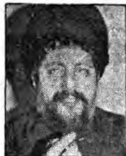
محرورین لبنان در انتظار سید موسی صدر