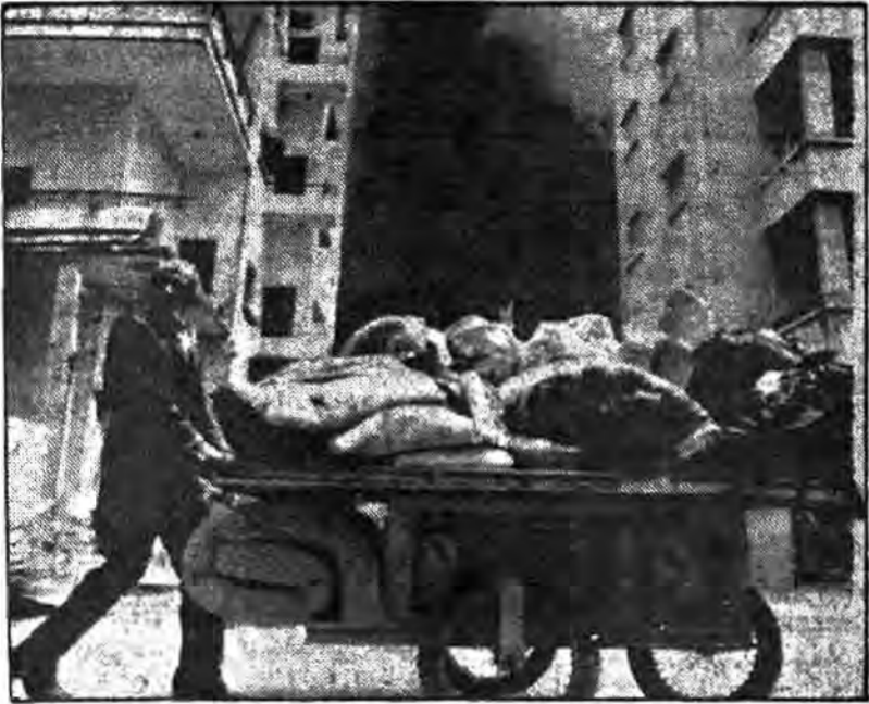
حمله اسرائیل باعث شد دهها هزار نفر از مردم مسلمان و مستضعف لبنان بی خانمان و آواره شوند.

آنچه که جدا میجوایست انجام گرفت سارن، آمریکا برای حمله به منطقه، بزرگترین خطر موجود در منطقه را اسلام میدانند و لذا سعی در محو کردن کشورهای منطقه نموده است. چنانکه در حواصت یسراک دال شروع جنگ صلیبی بر علیه کومیسه بر، برای جلوگیری از خطر اسلام میباشد. کسی نیست که علت شروع جنگ صلیبی رژیمهایک مردم کشورشان را منلمان تشکیل میدهند بدانند. علیرغم این امر، ساکت ماندن این کشورها برای منافع متقابل خودشان است. یسکی از محل‌هاییک پیش از همه تحت محافظت شدید است یسکه ساحمان سازمان ملل میباشد، اما با وجود ایهمه تدابیر شدید امنیتی، مورد حمله قرار گرفتن و لایتنی وزیر امور خارجه ایران در سازمان ملل نیز میبایست از بیات شد آمریکا بر علیه ایران است.