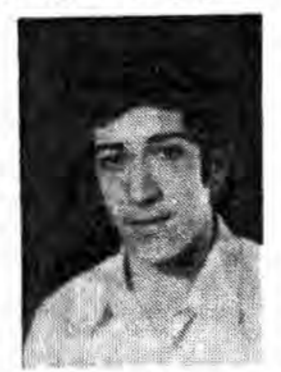
در مورد شهید محمد باقر کشمیری: