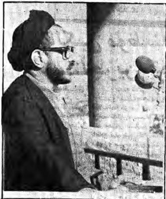
الله علیه یکی از فرزندان و