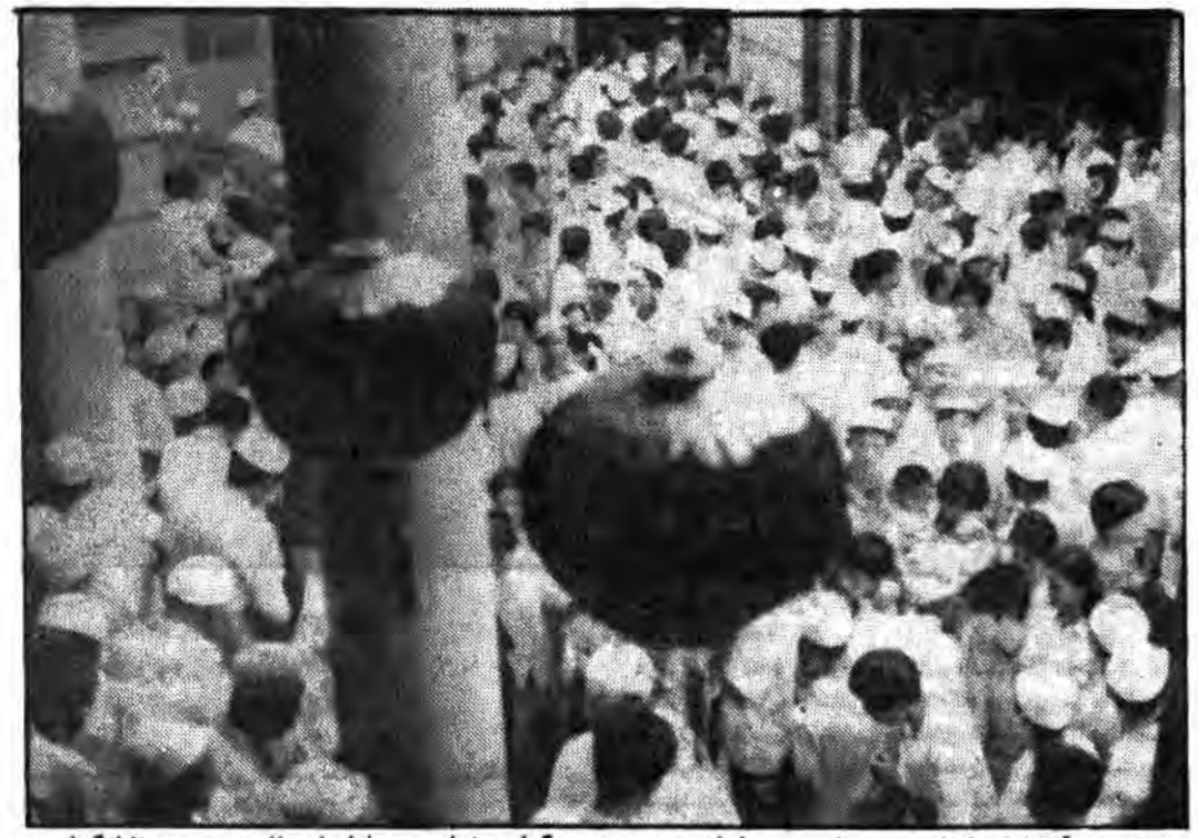
شرکت آزادانه زنان! و مردان مسلمان چین در برگزاری نماز عید فطر امسال در مسجد شانگهای.

در دوران انقلاب فرهنگی (۱۹۶۶-۱۹۶۷) که فسانیت‌های مذهبی در چین منع گردید، و اکثر مساجد میل به کارخانه، انبار و تیم خانه شدند، و رهبران مذهبی به مزارع و کارگاه‌ها روانه گردیدند، مسلمانان چین را اما تحت فشاری سخت قرار داد، اما نتوانست مبارزه آنان را متوقف سازد. با تبادل نظرهایی که بین مسلمانان ساکن در کلیه‌های محقر پکن صورت گرفت، و عکس‌العمل‌های شدیدی در مقابل «گارد‌های سرخ چین» به وقوع پیوست که به قسمت از دست دادن جان بسیاری از هر دو طرف منتهی شد. باخوش آیند، به گارد سرخ دستور دهنده تا از توهین به مقدسات مسلمین خودداری کنند. به دلایل مذکور و به همان نسبت وجود احساسات جدایی طلبی در بین مسلمانان و مسین کبانگ و نیز کوشش روسیه برای بهره گیری از این جریان، مسلمانان میخوانند نگران نشوند. تنها استثناء در این جریان، ارتباط مسلمانان و مسین کبانگ است که مردم پاکستان بود. نظر باینکه جمهوری خلق چین از حکومت پاکستان و اهدافش نگرانی ندارد. مبادرت به ساختن جاده‌های استراتژیک در ناحیه کرد که هدف از آن، ایجاد و گسترش مناسبات اقتصادی بین هر دو کشور و نیز دادن کمک نظامی به پاکستان بود. این جاده معروف ۸۰۰ کیلومتر طول دارد و پس از عبور از کوه‌های فرار فروروم به طرف واکون، که در ۳۰۸ کیلومتری شمال غربی اسلام آباد قرار گرفته است، ادامه می‌یابد. اهمیت این جاده در این است که