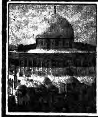
مردم فلسطین را می‌گویند که او را بنیانگذار فلسطین می‌نامند.

مردم فلسطین را می‌گویند که او را بنیانگذار فلسطین می‌نامند. شیخ عزالدین قسام بنیانگذار انقلاب اسلامی فلسطین است.