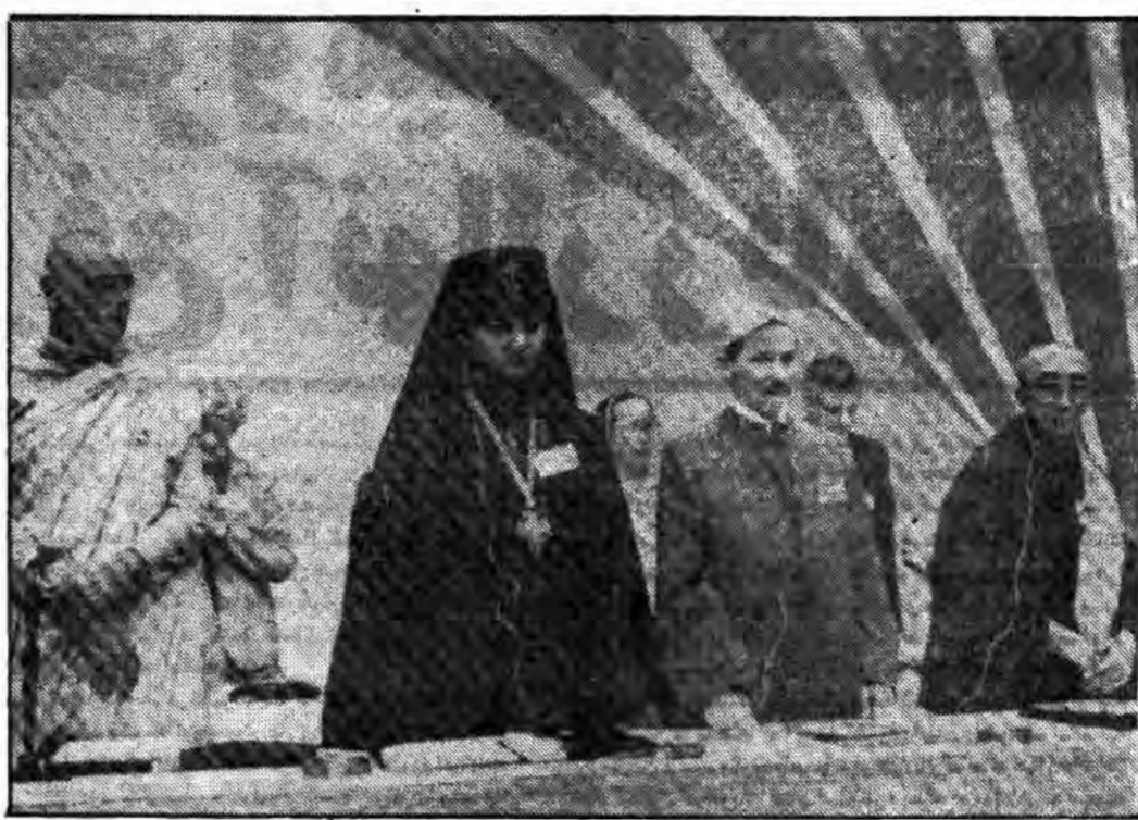
گوشه‌ای از برپائی کنفرانس اسلامی منعقد در توکیو