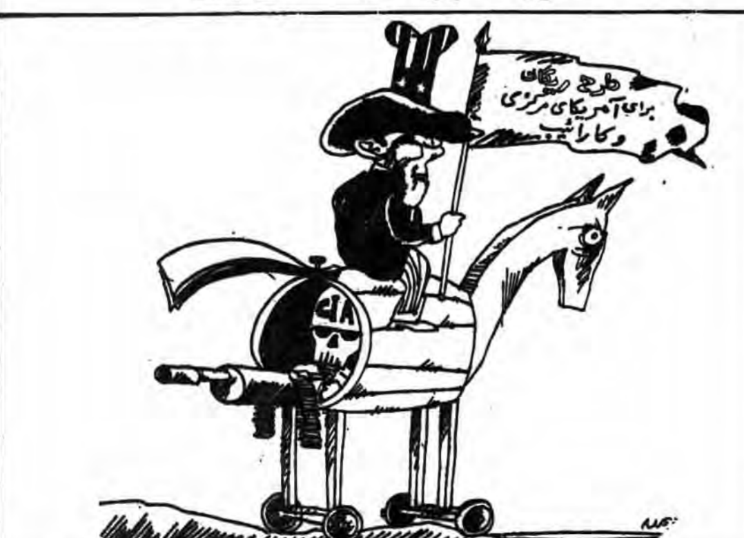
د اسب تروای شیطان بزرگ در آمریکای لاتین کاریکاتور از: مطبوعات آمریکای لاتین

موشک ترابندت یک از نوع SLBM (C-4) در پرتاب آزمایشی دیده میشود و در سمت چپ خط عبور کلاهکها در میان طبقه فوقانی جو مشاهده میگردد. این موشک دارای ۷۴۰۰ کیلو متر برد و مجهز به ۸ کلاهک میباشد علاوه دستگامی خودکار که با شلیک هر کلاهک، مجدداً موشک را مسلح میسازد. ۸ کلاهک مذکور هر کدام با بردی بیش از ۱۰۰ کیلومتر قادر به هدف گیری بوده و برای هدفهای مختلف بکار میروند. طراحان پنتاگون برای سال ۱۹۹۰ خواستار تولید ۹۹۲ عدد از این نوع موشک شده‌اند که روزی ۴ یا ۵ زیر دریایی SSBN کلسیسی تا دهه ۹۰ استقرار یابد.