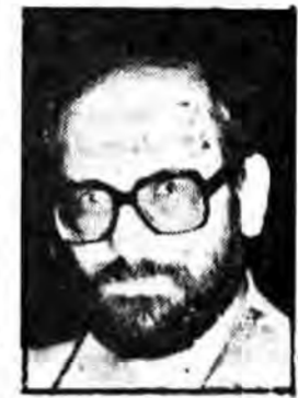
مصاحبه اختصاصی با نماینده مردم شهر بابک

بسم الله الرحمن الرحيم واکشی که حکومت‌ها در قبالت تجاوز اخیر صهیونیست‌ها در لبنان نشان دادند و همچنین عدم اتحاد مواضع اصولی بر علیه اسرائیل به خاطر مخالفت و قتل عام مسلمانان در بیروت و کشته شدن صهیونیست‌ها و کشتار دهنه جمعی ساکنین اردوگاههای «صبرا» و «تسلا» را نمی‌توان مستعدانه تلقی کرد و طبعاً در چنین شرایطی نباید انتظار داشت که خاموشانه روی آرامش به خود ببیند. چرا که واکنش‌ها موید آن است که حکومت‌ها نسبت به حیایات گسترده صهیونیست‌ها از حمله گسترده کودکان بی‌گناه و قتل عام بیچارگان بیمارسانها و تجاوز به زنان و حیایات تکان دهنده‌ای از این قبیل بی‌نماید و یا دست کم قادر به موضع‌گیری در برابر این تجاوزات است.