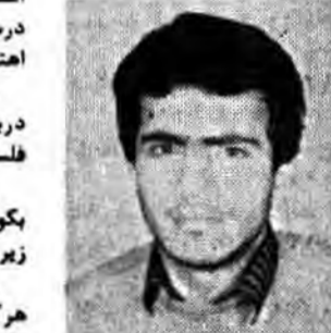
بسم الله الرحمن الرحيم... والحمد لله رب العالمين

اللهم... محمد رسول الله... روز جشن استقلال و آزادی ما مبارک باد