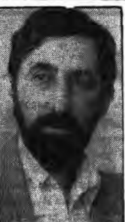
عزت سلف وزیر خارجه

امریکا حمایت میکند مزدور لقب میدهد، گفت: اصل سؤال صحیح نیست، ما به هیچ عنوان به همه کشورهای منطقه مردود نگفته‌ایم، بلکه فقط به حکومتی که مردود میگوید که خط مشی سیاست خارجی و با سیاست کلی آنها را آمریکا بدکته می‌کند، این حکومتها بجای اینکه در جهت دفعه واقع منتهای خود گام بردارند در پی تأمین اهداف امریکا در منطقه هستند که نمونه بارز آن رژیم شاهنشاهی است و چندین قبل هم مطبوعات امریکا فاش کردند شاه حسین از سپاه حقوق گرفته است، بنابراین ما به حکومتی از این قبیل که تمامین کشنده مستنفع امریکا هستند، مزدور میگویم.