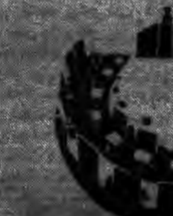
مجلس شورای اسلامی

خاتمی، از مای و رفیق دوست از مجلس رای اعتماد گرفتند