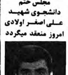
ان الله اشتری من المؤمنین انفسهم و اموالهم بان لهم الجنة