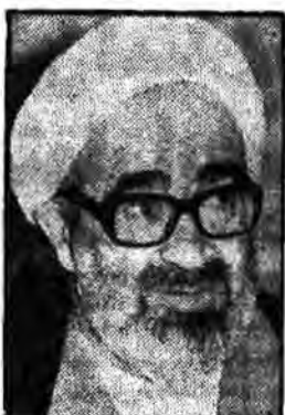
بسم تعالی حضور آیت‌الله العظمی امام جمعه محترم اصفهان داماد فاضلانه پهلوی پهلوی ابرار لشکر طاهری که با ایثار و فداکاری جوانان عزیز امت ما بنیست آمد بدریگرمعادلات مادی و کوردشمنان اسلام را برهم زد و ثابت نمود یک ملت زنده و انقلابی را بنیستوان مورد تعلق فرزند.

روحانیت ارتقا و فضایل انسانی که جوانان سلحشور و مبارز ما در پرتو انقلاب عظیم اسلامی در خود سوخود آوردند یادآور تاریخ پرشکوهِ مسلمانان فداکار صدر اسلام است که هر چه در یک تن محقق و فلابت درونی بدست نمی‌آید خود این عصر مومن و عقیق حجت را بر ما و همگان تمام نمود چون پاک این جوانان عبور است که پیوسته انقلاب اسلامی را اسپهانید و در حال گسترش و شکوفایی نگاه داشته، درود و رحمت خداوند به روان پاک و مطهر آن باد.