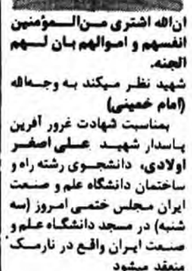
ان الله اشتری من المؤمنین انفسهم و اموالهم بان لهم الجنة