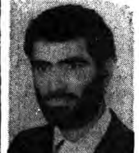
ان الله اشتری من المؤمنین انفسهم و اموالهم بان لهم الجنة