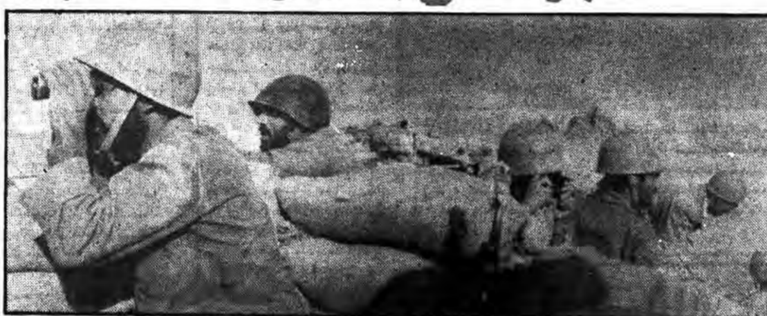
گوشه ای از ارتفاعات مشرف بر شهر مندلی عراق

لشکر اسلام قدرت رزمی خود را در اطراف شهر مندلی بنمایش گذاشت