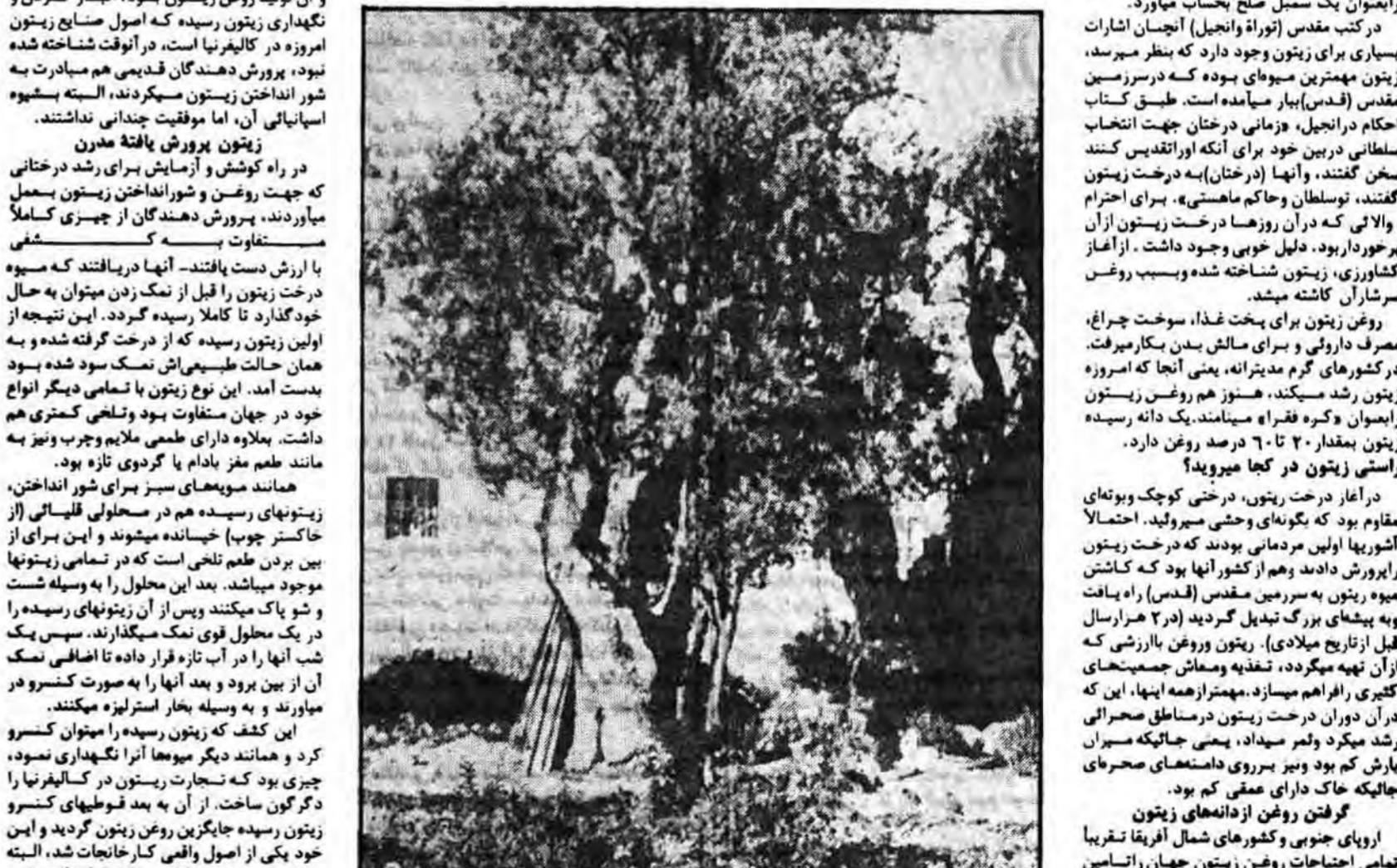
این درختهای زیتون که در باغ گتسمین (Gethsemane) قدس روئیدمانند قرنها قدمت دارند

در زمانهای پیش زیتونها را بین سنگهای آسیا خرد میکردند، اما اکنون برای اولین بار در مکزیک کاشته شدند و بعد در سال ۱۷۶۹ بوسیله مسیلمین (Franciscan) مذهبی سفر فرانسویان است