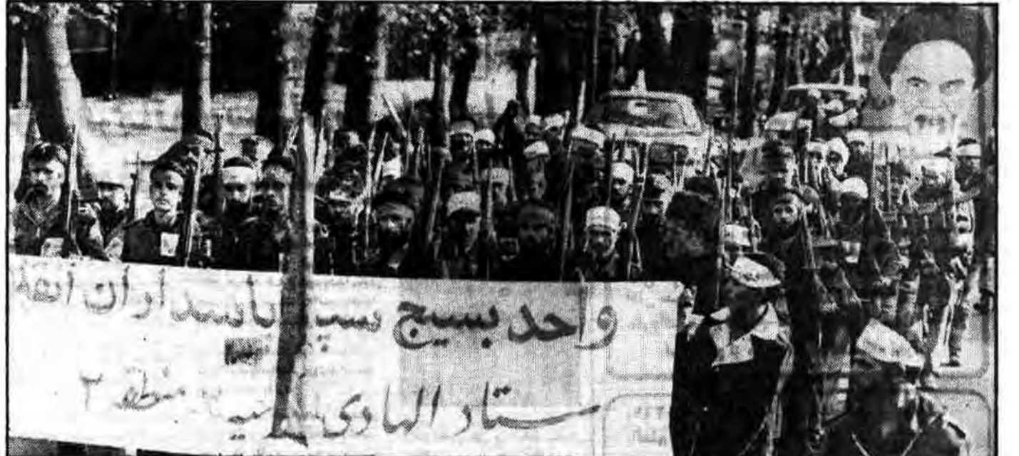
واحد بسیج سپاه پاسداران

ارتش ۲۰ میلیونی سپاه پاسداران انقلاب اسلامی، جریان بانده نظامی نسل انقلاب صحیح دیزور با رژه با شکوه واحدهای سازمان یافته خود به نبروی ایفای نخستین روز از هفته بسیج را گرامی داشتند.