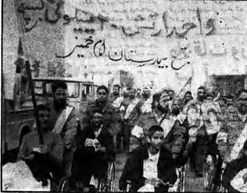
دو سال پیش سیاه باده شد

ارتش ۲۰ میلیونی سپاه پاسداران انقلاب اسلامی، جریان بانده نظامی نسل انقلاب صحیح دیزور با رژه با شکوه واحدهای سازمان یافته خود به نبروی ایفای نخستین روز از هفته بسیج را گرامی داشتند.