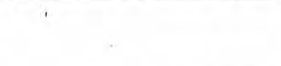
جمهوری اسلامی ایران