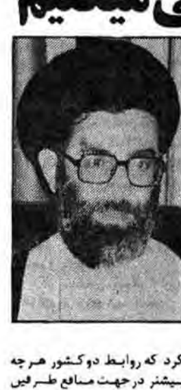
وزیر خارجه صحران

ایران که استقلال خود را در دست آورده بدیده تحسین می‌گردد. آنگاه آیت‌الله خامنه‌ای با اشاره به سیاست نه شرقی نه غربی کشورمان گفت این اصل مهم ما را نه طرف دوسی ما جهت کشورهایی سوق میدهد که تحت تأثیر سیاستهای سرگ جهانی قرار داشته باشند ما همچنین در زمینه‌های اقتصادی سابقا با کشورهای منطقه همکاری داشته‌ایم که تجربه‌های نخب گذشته را برای ماندنای نگند ما علاقه داریم با کشورهای منطقه روابط اقتصادی بیشتری داشته باشیم که در دهه‌های سلطه گرانه در لای این روابط وجود داشته باشد.