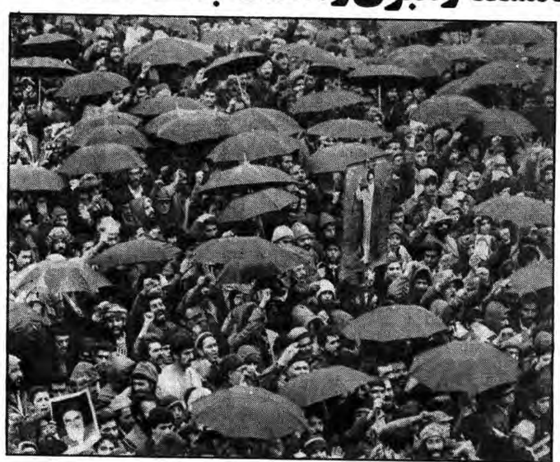
مراسم پرشکوه اربعین سالار شهیدان حضرت ابا عبدالله الحسین صبح دیروز (دوشنبه) در زیر بارش شدید برف با شرکت انبوه بی شمار در میدان شهیدان تهران...