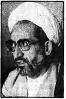
آیت‌الله شمشکی (از استان آذربایجان شرقی):