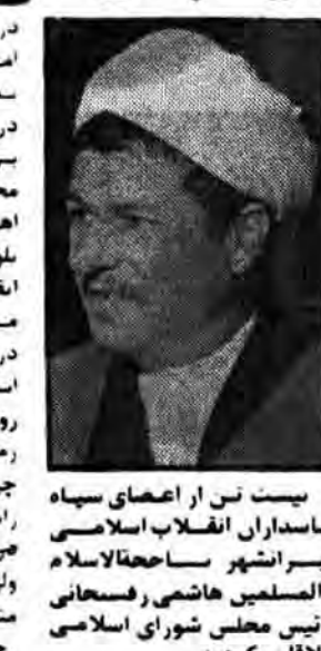
رئیس مجلس شورای اسلامی