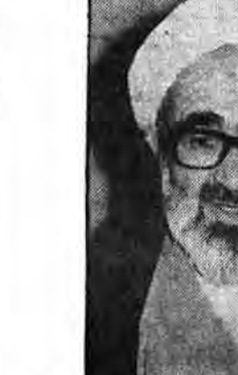
آیت‌الله العظمی منتظری

از طرف دیگر تعداد زیادی از گروه‌های مسلمان مبارز در مصر در معرض خطر اعدام قرار گرفتند بسیار حای نعت است که سران مرجع مسقطی هسور از سر نوشت شاه خانی ایران و انورسادات معدوم عبرت نمگیرند. دولت‌های خائن و دست‌نشانده در این کشورها بداندند برای همیشه نصیب‌اند با سرکوبی و برقراری حکومت حقان و سربره به از سانس حسانه‌های خود خدمت نمایند. رشد و آگاهی ملتها در حال شکوفایی و نهضت اسلامی در ملتهای محروم و مظلوم در حال گسترش است ملت برادر و مظلوم مصر هم بداندند برای نجات از شر حکومت فاسد و دست‌نشانده خود راهی جز هادکاری و قبول شهادت در راه خدا ندارد اگر مسلمانان از جریان‌های منته و توطئه‌های که توسط دشمنان اسلام و مسلمین و در رأس آن آمریکا و صهیونیسم اشغالگر در حال اجرا است بسادگی و با بی‌تفاوتی بگذرند بروی فرصتها از دست می‌رود و به نهضت جهانی اسلام سره سنگینی وارد میشود باید ملتهای زیر ستم را به رمز موفقیت این نهضت عظیم در ایران اسلامی آگاه نمود و تحریکات و دستاوردهای فکری و انقلابی آنرا در اختیار آنان قرار داد باید تصمیم گیری انقلابی و بدون از بازبهای سیاسی در برابر اشغال فلسطین و تخریب لبنان توسط اشغالگران صهیونیست و خطر آنها برای کبان اسلام و مسلمین و صلح جهانی همواره در صدر مسائل و وظایف اسلامی مسلمانان و بیروهای مبارز قرار گیرد. در خاتمه پیروزی