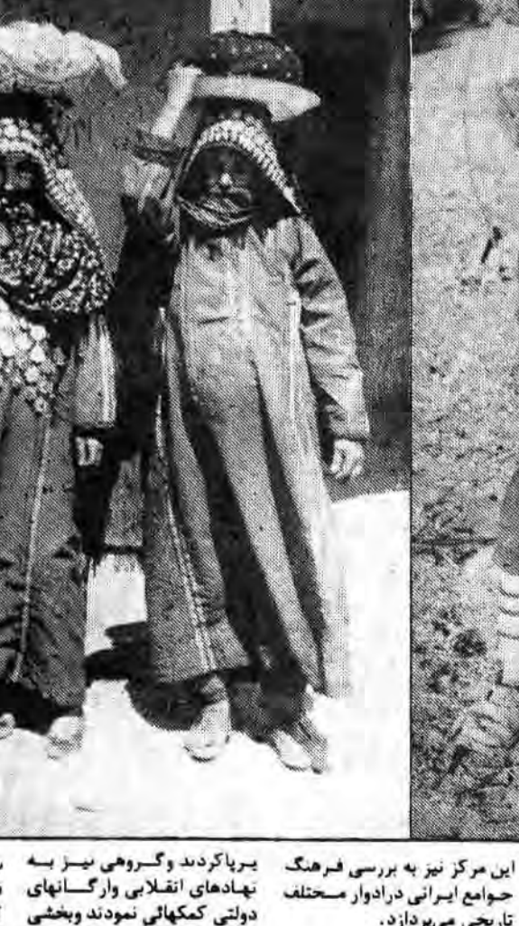
این مرکز نیز به بررسی فرهنگ اقوام ایرانی در ادوار مختلف تاریخی می پردازد.

مردم شناسی به گونه ای کلاسیک و فغانه قادر است که در جنبه های اجتماعی و فرهنگی جامعه را درک کند. این امر از طریق مطالعه و تحقیقات میدانی امکان پذیر است. در این زمینه، مرکز مردم شناسی با استفاده از روش های علمی و تجربی، به بررسی و تحلیل فرهنگ عامه می پردازد.