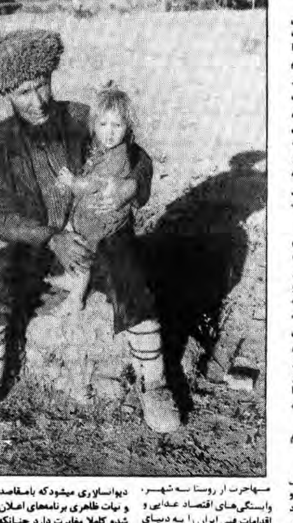
مهاجرت از روستا به شهر و وابستگی های اقتصادی و اجتماعی با سرگرازی جلسات متعدد سخنرانی، سخنرانیها و غیره در

مردم شناسی به گونه ای کلاسیک و فغانه قادر است که در جنبه های اجتماعی و فرهنگی جامعه را درک کند. این امر از طریق مطالعه و تحقیقات میدانی امکان پذیر است. در این زمینه، مرکز مردم شناسی با استفاده از روش های علمی و تجربی، به بررسی و تحلیل فرهنگ عامه می پردازد.