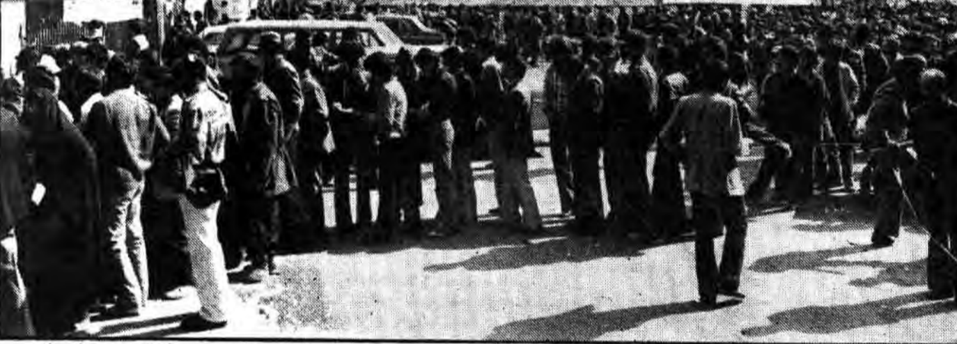
فردا برای چندمین بار ملت ما مورد آزمایش الهی واقع می‌شوند، بهم می‌پیوندند، متحد می‌شوند و دریایی از انسانها ایجاد میکنند تا رای قاطع خود را برای تشکیل مجلس خبرگان به صندوقها بریزند.

۱۲ صفحه جمهوری اسلامی پنجشنبه ۱۸ آذر ۱۳۶۱ - شماره ۱۰۲۲ - سال چهارم تک شماره ۲۰ روال